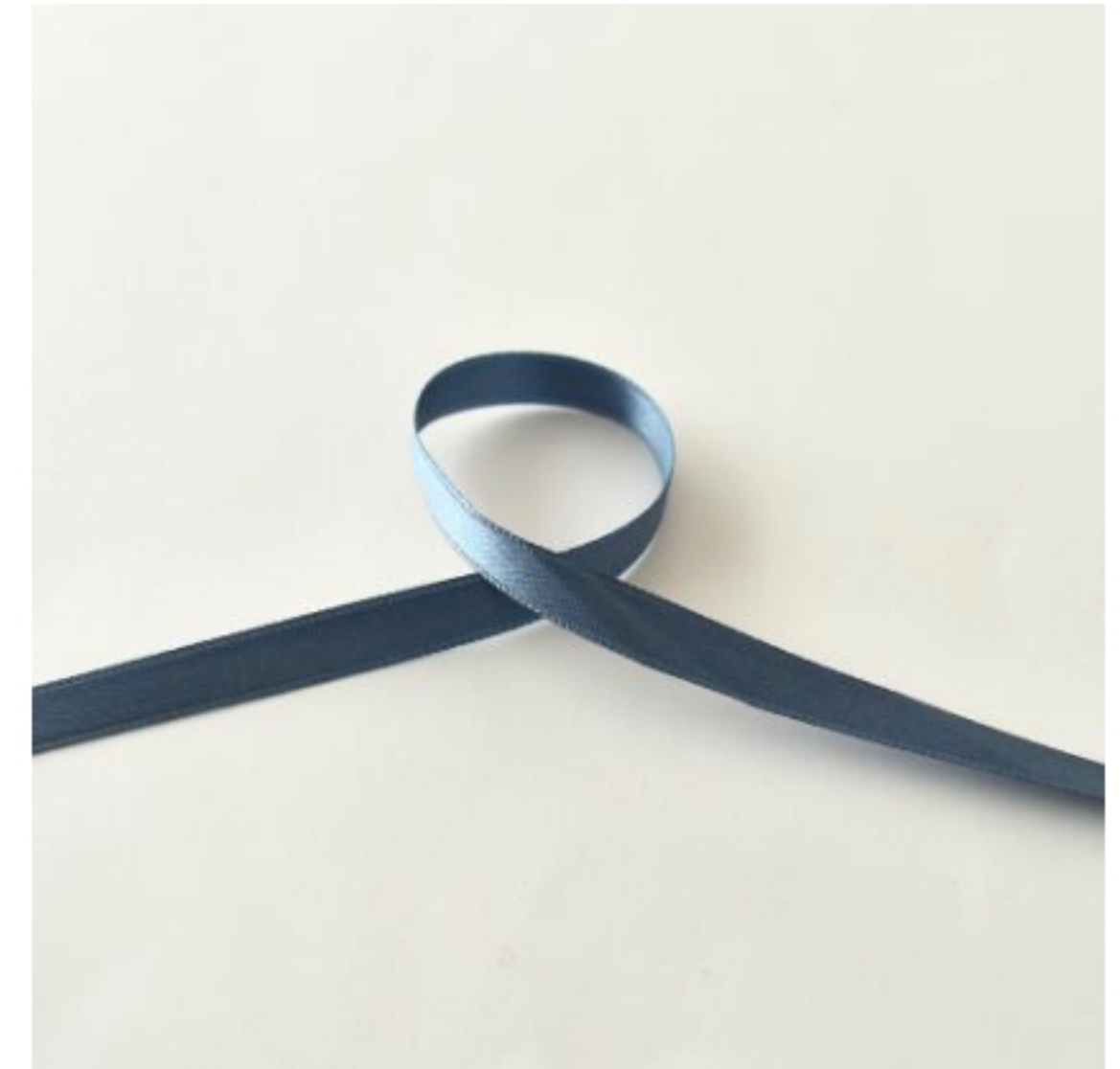
361(グレイッシュブルー)