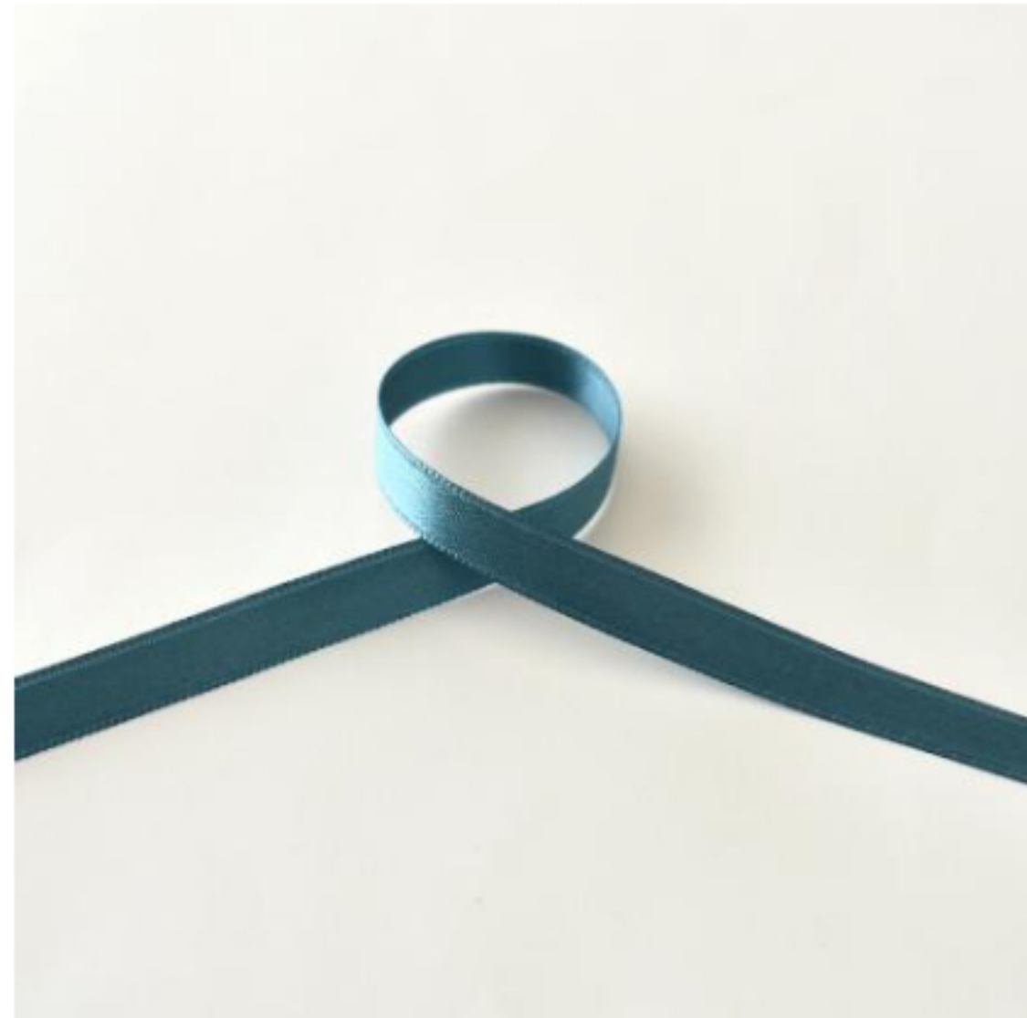
296(シックターコイズ)