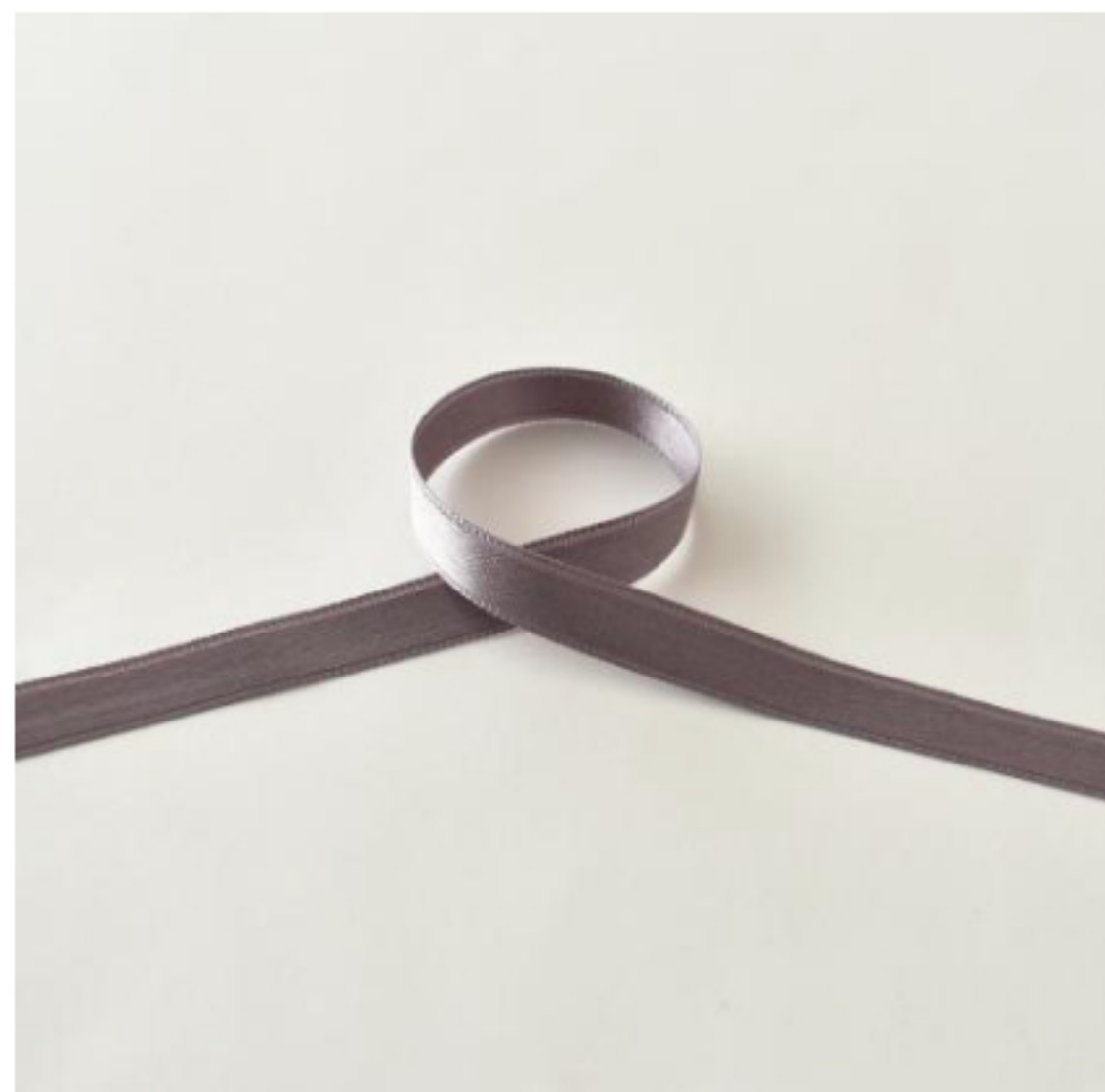
467(シックラベンダー)