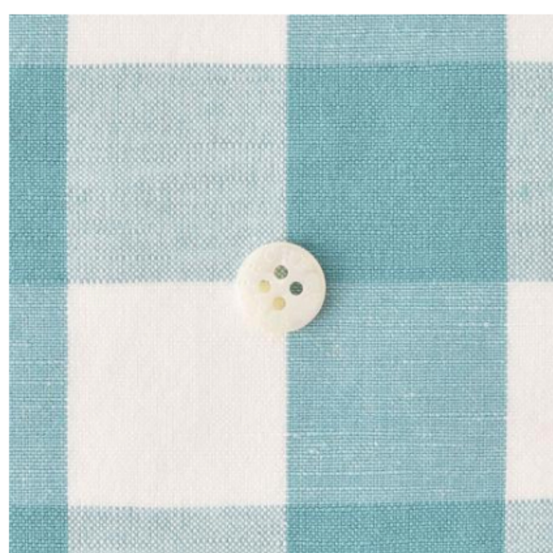
ペールグリーン (小)