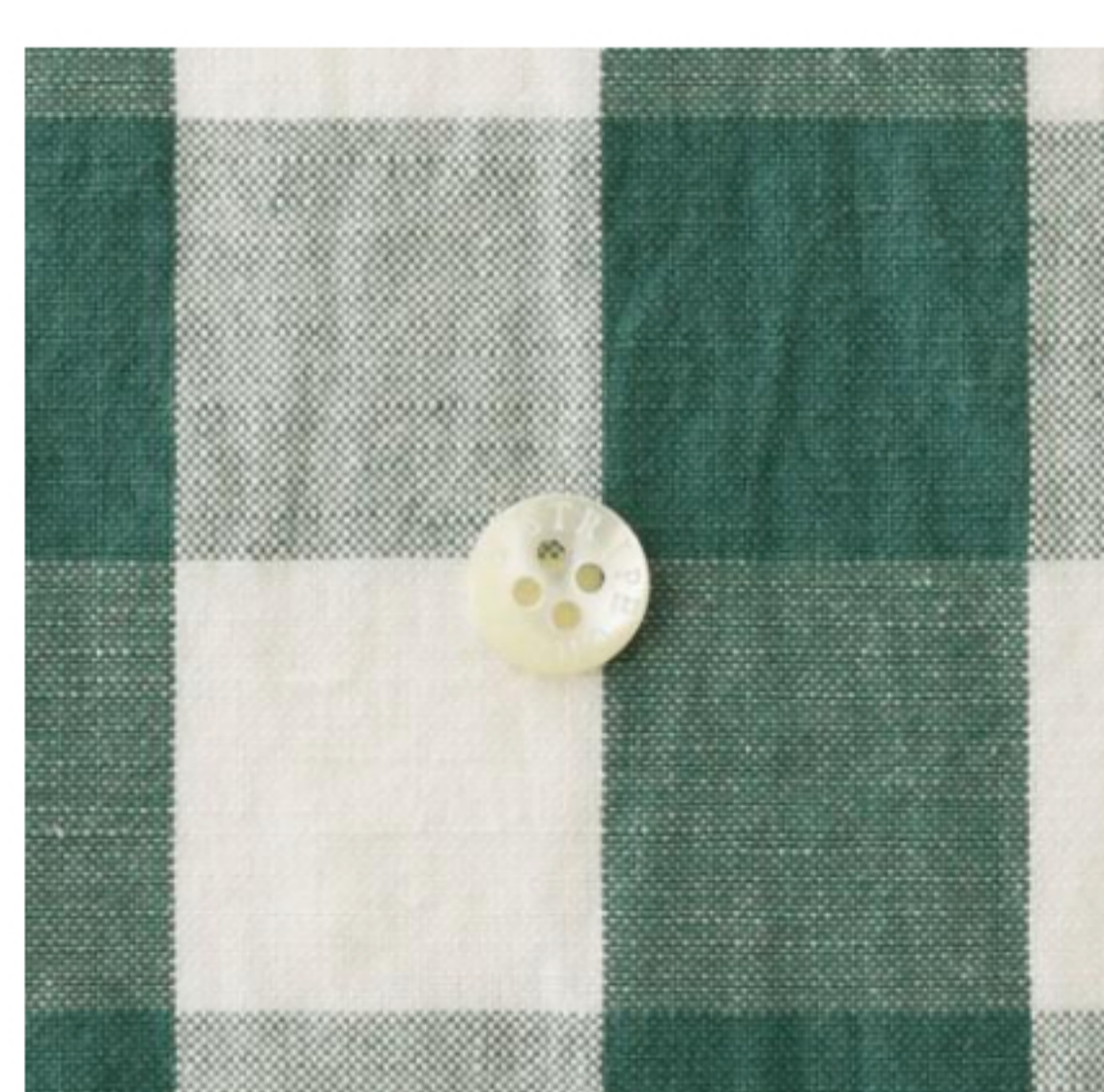
イングリッシュハーブグリーン(小)