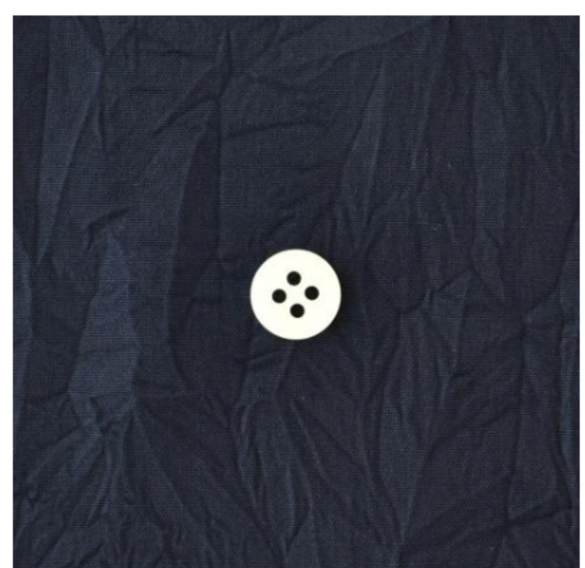
スタンダードネイビー