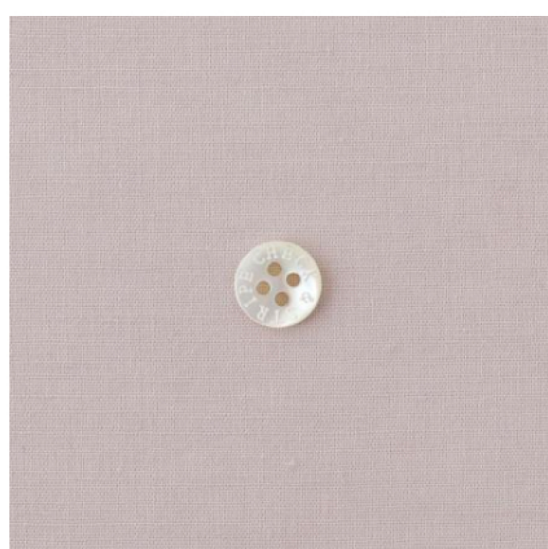
グレイッシュピンク