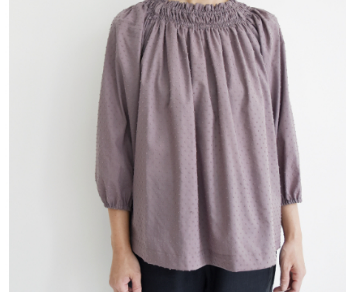
あずきミルク: 『CHECK&STRIPE SEW HAPPY』(世界文化社) ゴムシ ャーリングのブラウス