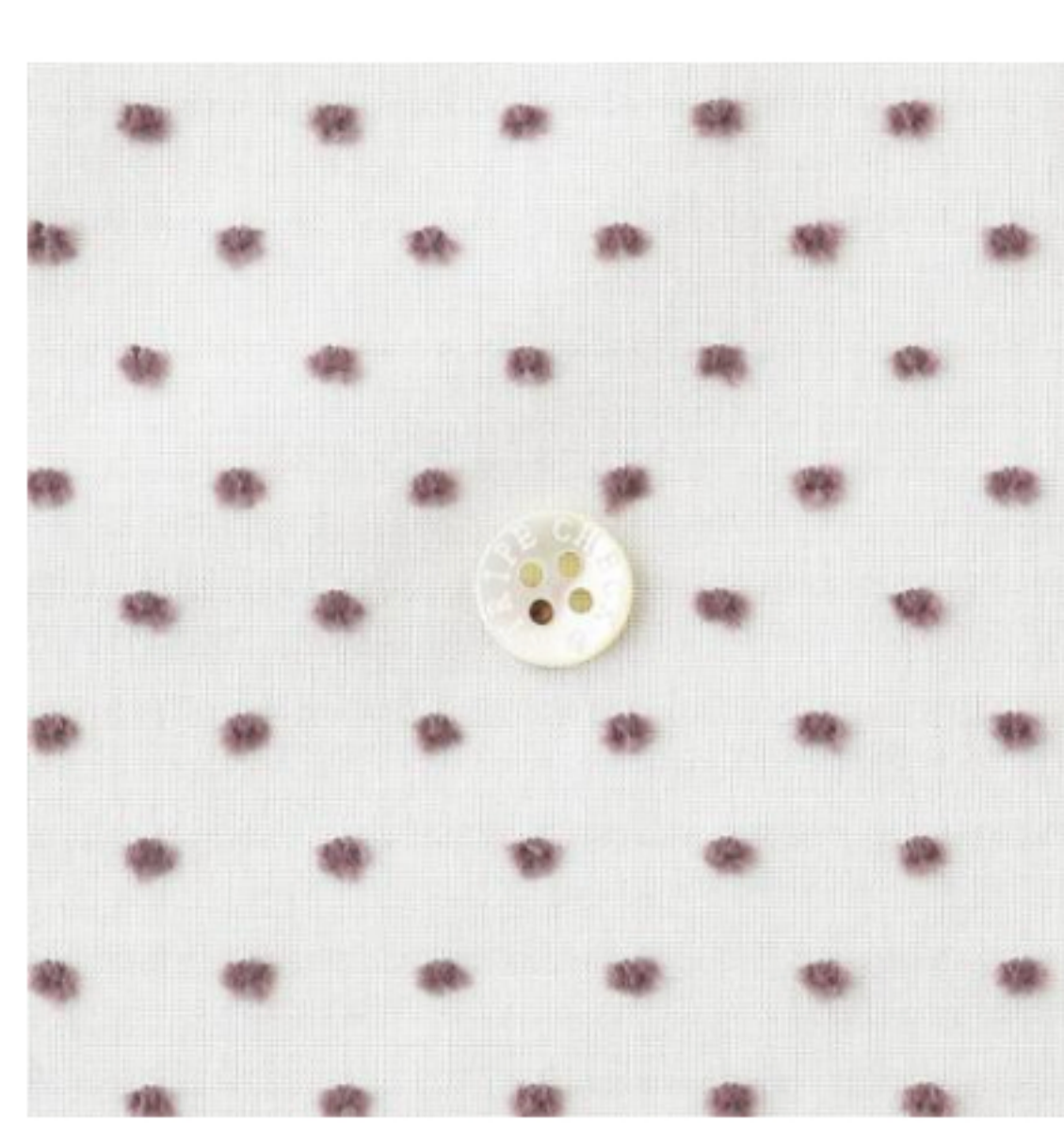
白にあずきミルク