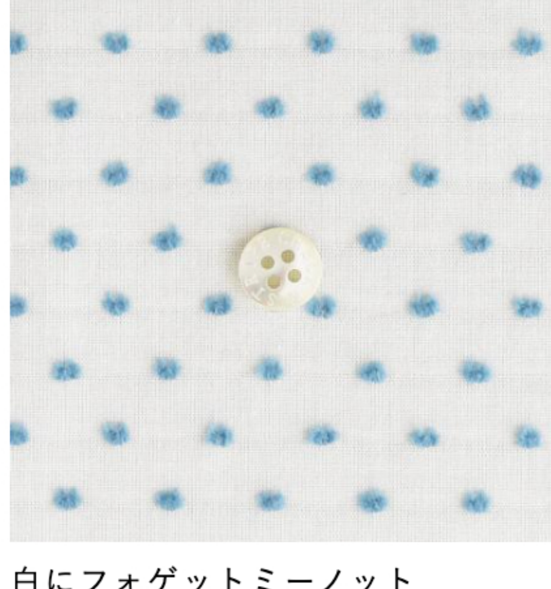
白にフォゲットミーノット