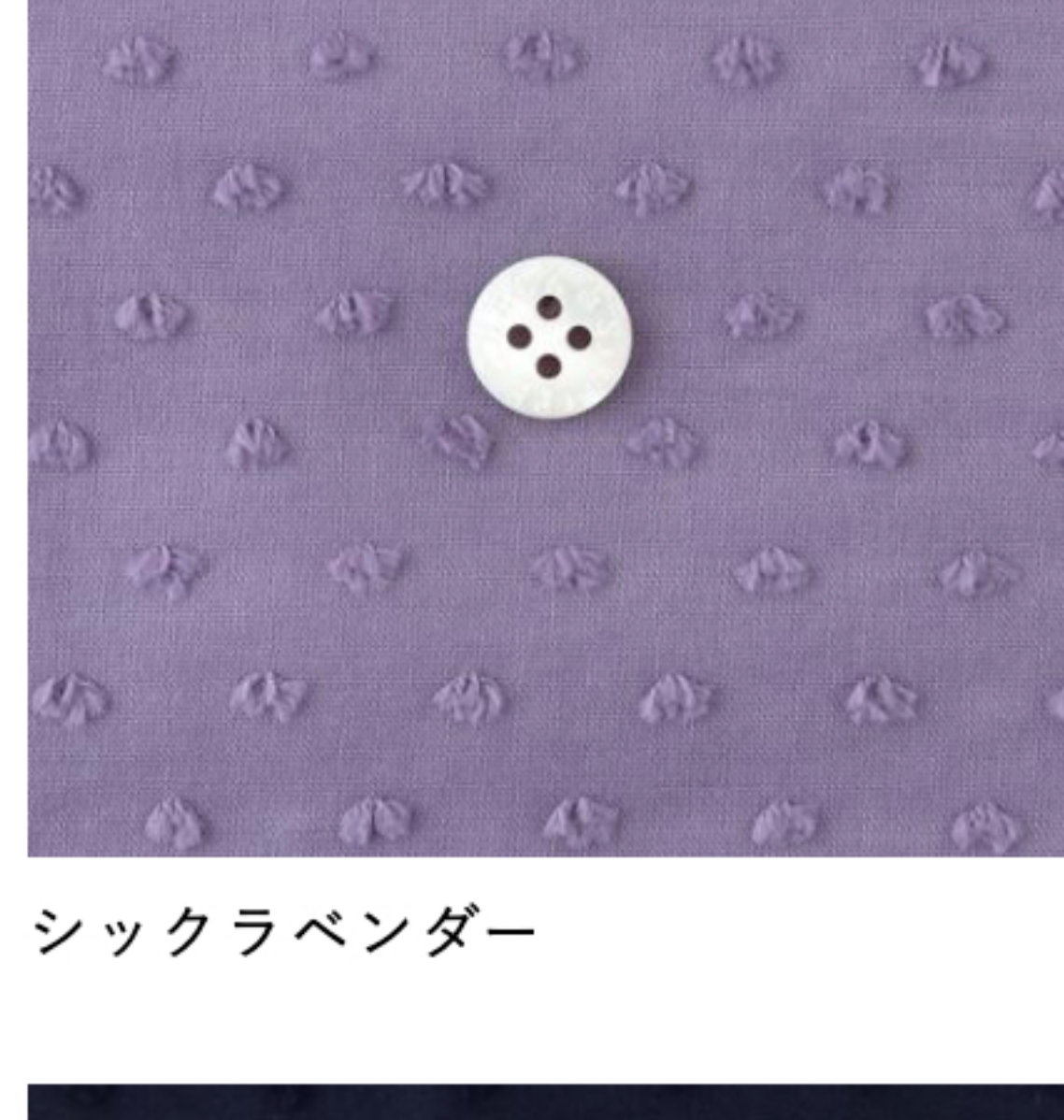
シックラベンダー