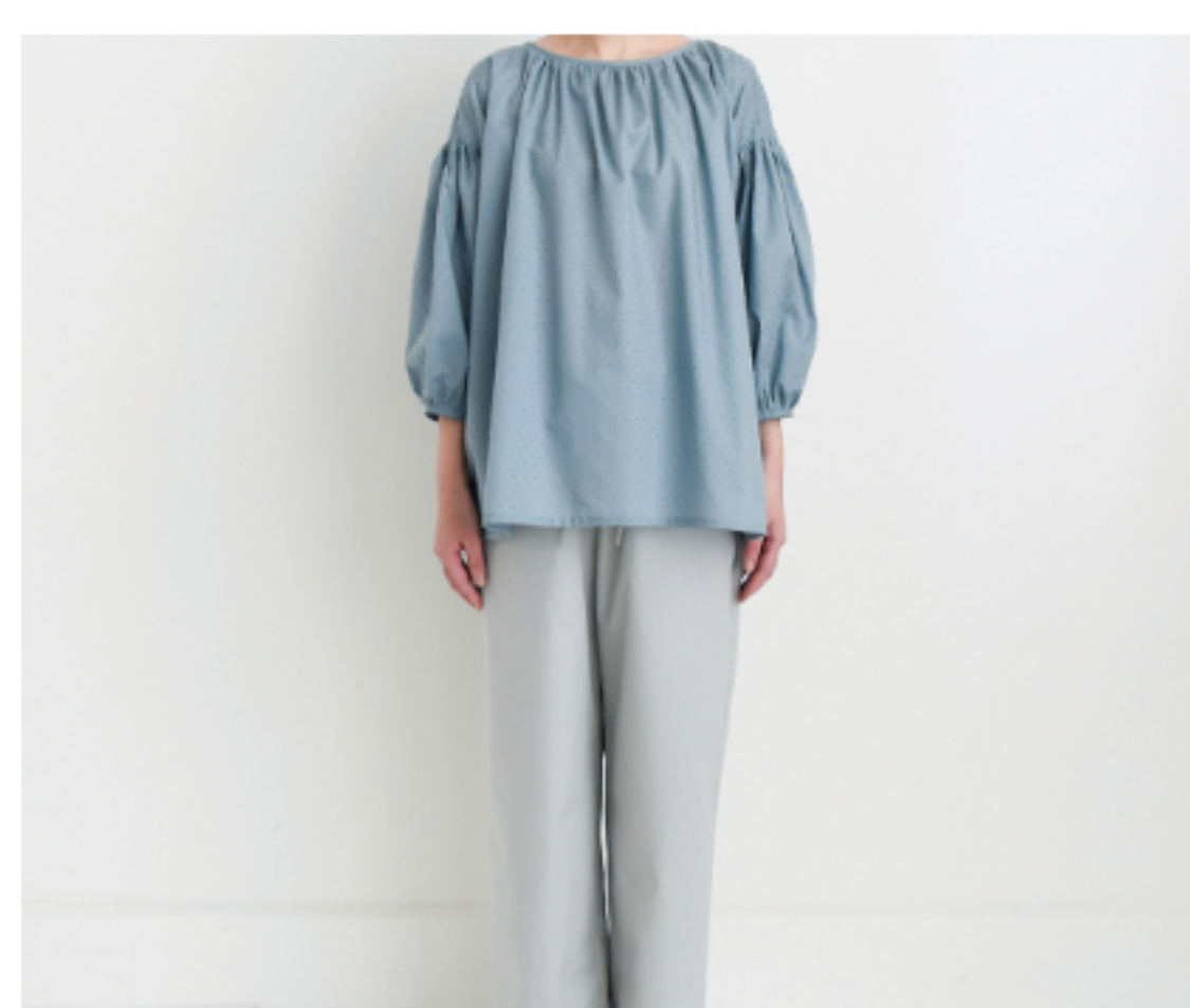
スモークブルーグレー: 『CHECK&STRIPEのおとな服 ソーイング・レメディ』(文化 出版局) スタンダードギャザー ブラウス