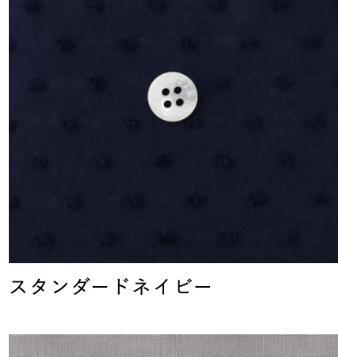
スタンダードネイビー