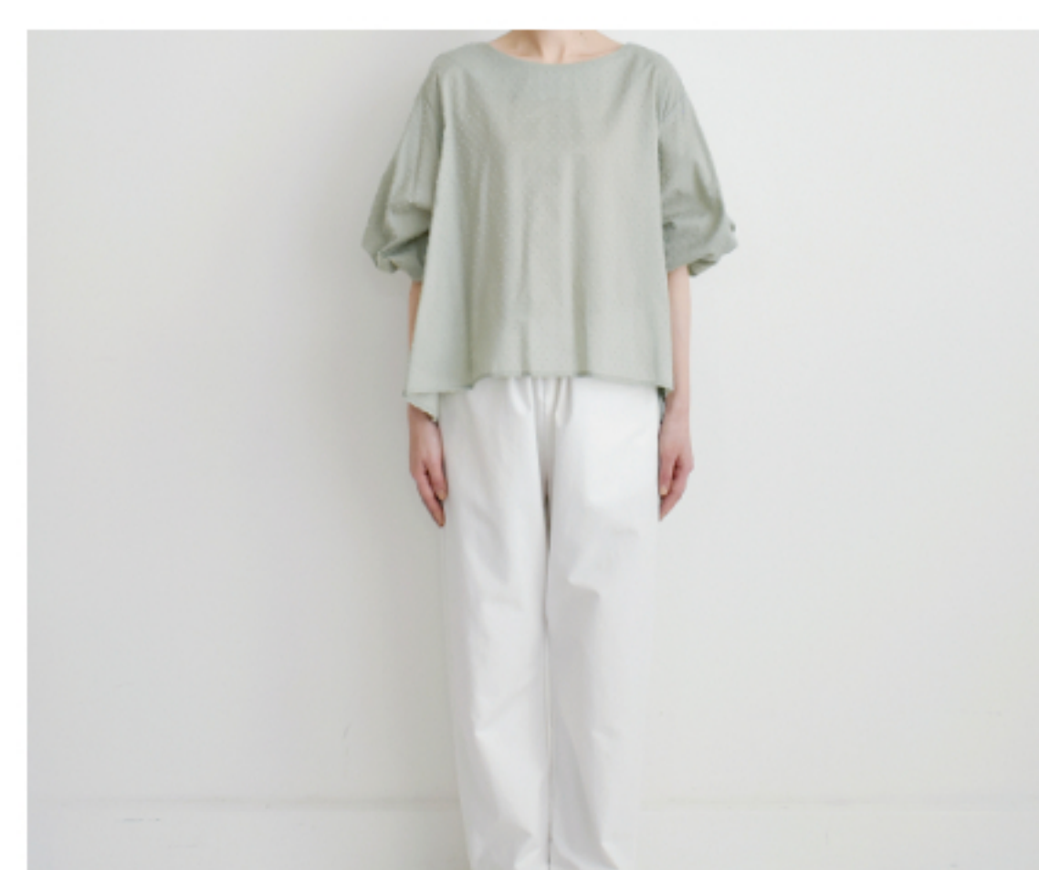
ミンティー:『CHECK&STRIPE のおとな服 ソーイング・レメデ ィ』(文化出版局) パルンス リーブのブラウス