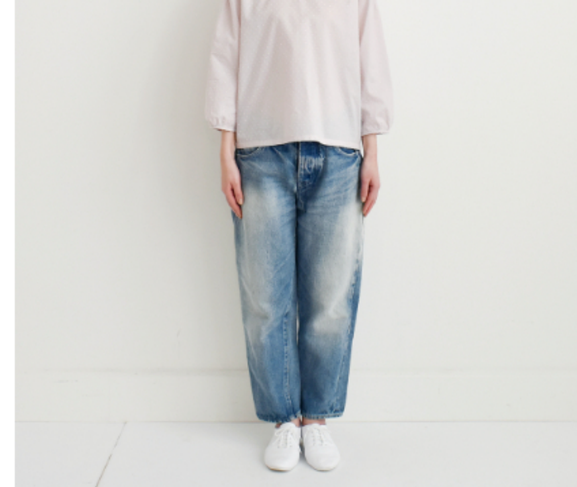
ピンクラベンダー:パターン 175(後ろボタンのブラウス)