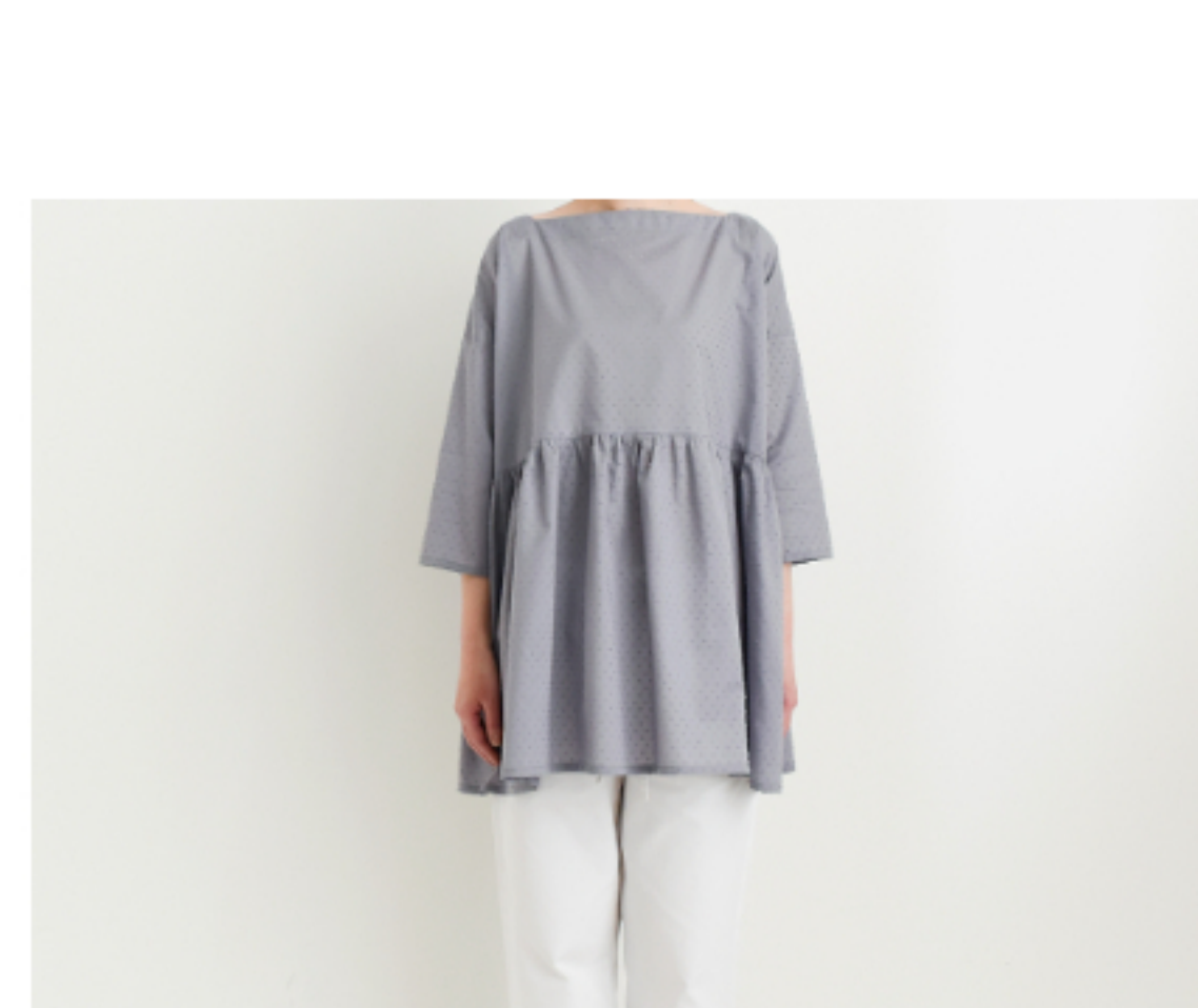
ラベンデュース: 『CHECK&STRIPEのおとな服 ソーイング・レメディ』(文化 出版局) スクエアネックのギャ ザーブラウス