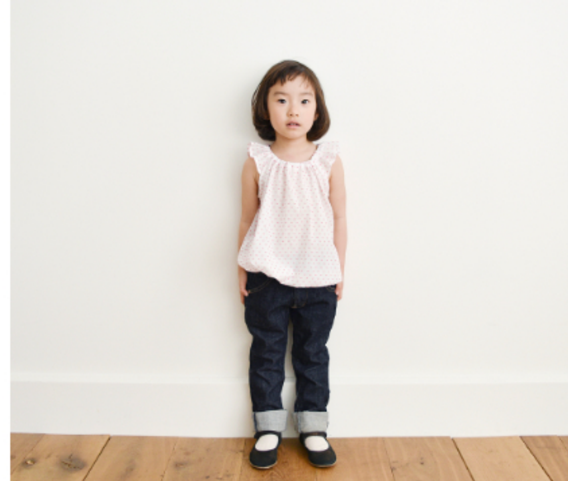
白にピンク:『CHECK&STRIPE SEW HAPPY』(世界文化社) 天使のブラウス 子ども