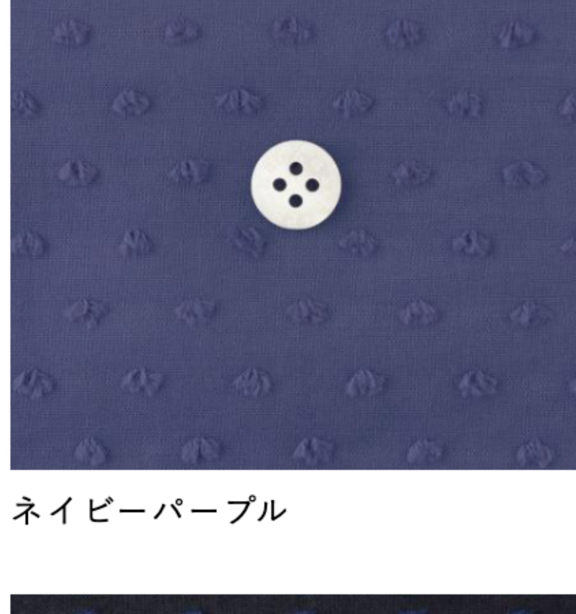
ネイビーパープル