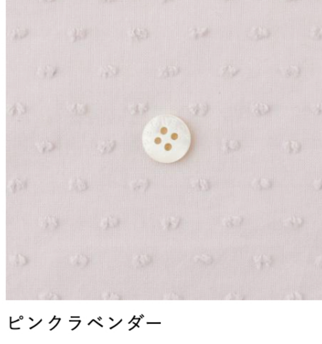
ピンクラベンダー