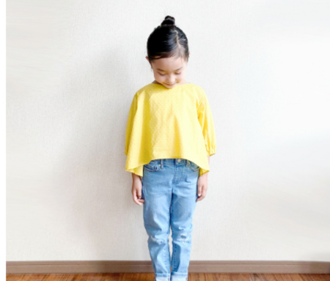
マリーゴールド: 『CHECK&STRIPEの子ども服 ソーイング・ナーサリー』(文化 出版局) パルンスリーブのブ ラウス