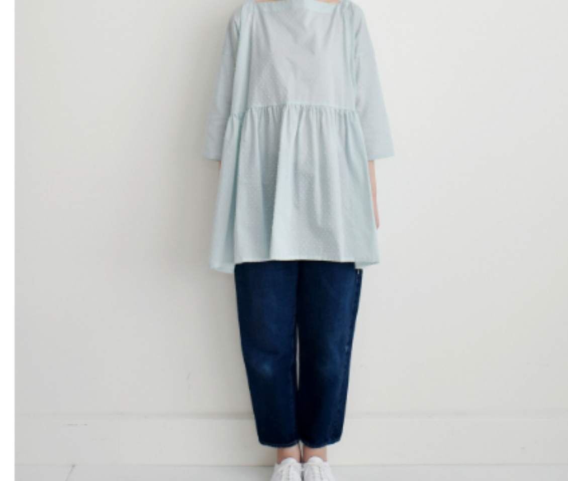
ペパーミント: 『CHECK&STRIPEのおとな服 ソーイング・レメディ』(文化 出版局) スクエアネックのギャ ザーブラウス