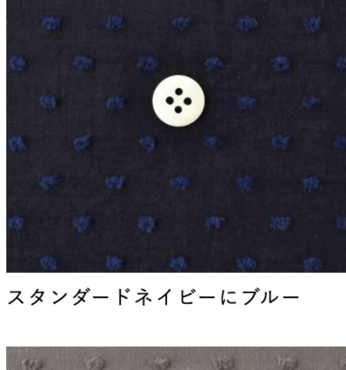
スタンダードネイビーにブルー