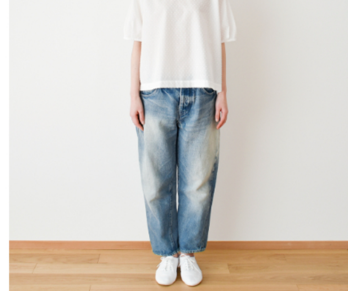
白に白:『CHECK&STRIPE Sewing Diary in Paris パリの ソーイングダイアリー』(世界文 化社) パフブラウス