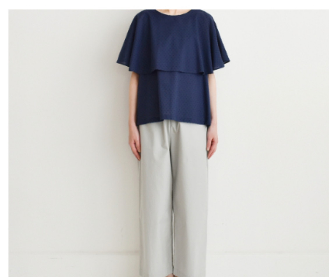
ダークブルー: 『CHECK&STRIPE my favorite 私の好きな服』(主婦と 生活社) ケープブラウス