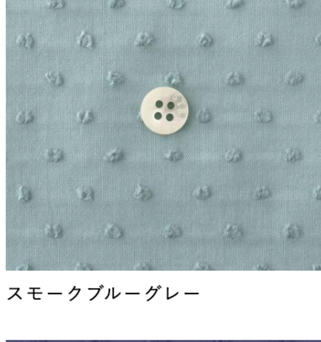
スモークブルーグレー