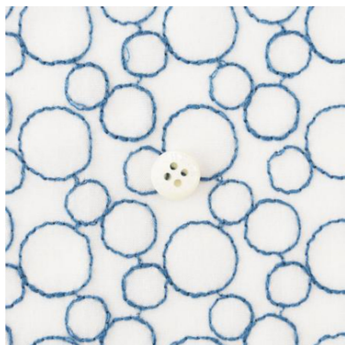
ホワイトにダークブルー