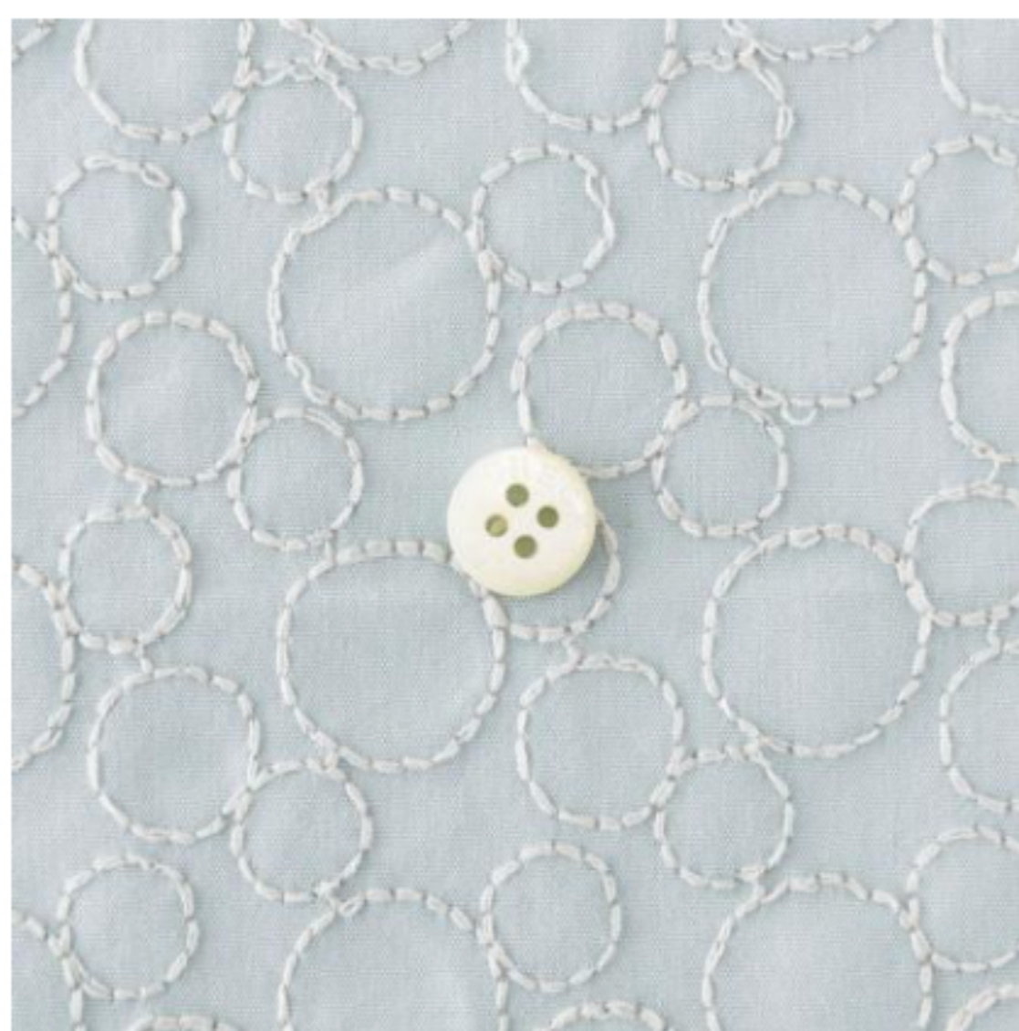
ペパーミントにパールグレー