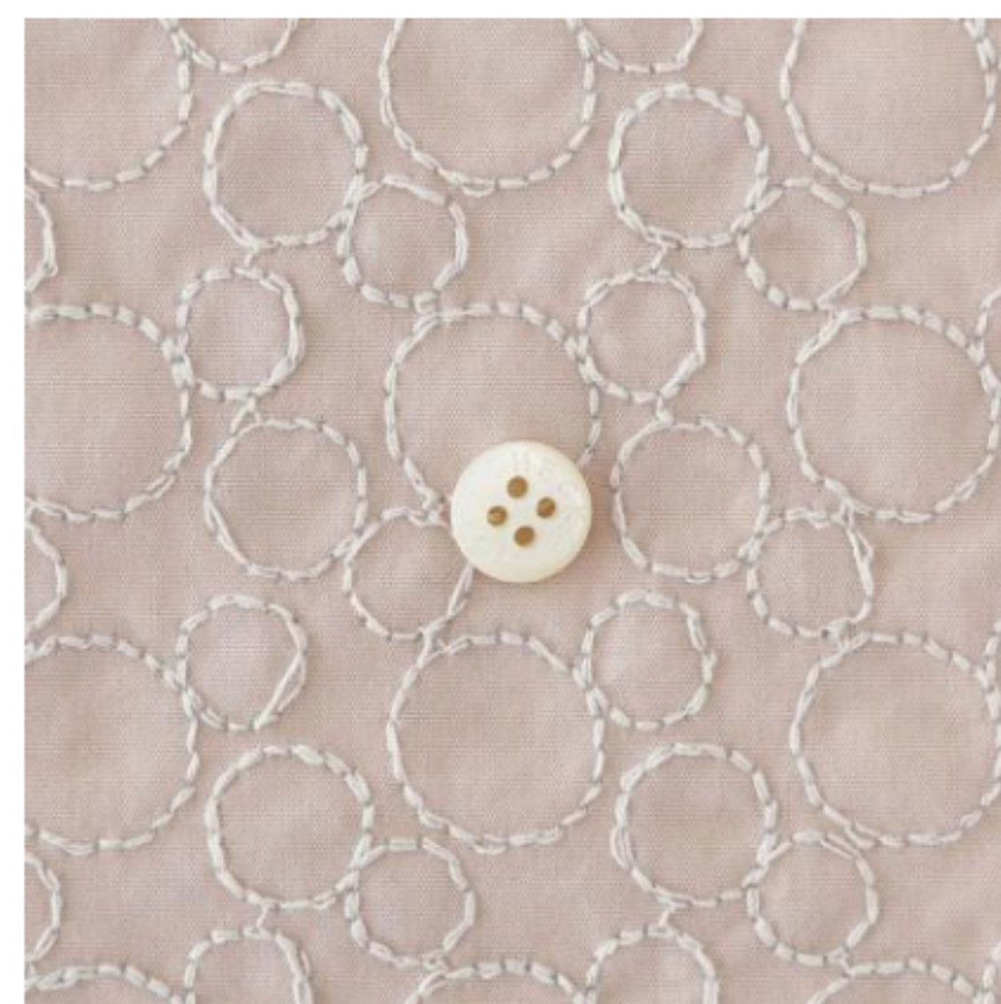
グレイッシュピンクにパールグレー