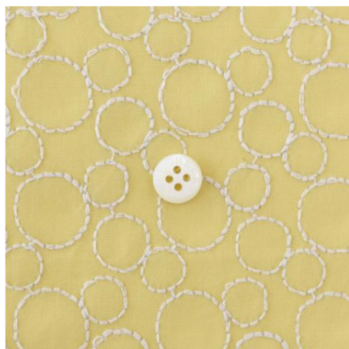
カナリーイエローにパールグレー