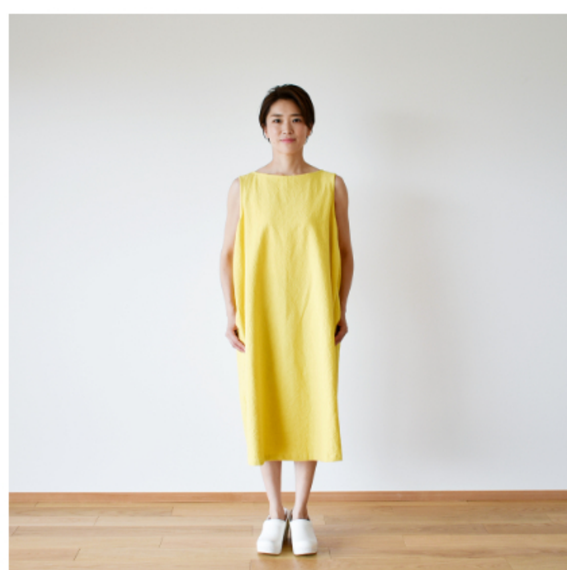
カナリーイエロー： 『CHECK&STRIPE SEW HAPPY』(世界文化社) サイドタックのボートネックのワンピース