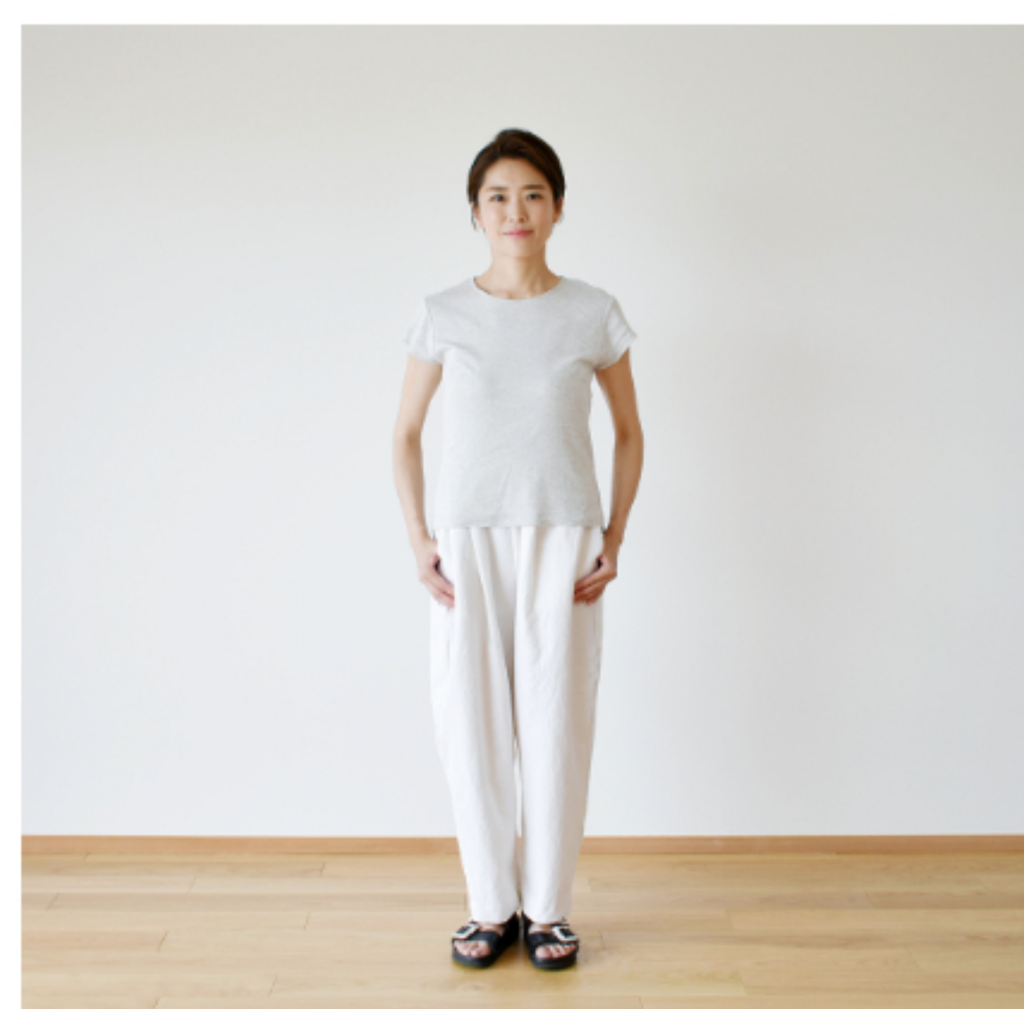
オフホワイト： 『CHECK&STRIPE my favorite 私の好きな服』(主婦と生活社) テーパードタックパンツ