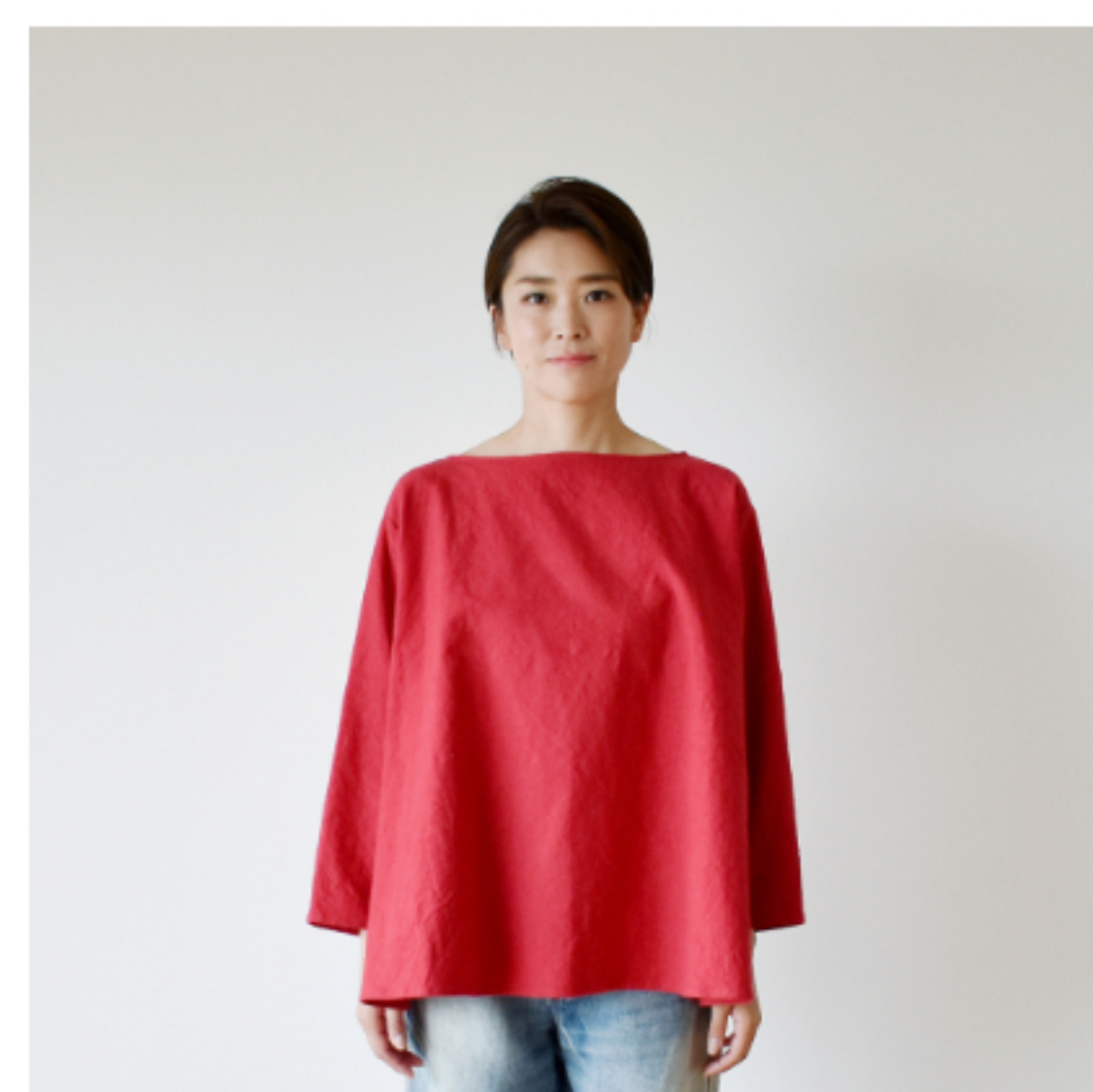
赤：『CHECK&STRIPEのおとな服 ソーイング・レメディール』(文化出版局) ペタルブラウス