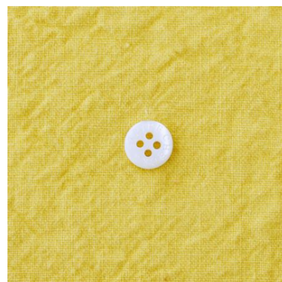
カナリーイエロー