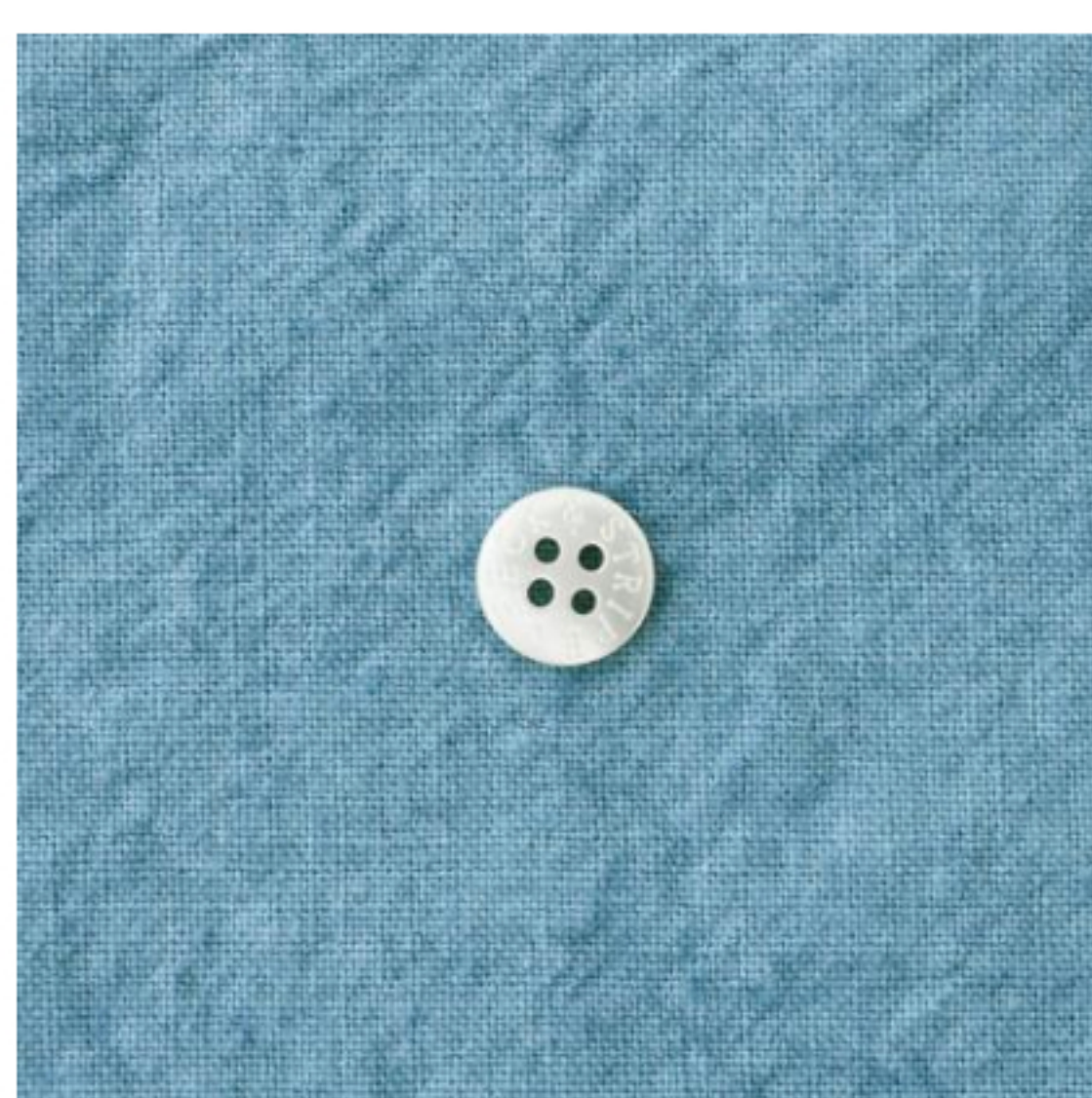
フォーゲットミーノット