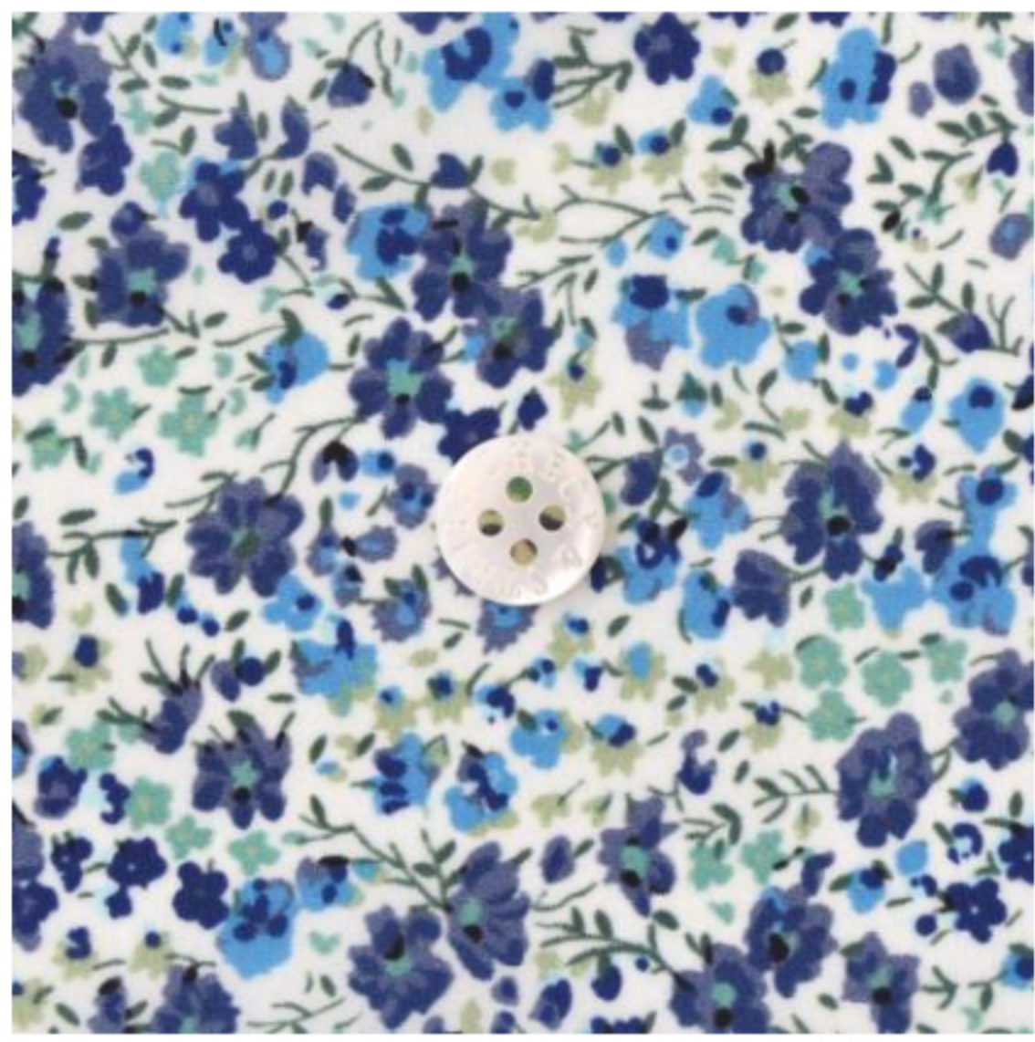
DN(ネイビー・ブルー系)