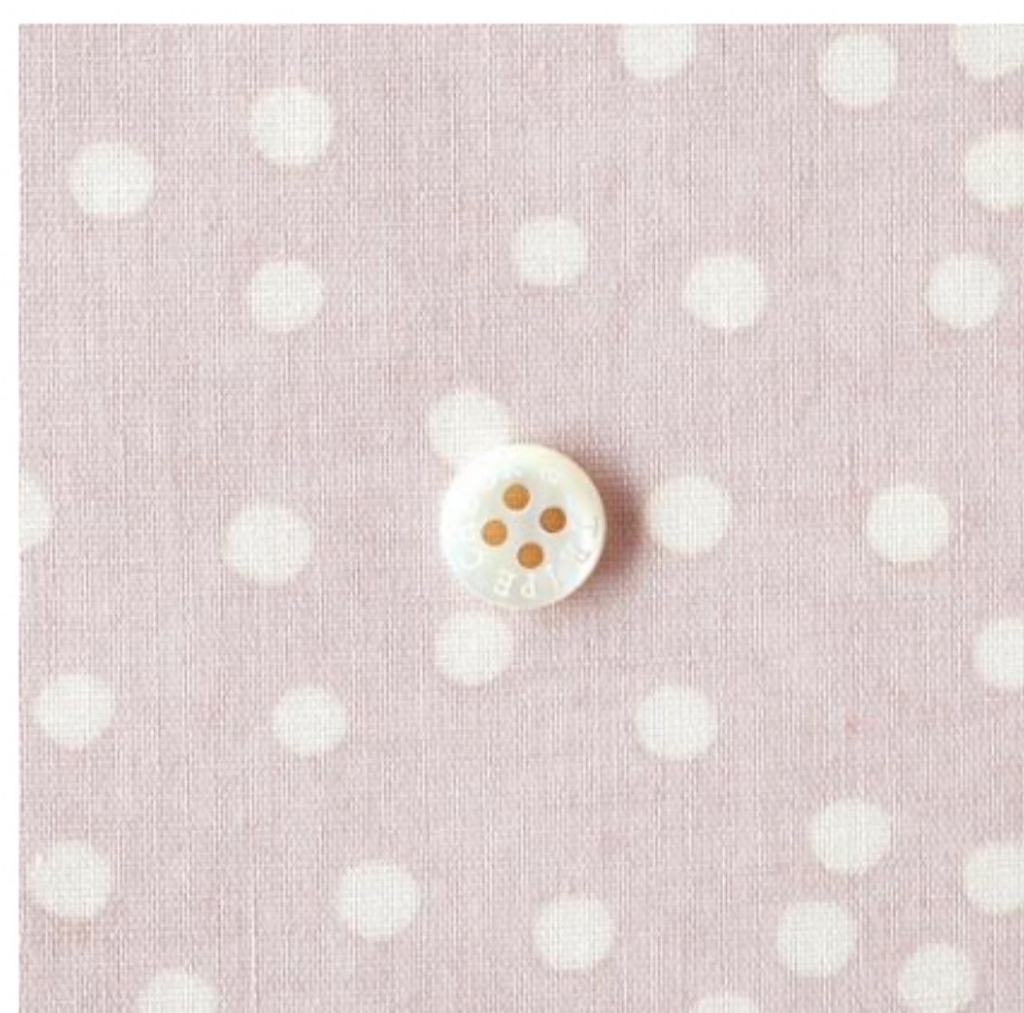
グレイッシュピンク