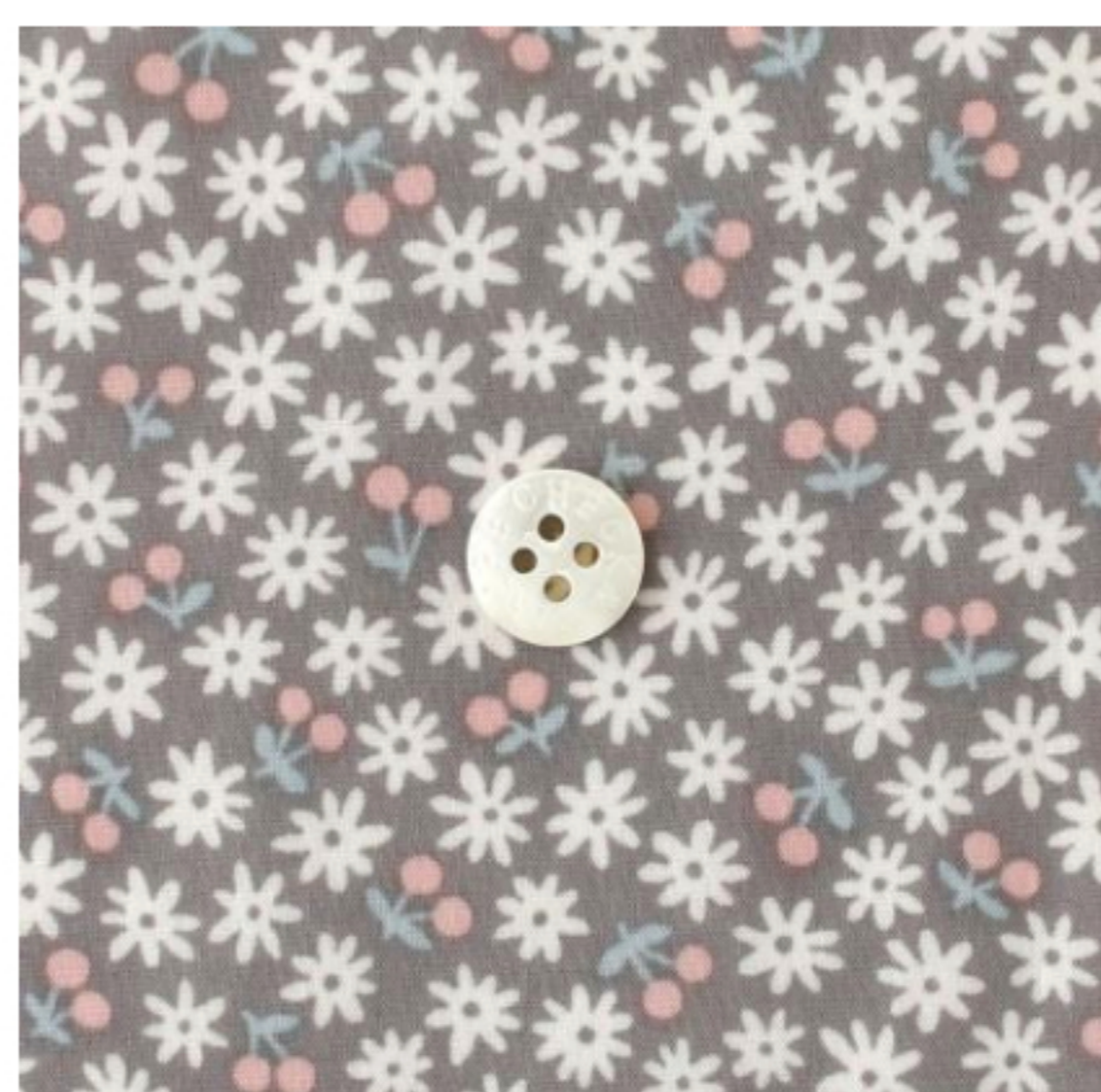
あずきミルク地にマッシュルームとピンク