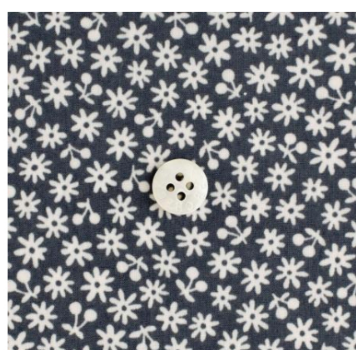
ダークグレー地にマッシュルーム