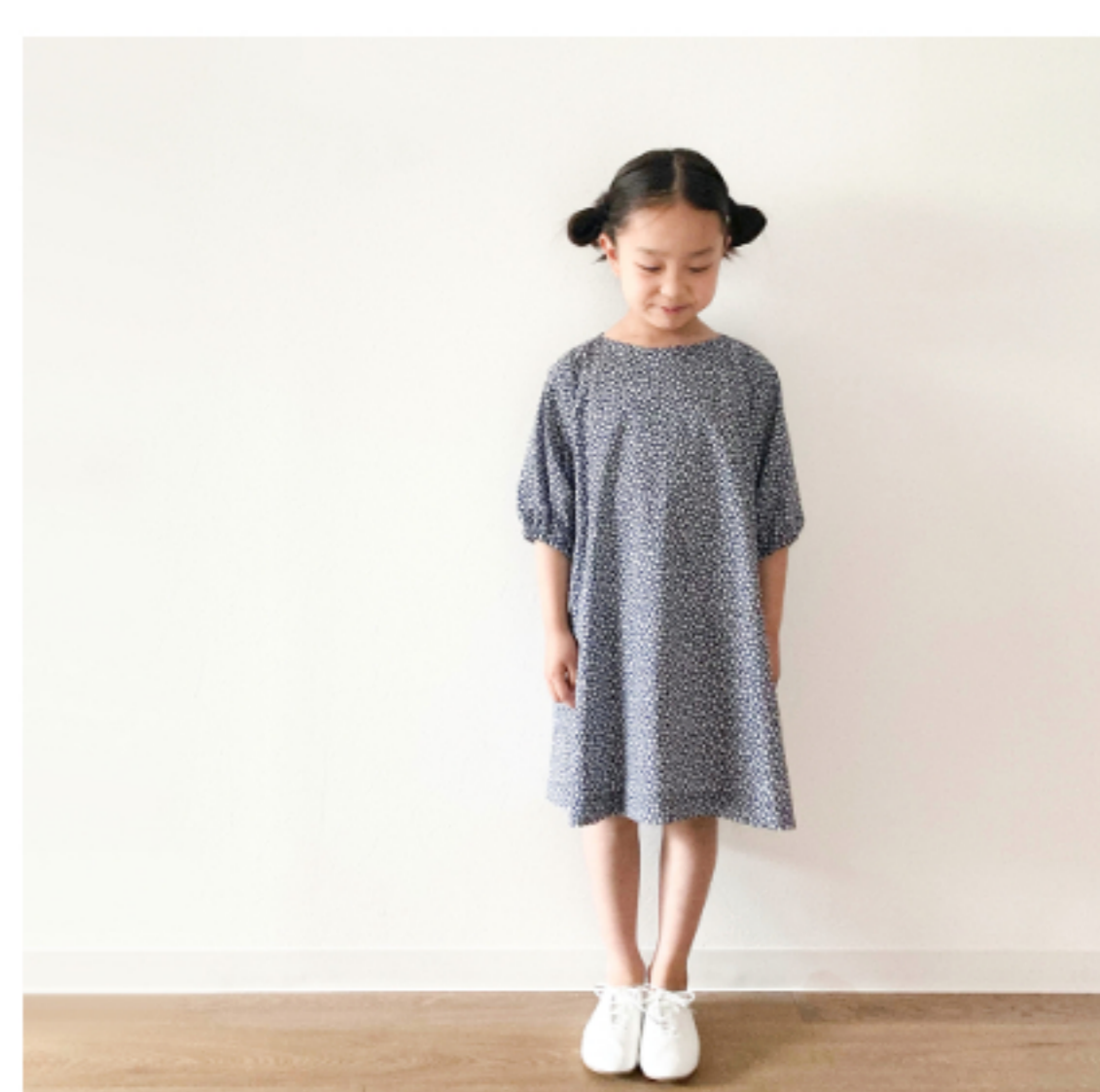
ネイビー地にマッシュルームとピンク:『CHECK&STRIPEの子ども服 ソーイング・ナーサリー』(文化出版局) パルーンスリーブのワンピース