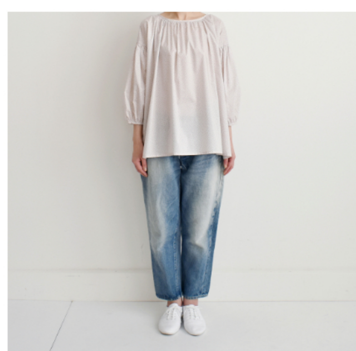
グレイッシュピンク地にマッシュルーム:『CHECK&STRIPEのおとな服 ソーイング・レメディ―』(文化出版局) スタンダードギャザーブラウス