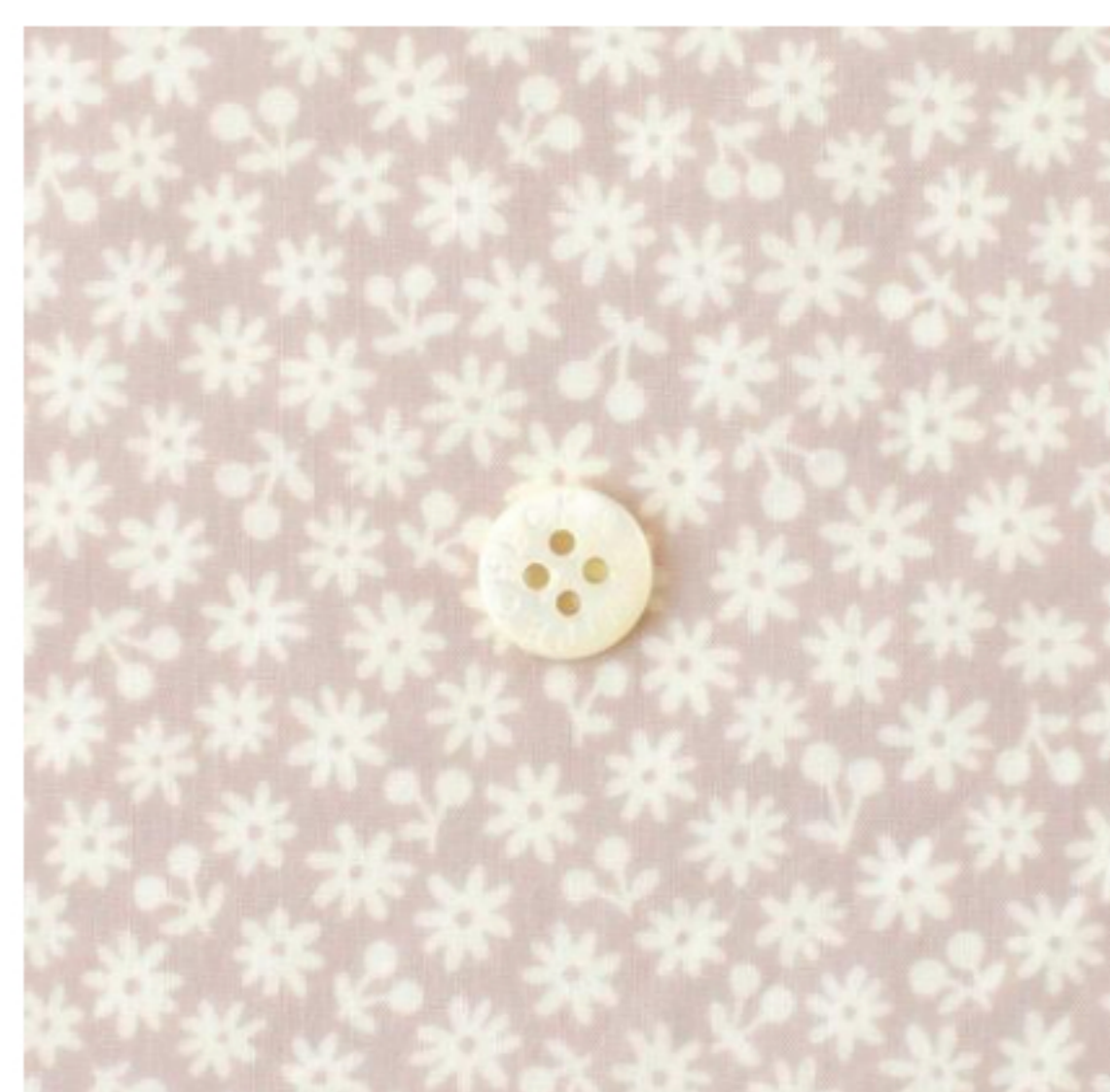
グレイッシュピンク地にマッシュルーム