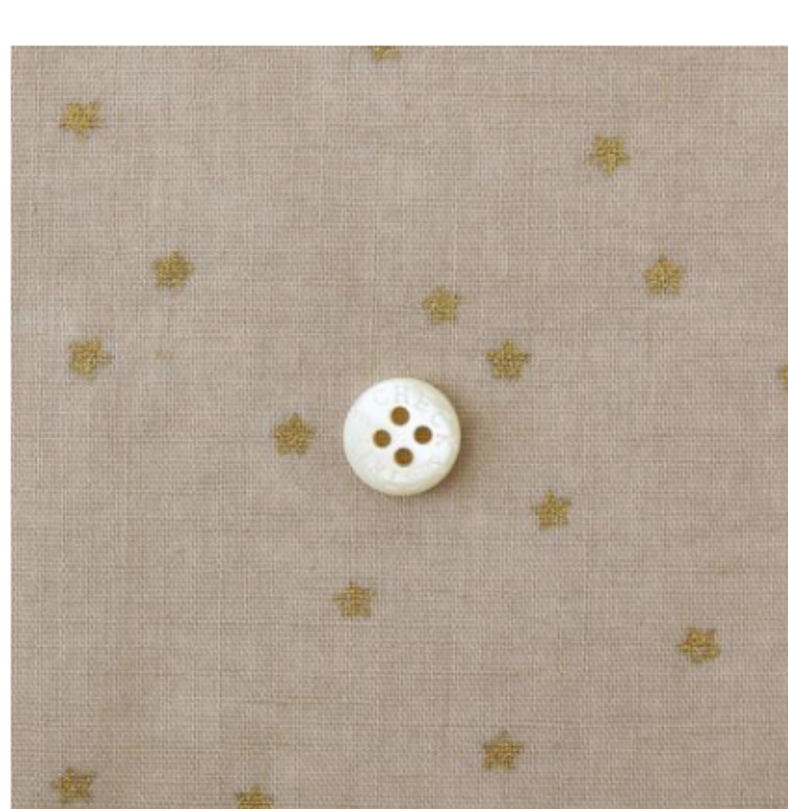
ソイラテにゴールド