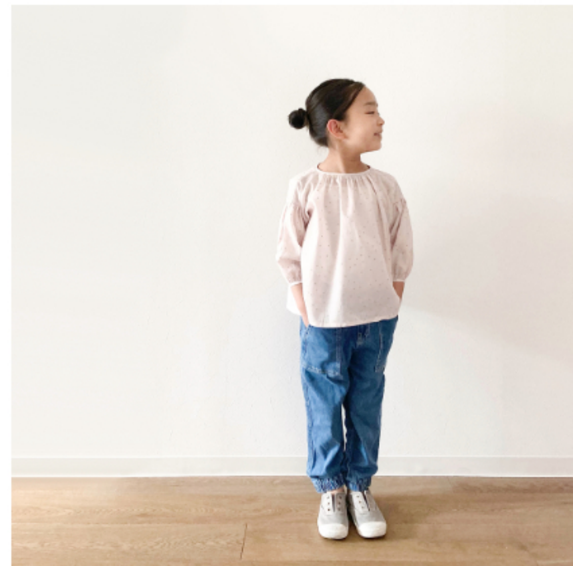
グレイッシュピンクにシルバー: 『CHECK&STRIPEの子ども服 ソーイング・ナーサリー』(文化 出版局) スタンダードギャザー ブラウス