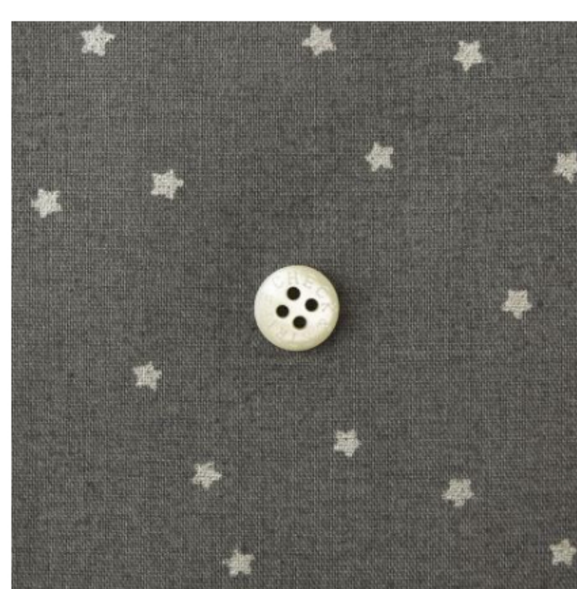
ラベンデュールにシルバー