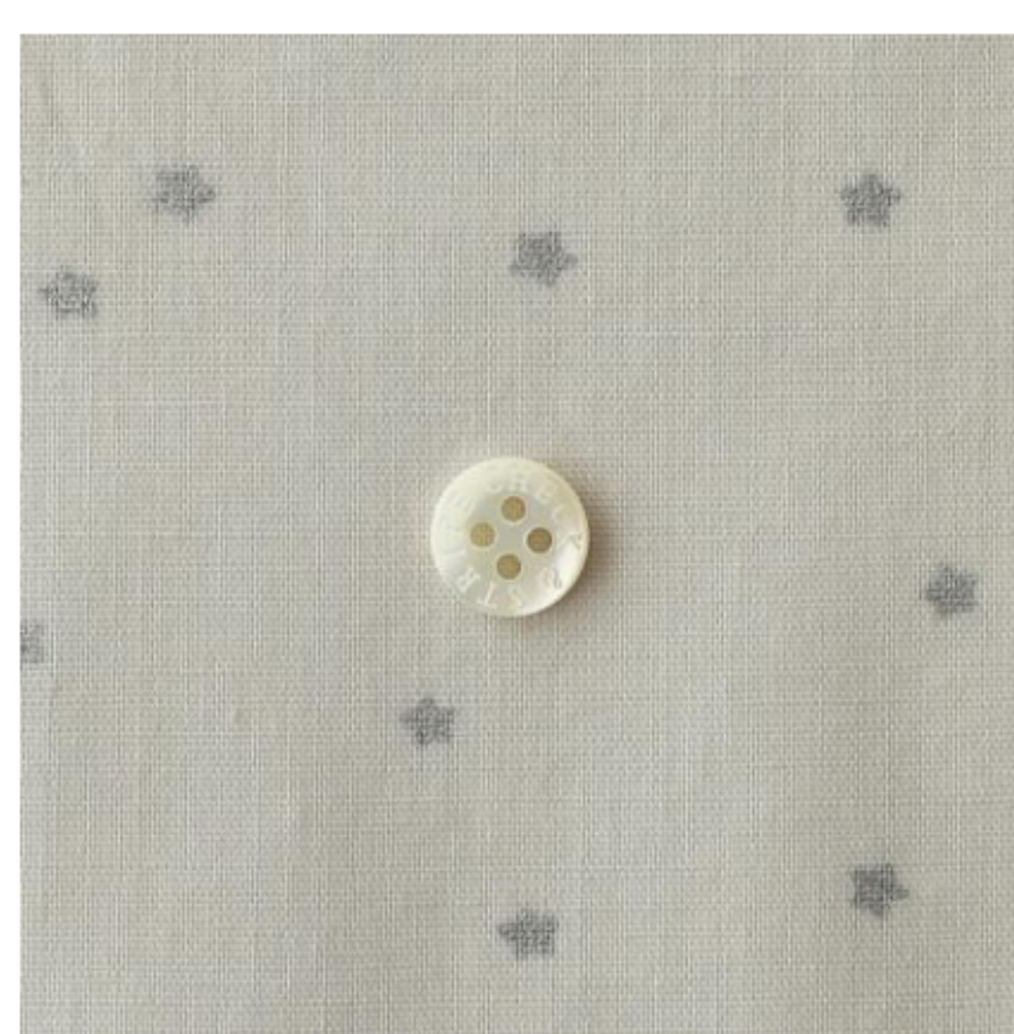
ミスティグレーにシルバー