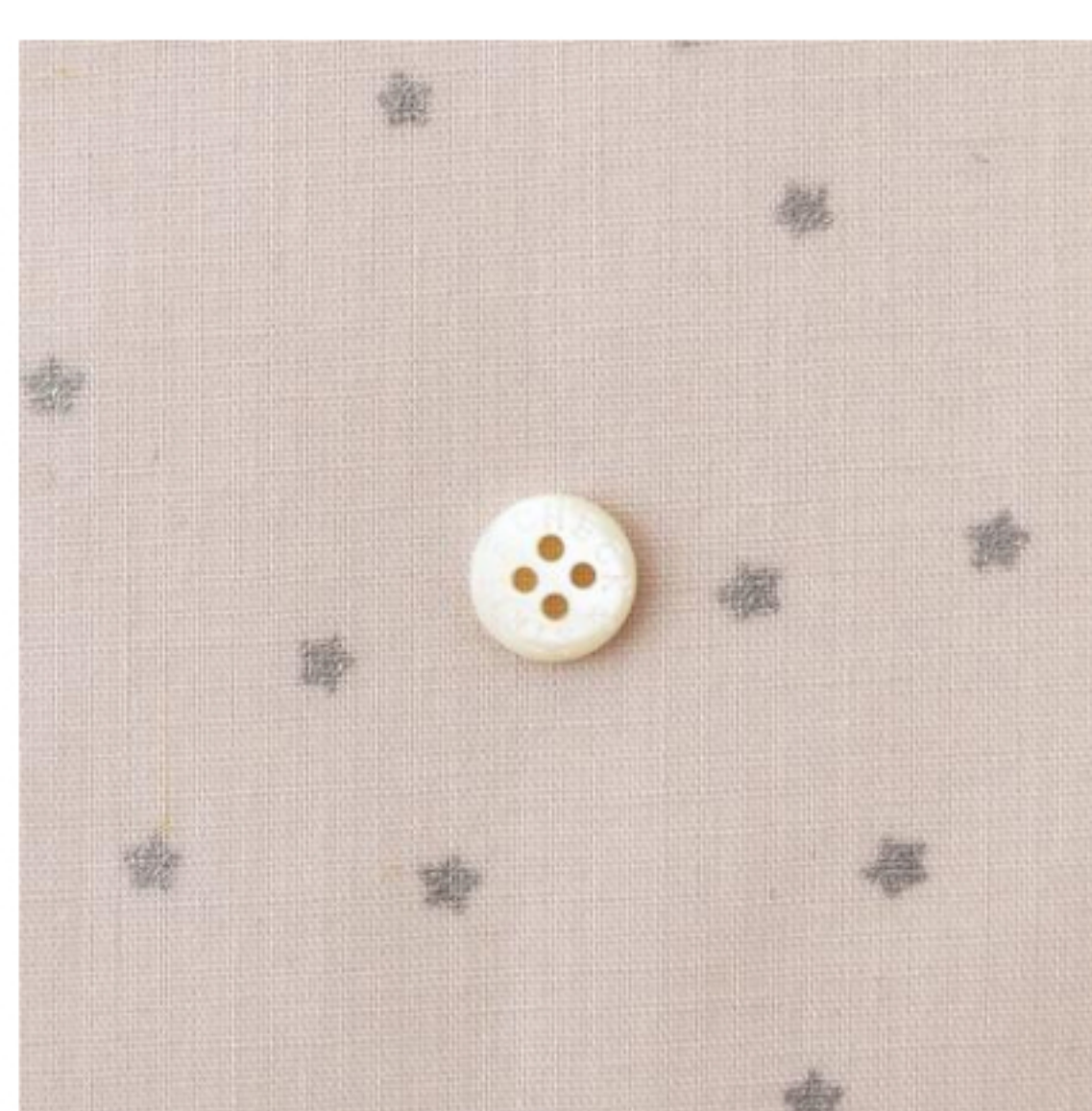
グレイッシュピンクにシルバー