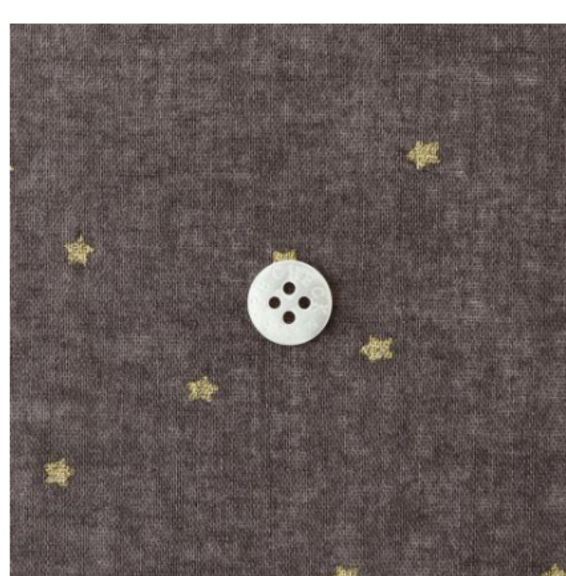
グレイッシュブラウンにゴールド