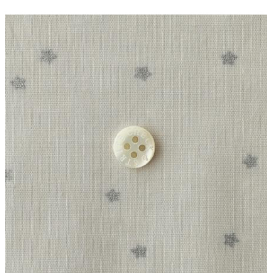
ミスティグレーにシルバー