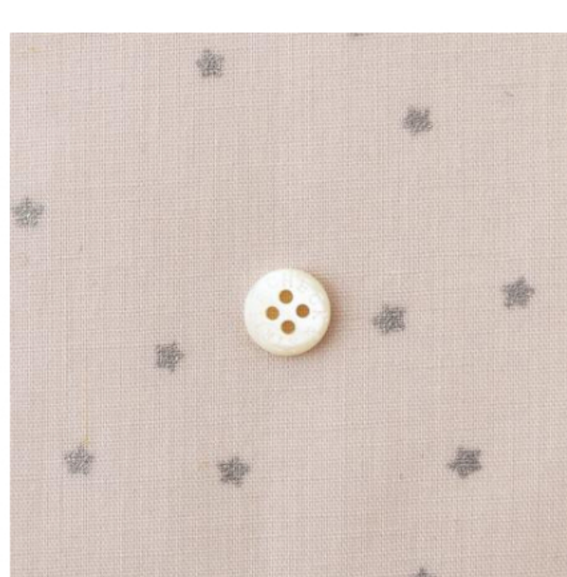
グレイッシュピンクにシルバー