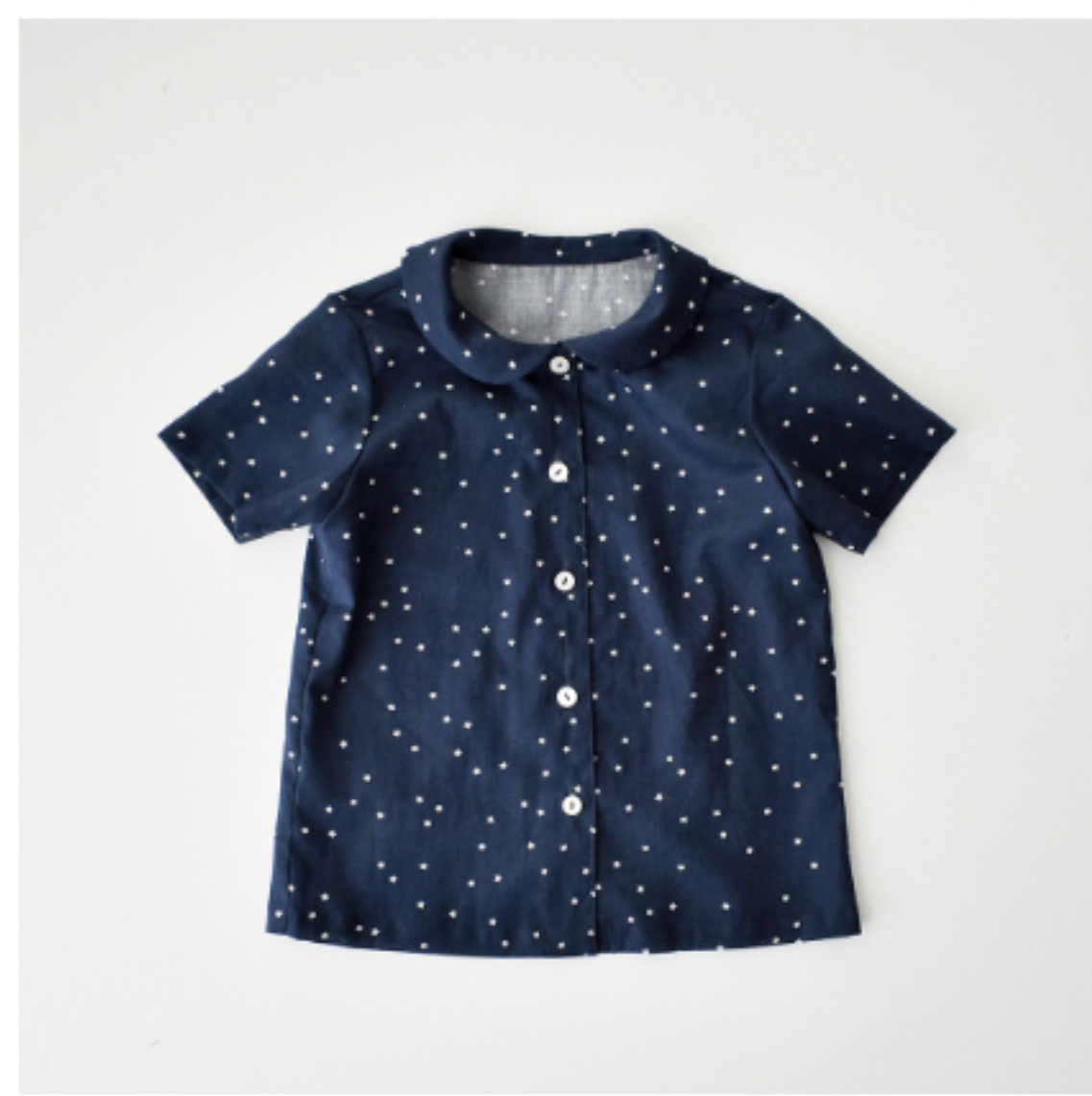
ネイビーに白:パターン 169(ブラウス)