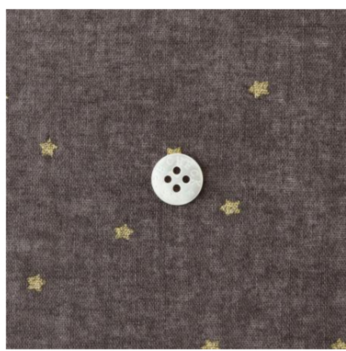
グレイッシュブラウンにゴールド