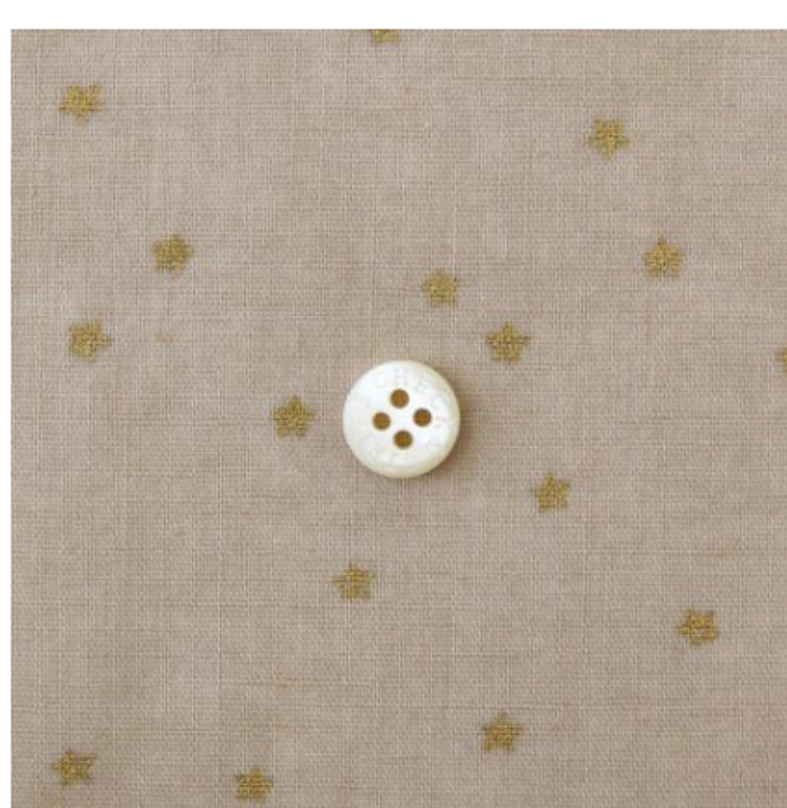
ソイラテにゴールド