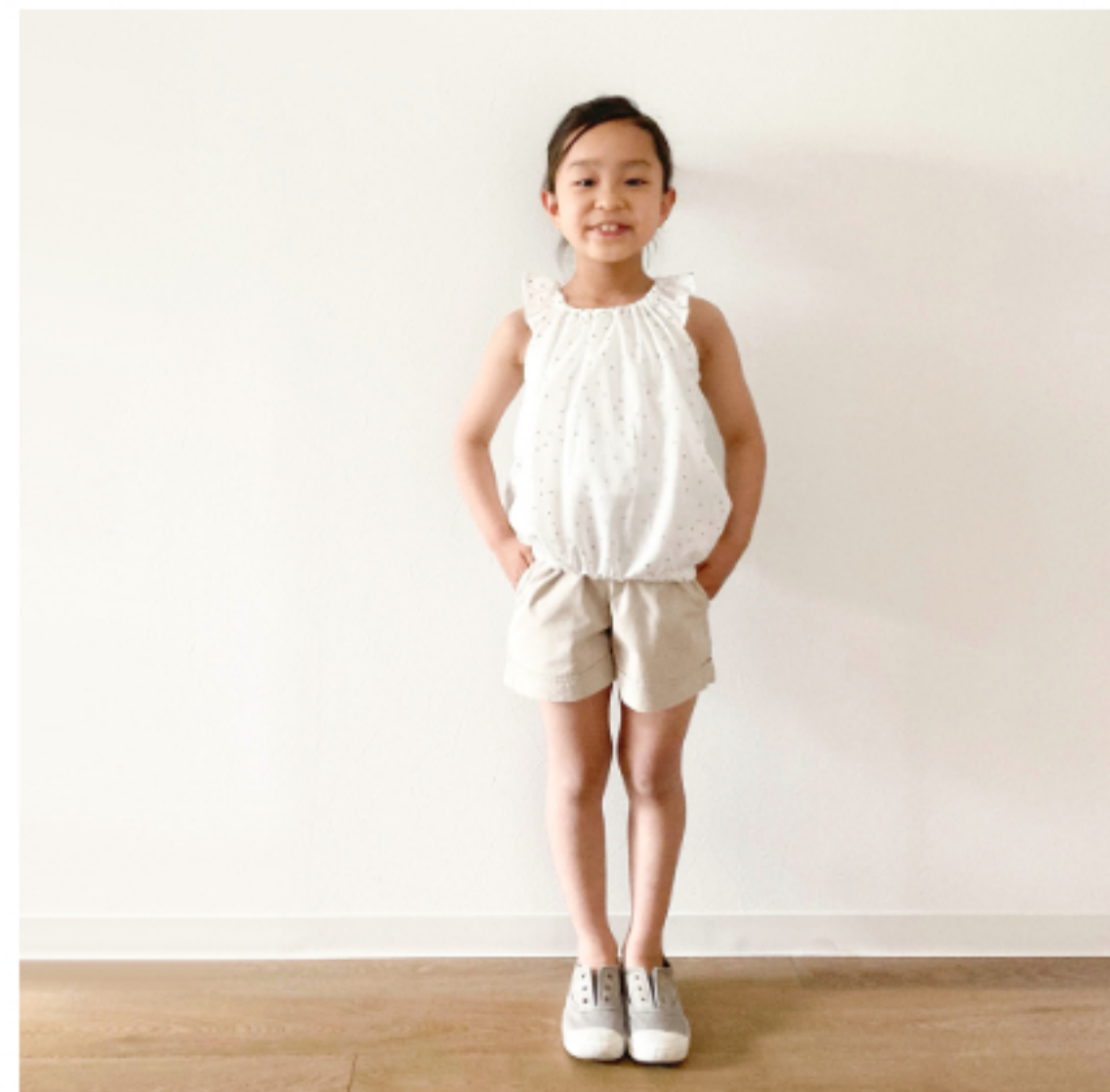
白にシルバー: 『CHECK&STRIPE SEW HAPPY』(世界文化社) 天使の ブラウス・子ども