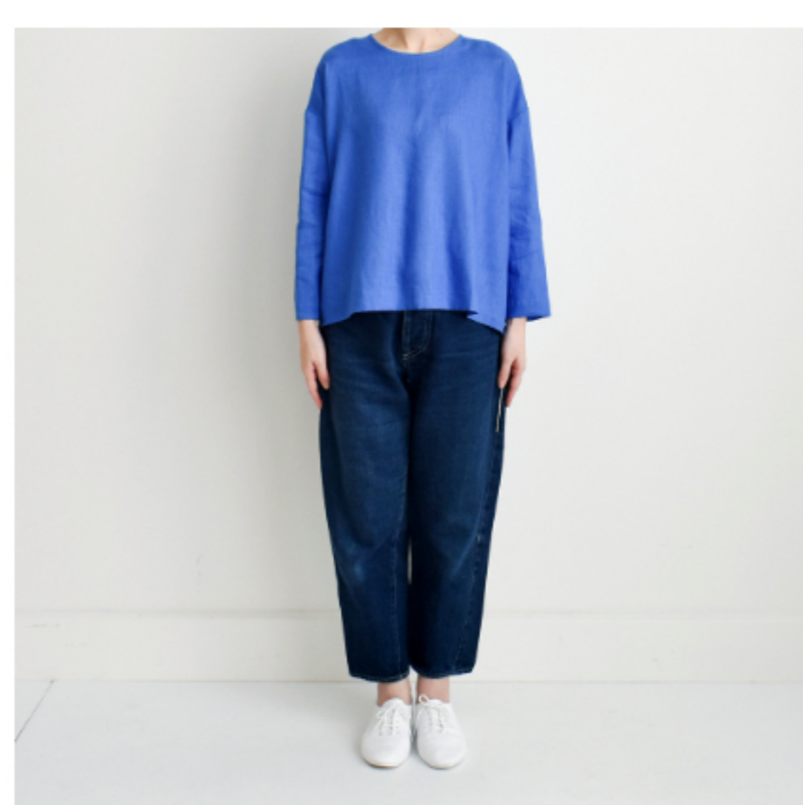
マリンプルー:『CHECK&STRIPE my favorite 私の好きな服』(主婦と生活社) 後ろボタンのプルオーバー