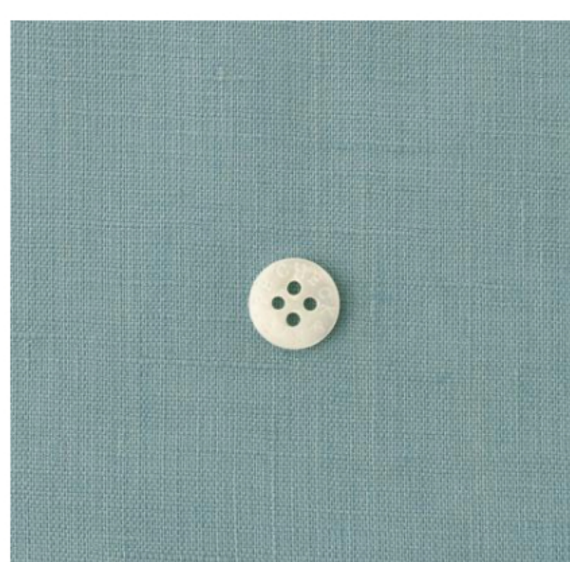
スモークブルーグレー(新色)