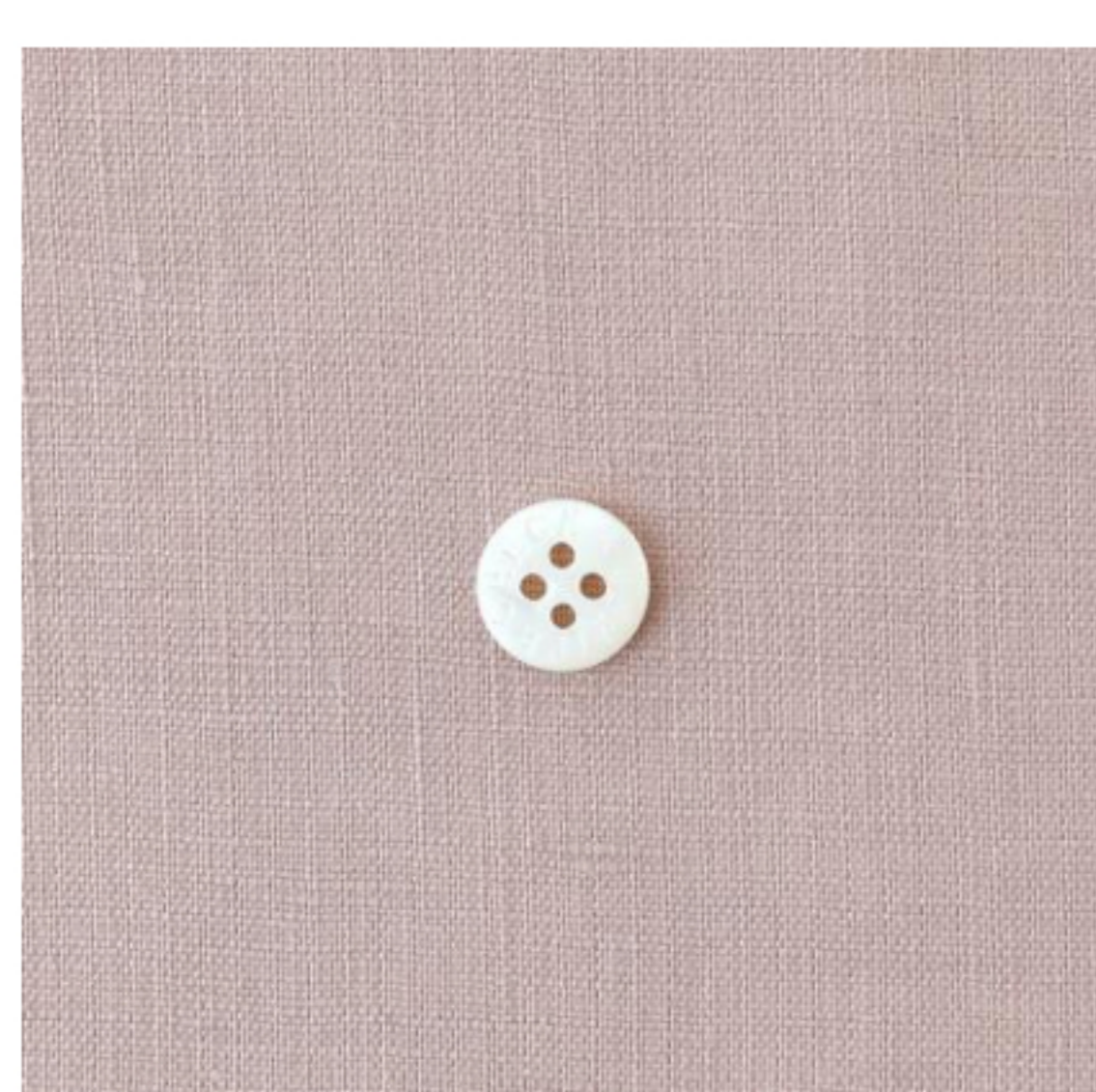
グレイッシュピンク