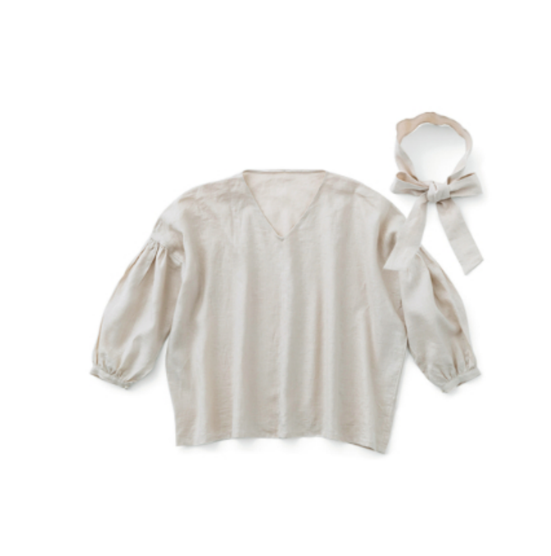
マッシュルーム:CHECK&STRIPEのおとな服ソーイング・レメディィー』(文化出版局) Vネックプルオーバー