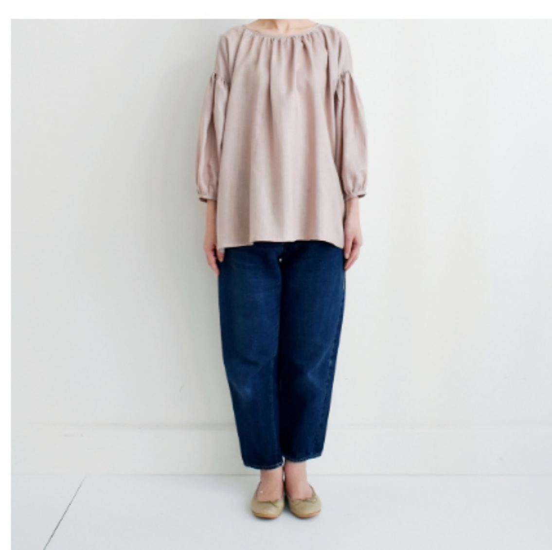
グレイッシュピンク:『CHECK&STRIPEのおとな服ソーイング・レメディィー』(文化出版局) スタンダードギャザーブラウス