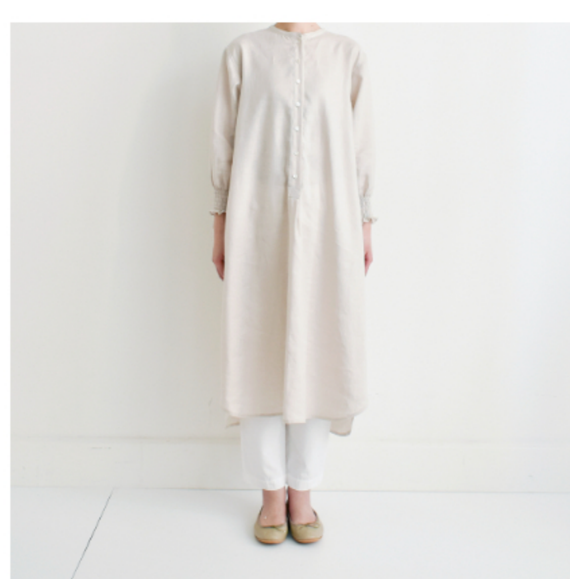
マッシュルーム:パターン176(スタンドカラーのワンピース)