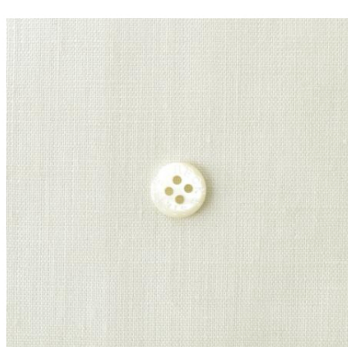
アンティークホワイト