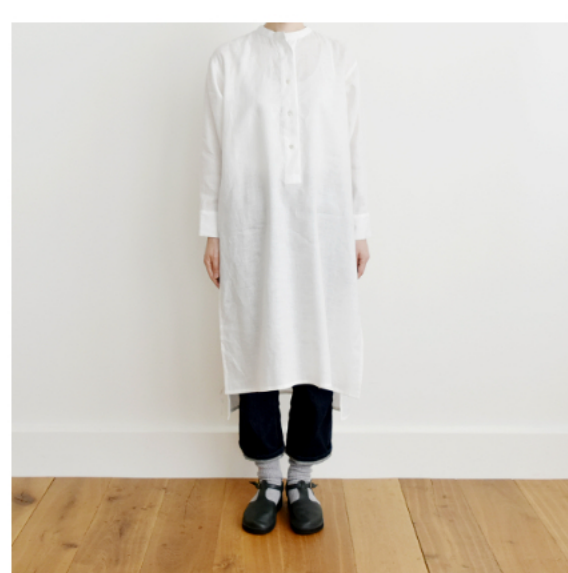
ホワイト:『CHECK&STRIPE SEW HAPPY』(世界文化社)ヘンリーネックのシャツワンピース