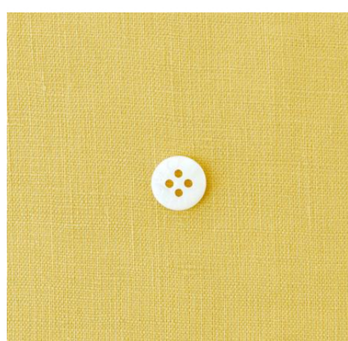
カナリーイエロー(新色)