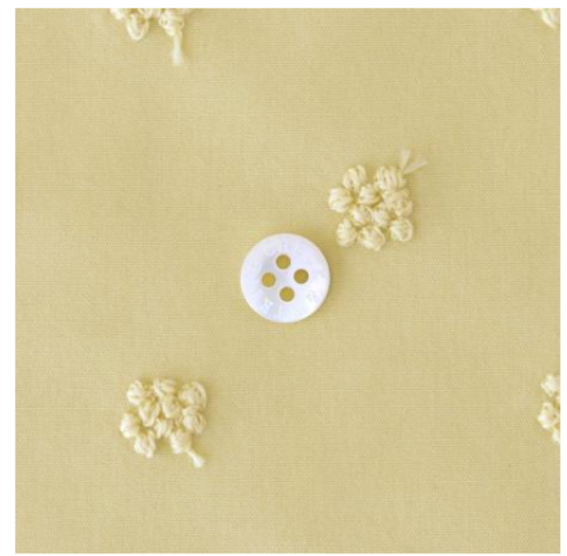
カナリーイエローにコーン