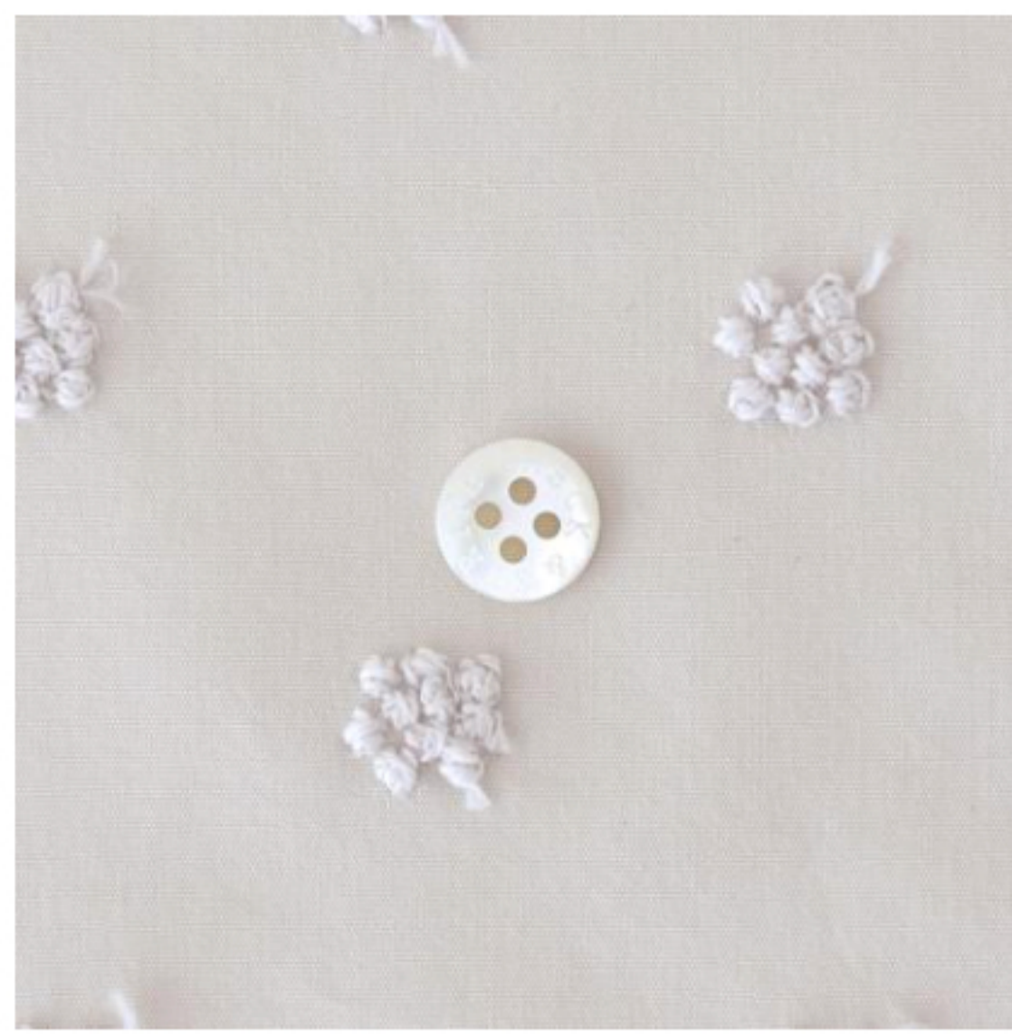
マッシュルームにパールグレー