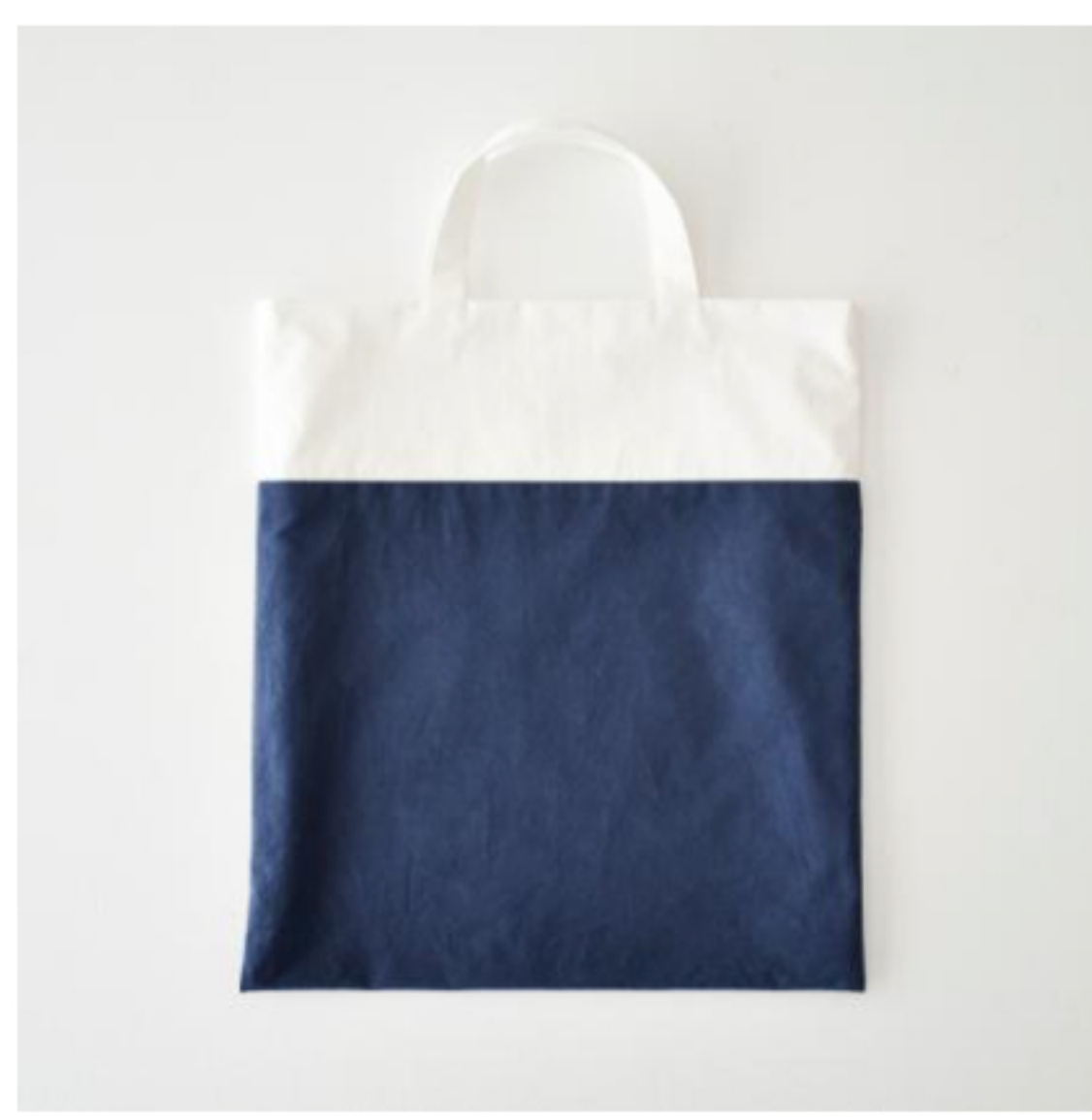
オフホワイト×ブルー