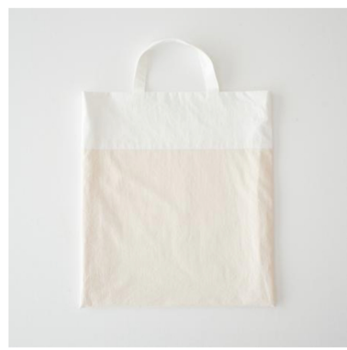
オフホワイト×きなり