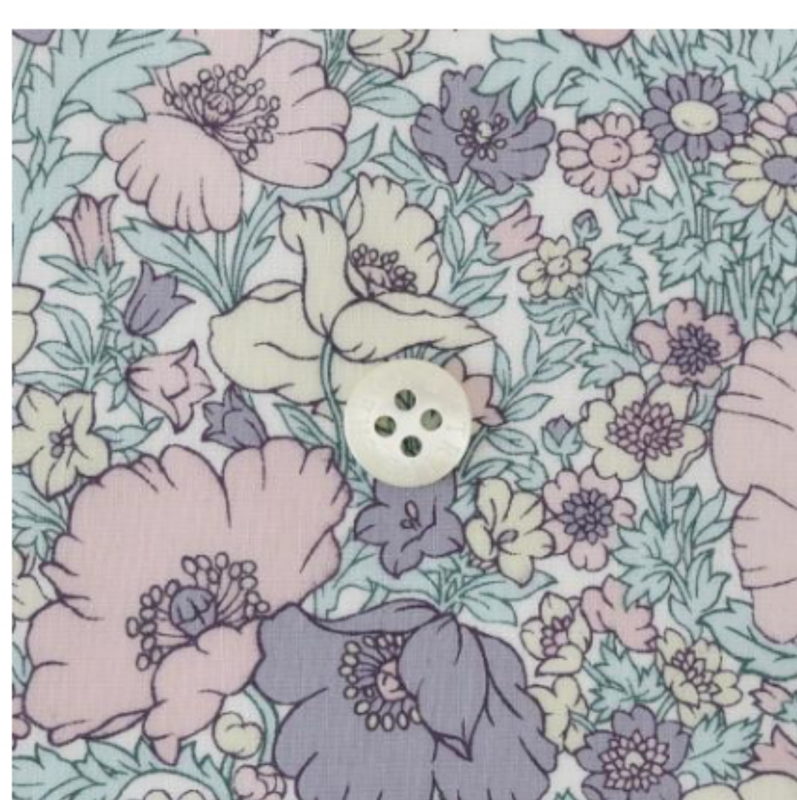
◎J23D(ラベンダー・ピンク系)(新色)