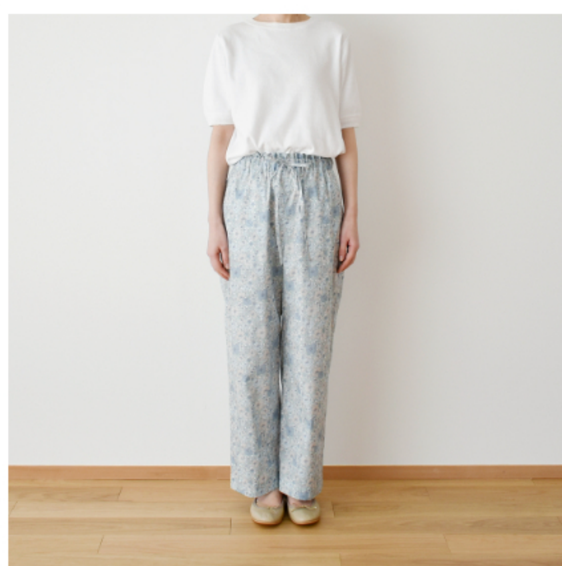
◎J23E(ブルー系)：『CHECK&STRIPEのおとな服ソーイング・レメディー』(文化出版局) フローラルパンツ