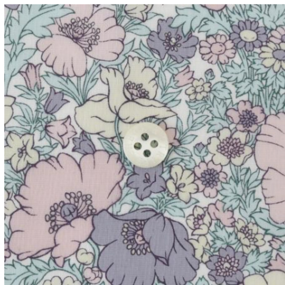
◎J23D(ラベンダー・ピンク系)(新色)