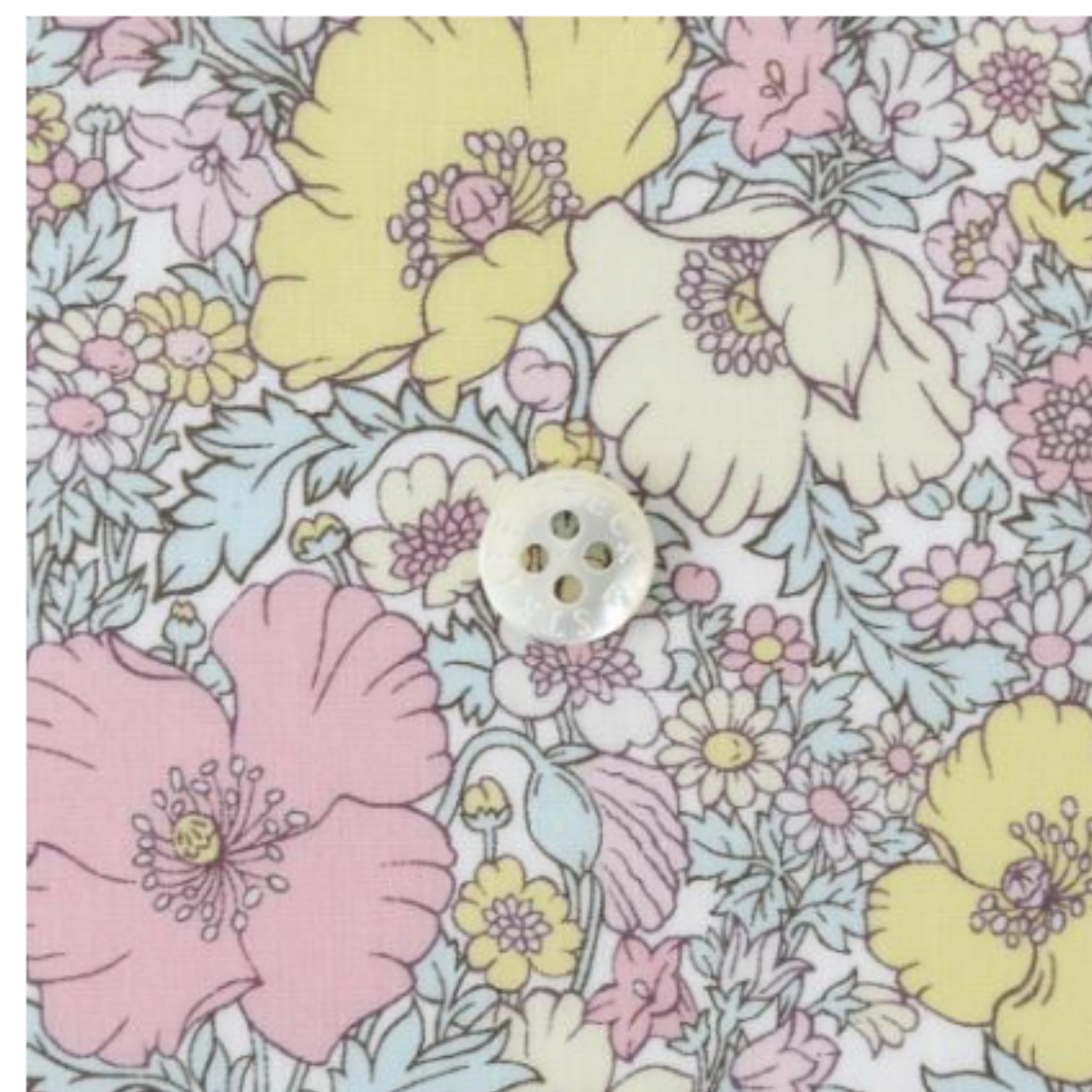
◎J23F(ピンク・イエロー系)(新色)