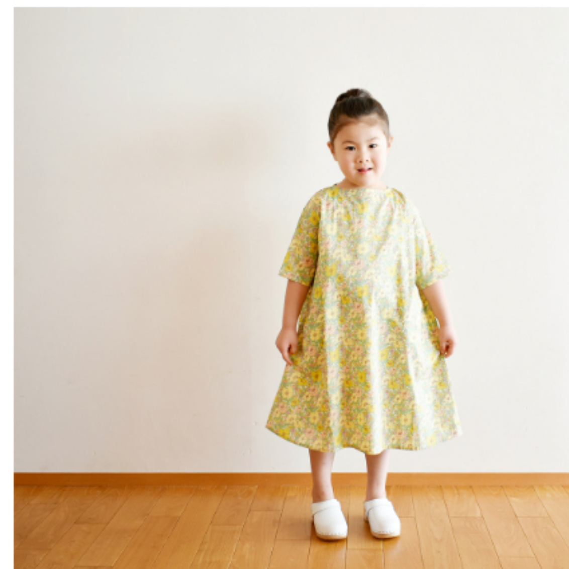
22BT(イエロー系)：『CHECK&STRIPE Sewing Diary in Paris パリのソーイングダイアリー』(世界文化社) ポートネックのワンピース 5分袖 子ども 用尺:100 1.5m/110 1.6m/120 1.7m/130 1.8m/140 1.9m