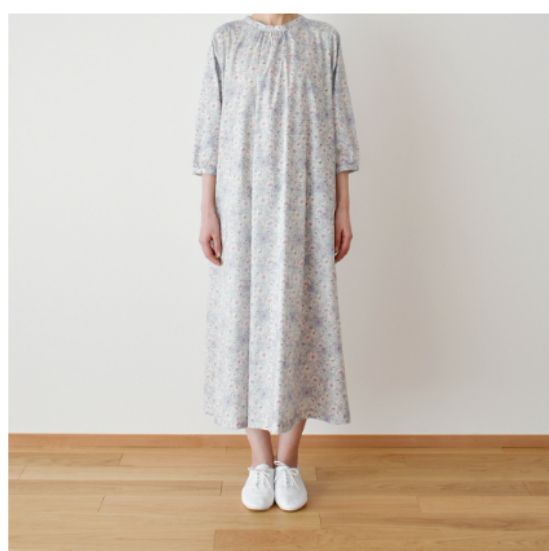
◎J23D(ラベンダー・ピンク系)：『CHECK&STRIPE Sewing Diary in Paris パリのソーイングダイアリー』(世界文化社) 小さな立ち衿のワンピース