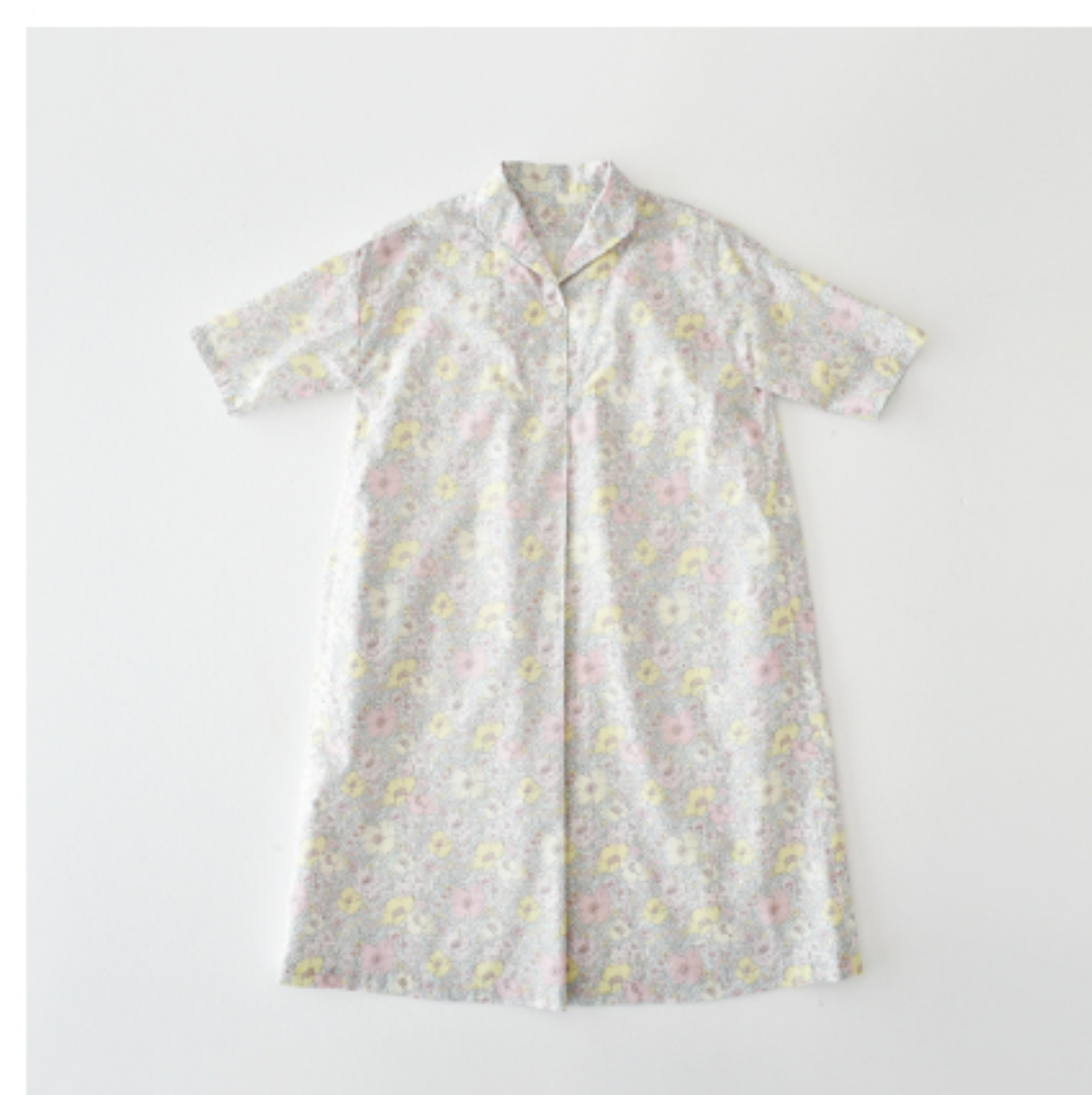
◎J23F(ピンク・イエロー系)：『CHECK&STRIPE Sewing Diary in Paris パリのソーイングダイアリー』(世界文化社) ウィークエンドのワンピース 子ども