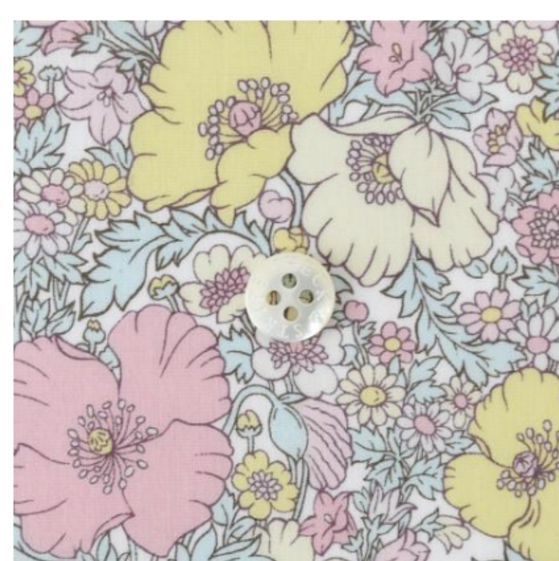
◎J23F(ピンク・イエロー系)(新色)