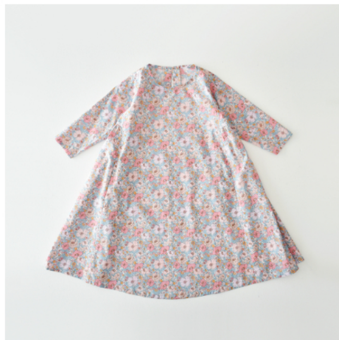
22AT(ピンク系)：『CHECK&STRIPE Sewing Diary in Paris パリのソーイングダイアリー』(世界文化社) サイドギャザーのワンピース 子ども