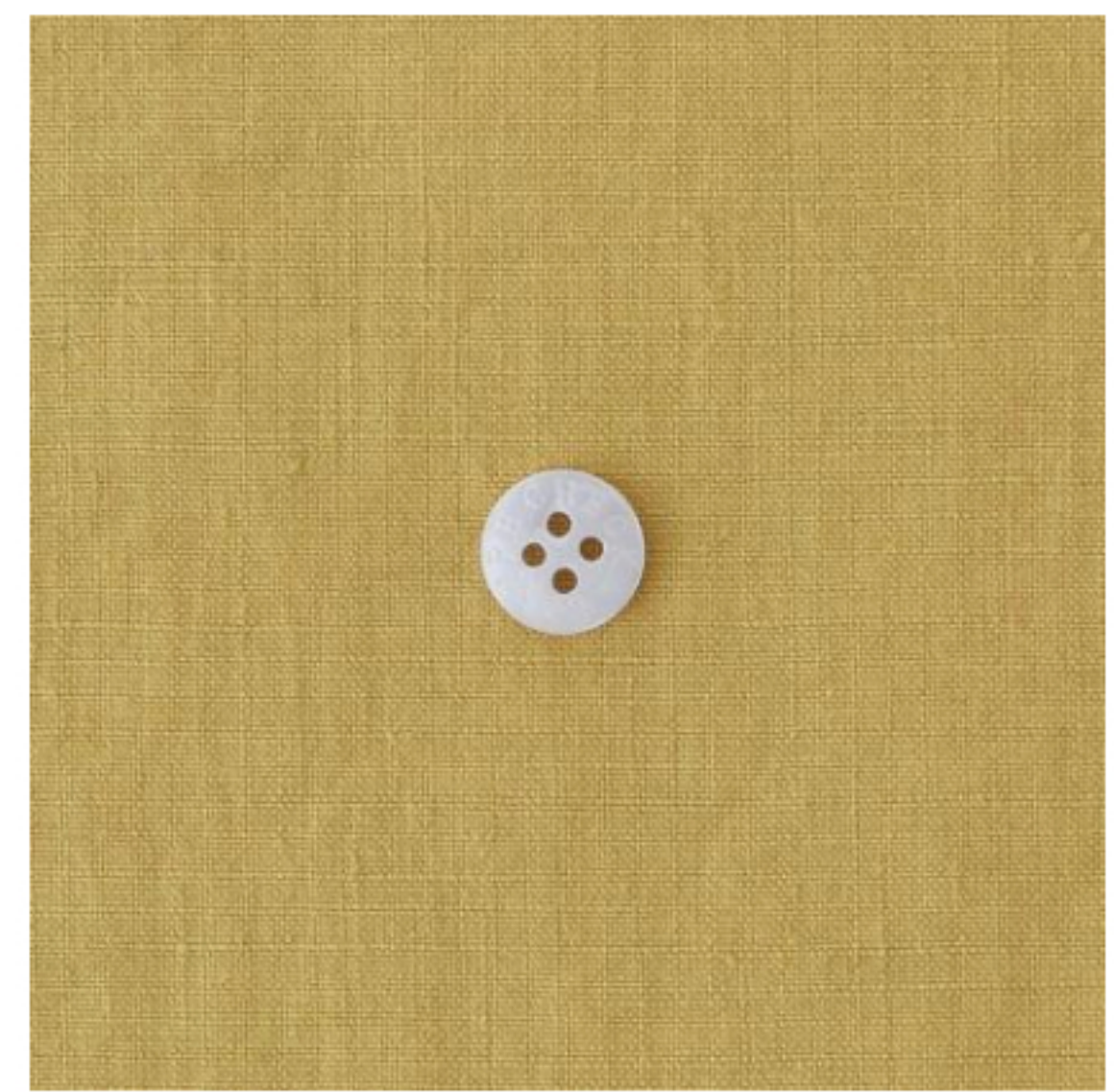
シックマスタード