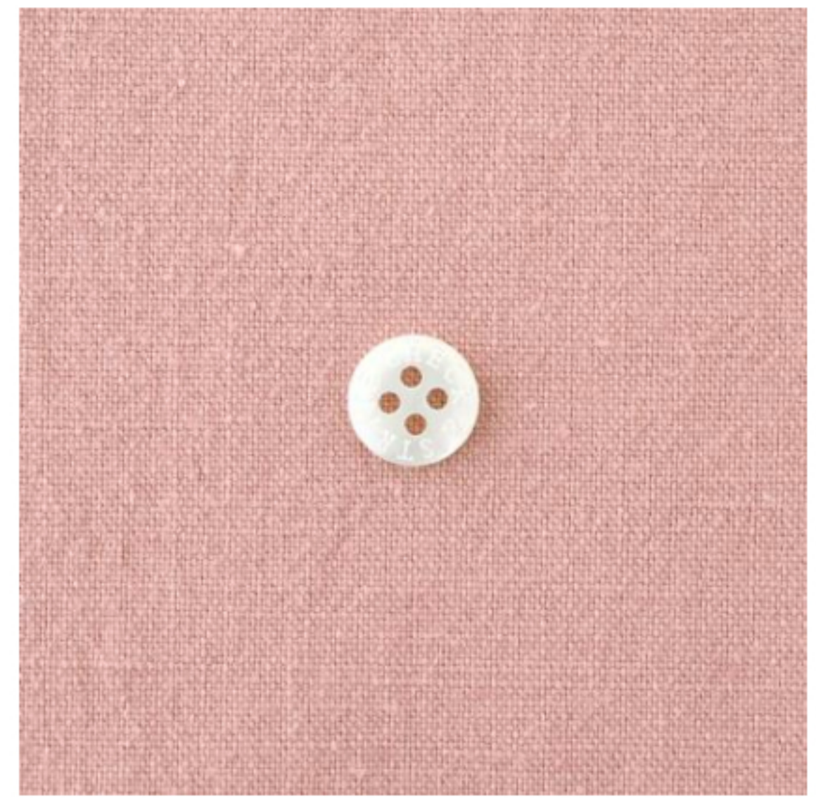
スモーキーピンク