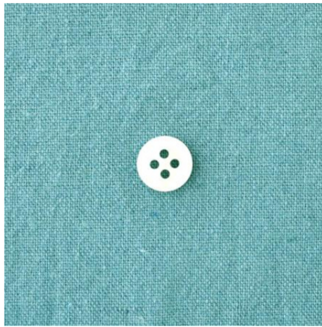
スモークライトグリーン