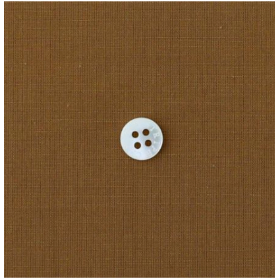
ゴールドブラウン