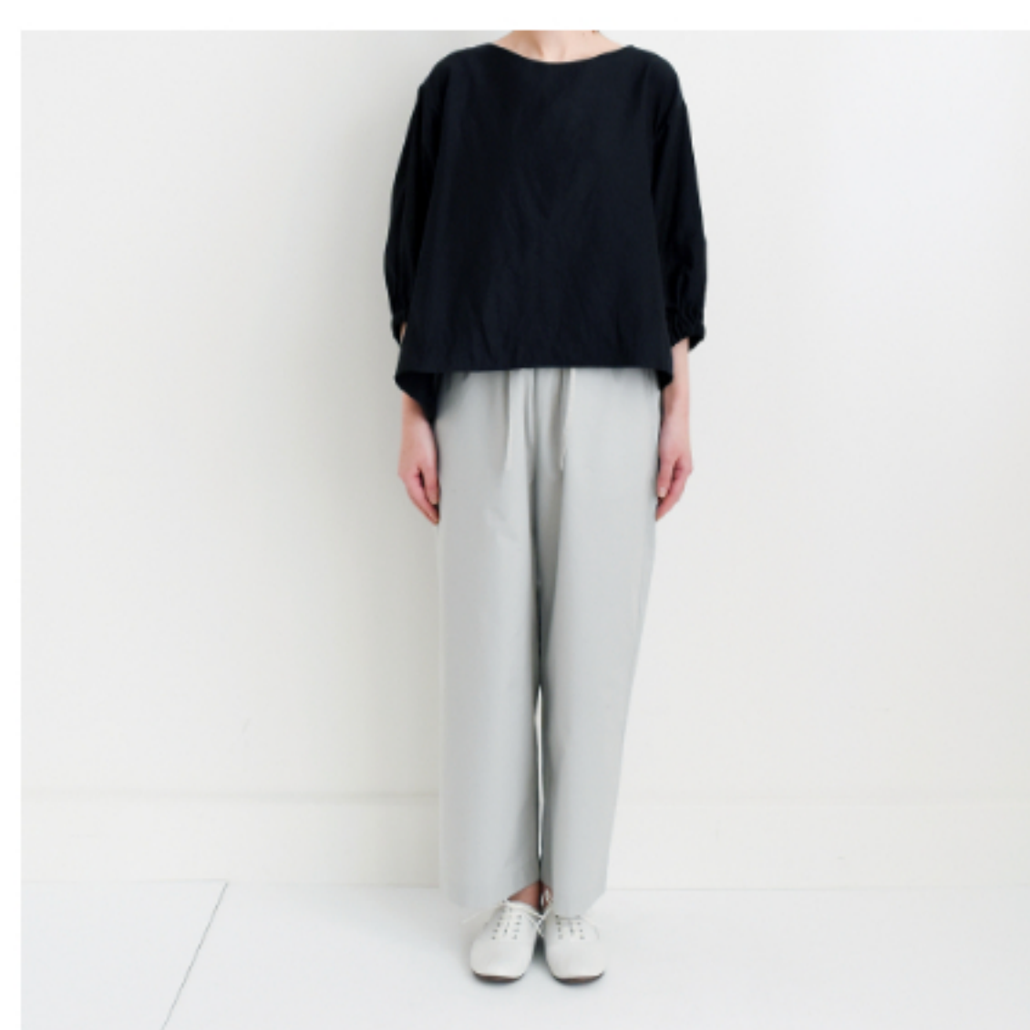
ブラック：『CHECK&STRIPEのおとな服ソーイング・レメディ』(文化出版局) パルーンスリーブのブラウス