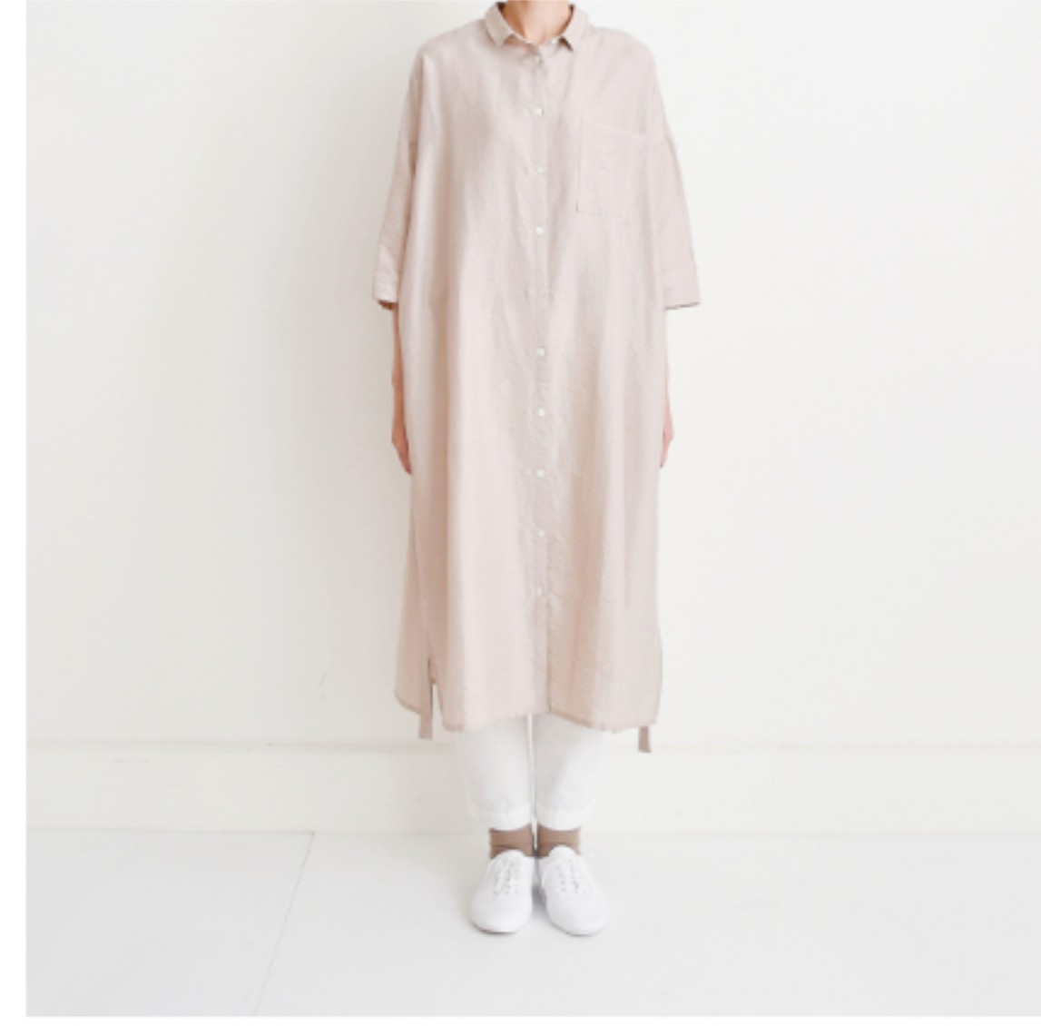
グレイッシュピンク： 『CHECK&STRIPE お気に入りをつくりで』(世界文化社) シャツワンピース