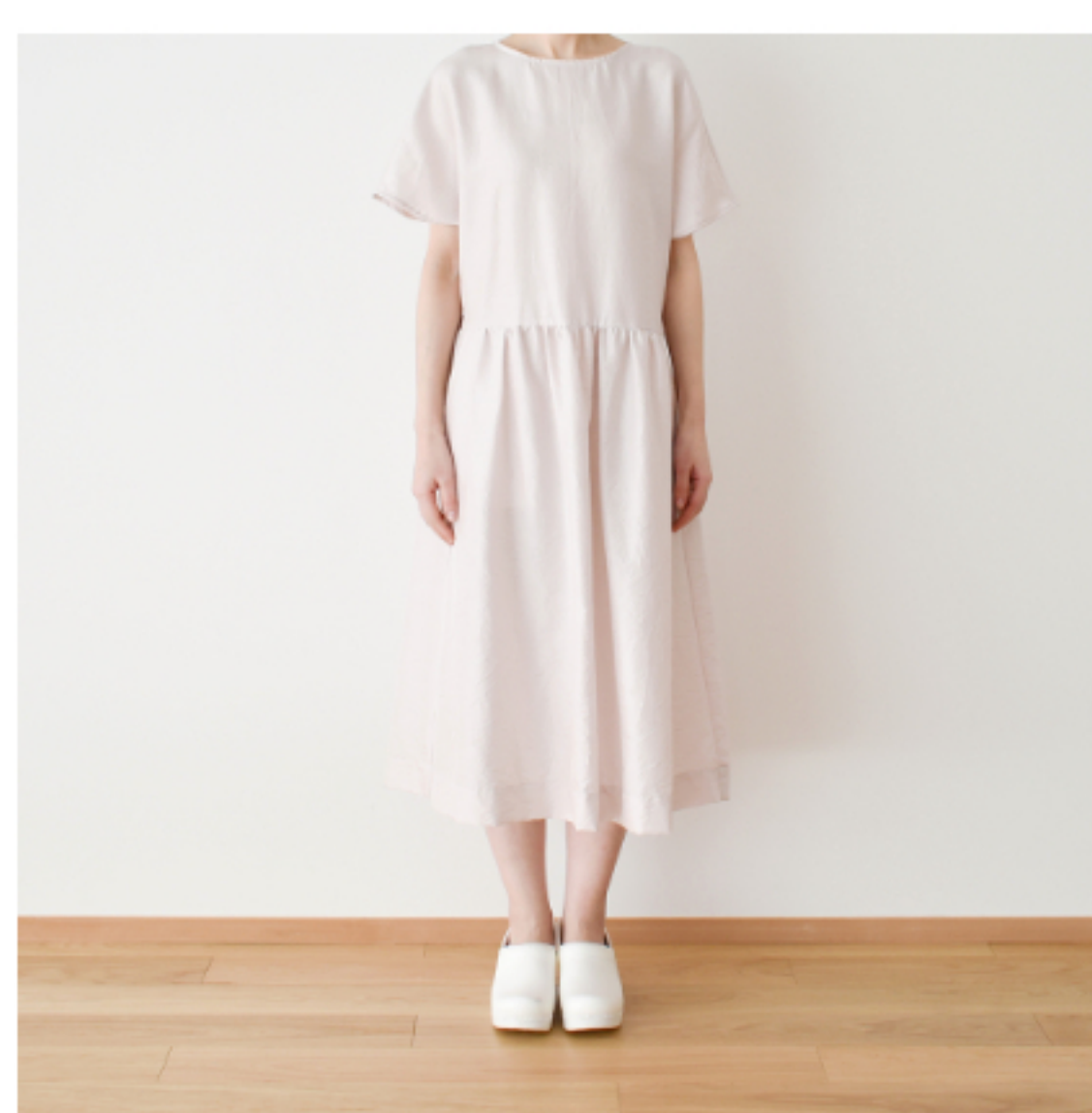
桜らピンク： 『CHECK&STRIPE Sewing Diary in Paris パリのソーイングダイアリー』(世界文化社) セーヌ川のワンピース 用尺：S 3.3m、M 3.3m、L 3.4m