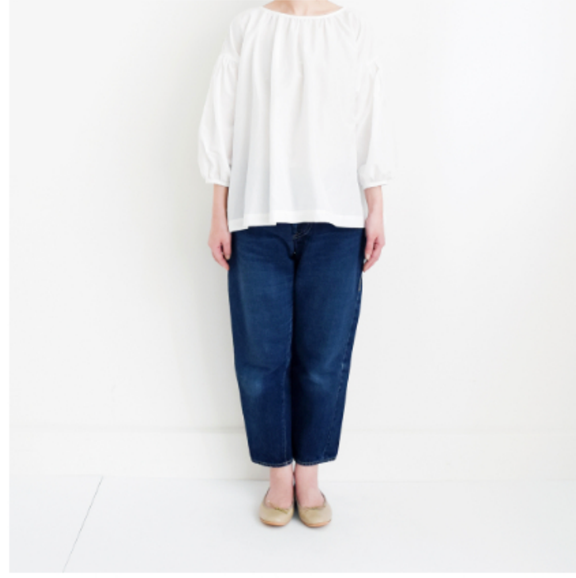
オフホワイト： 『CHECK&STRIPEのおとな服ソーイング・レメディ』(文化出版局) スタンダードギャザーブラウス