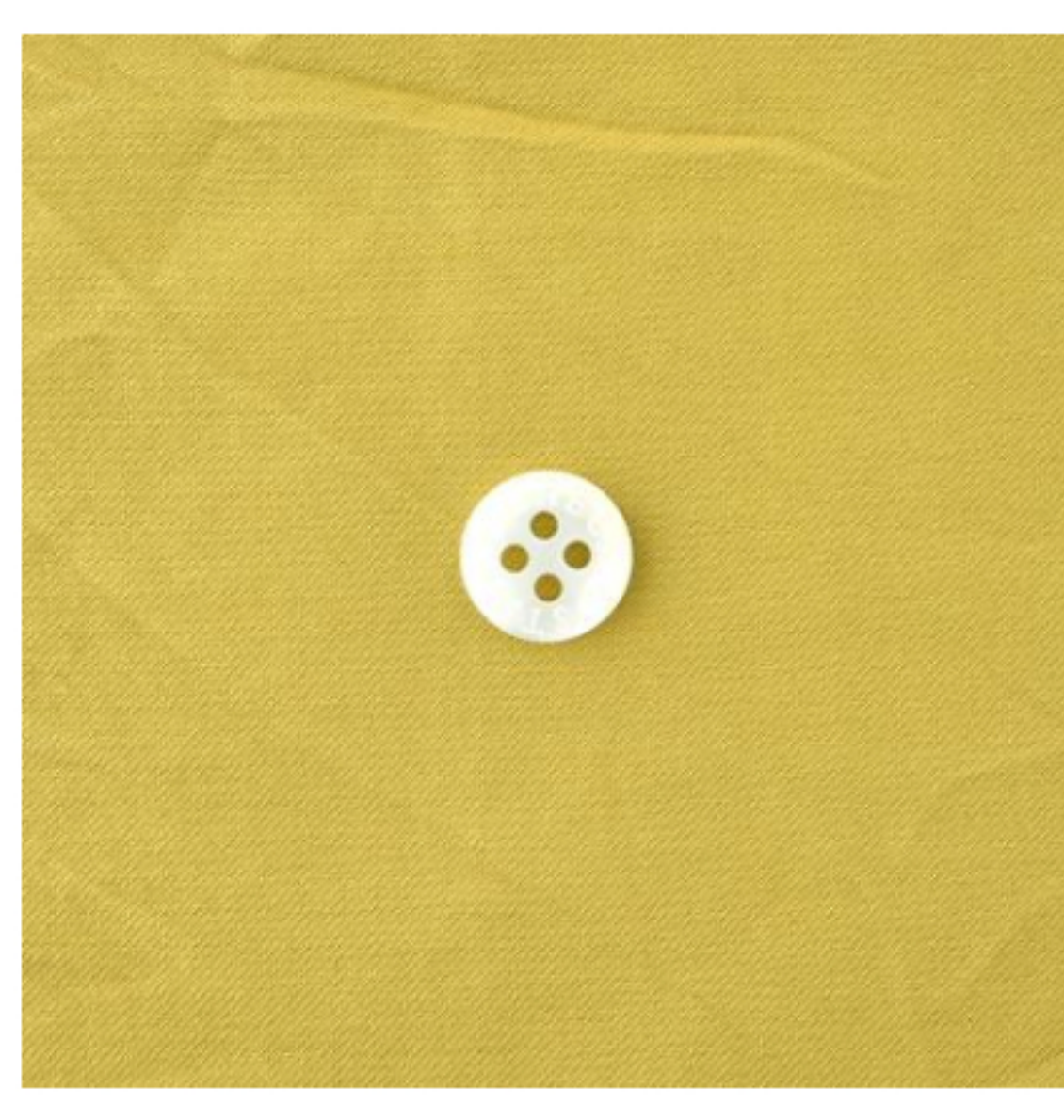
シックマスタード(新色)