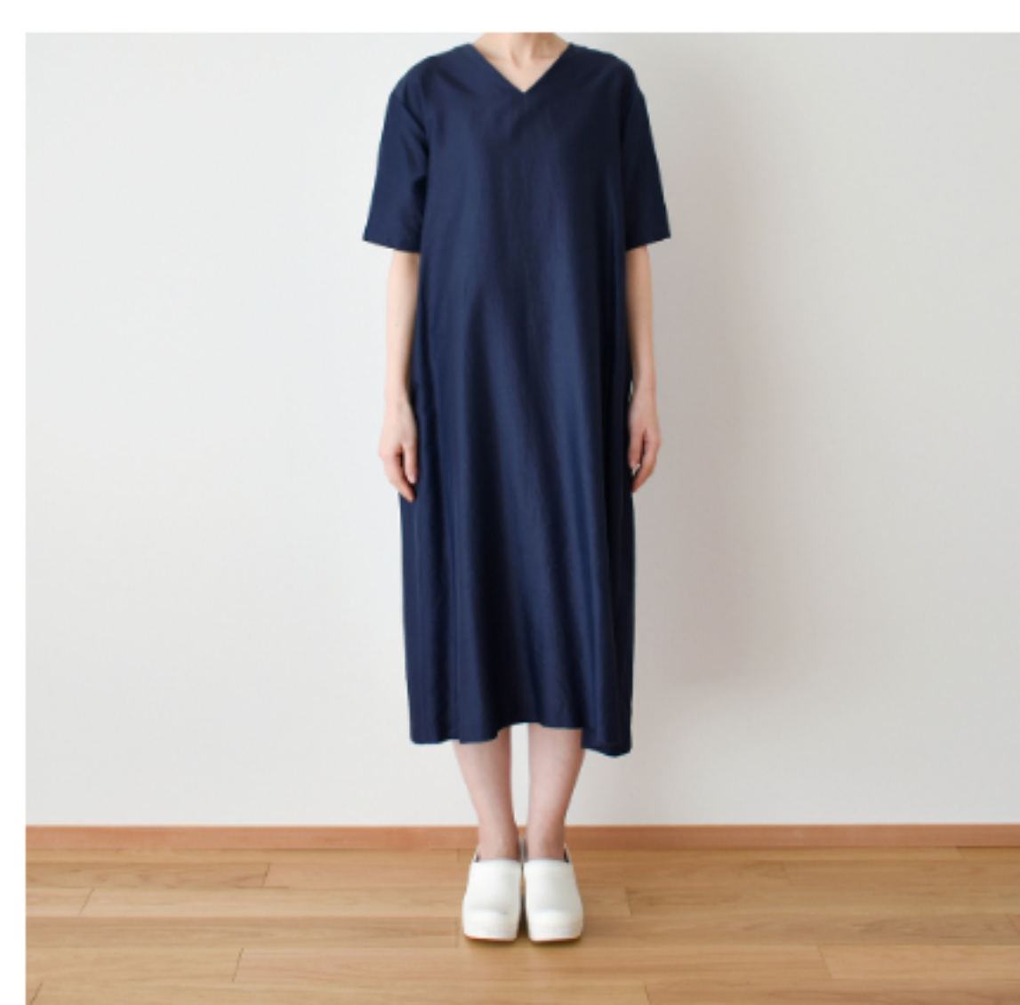
スタンダードネイビー：パターン177