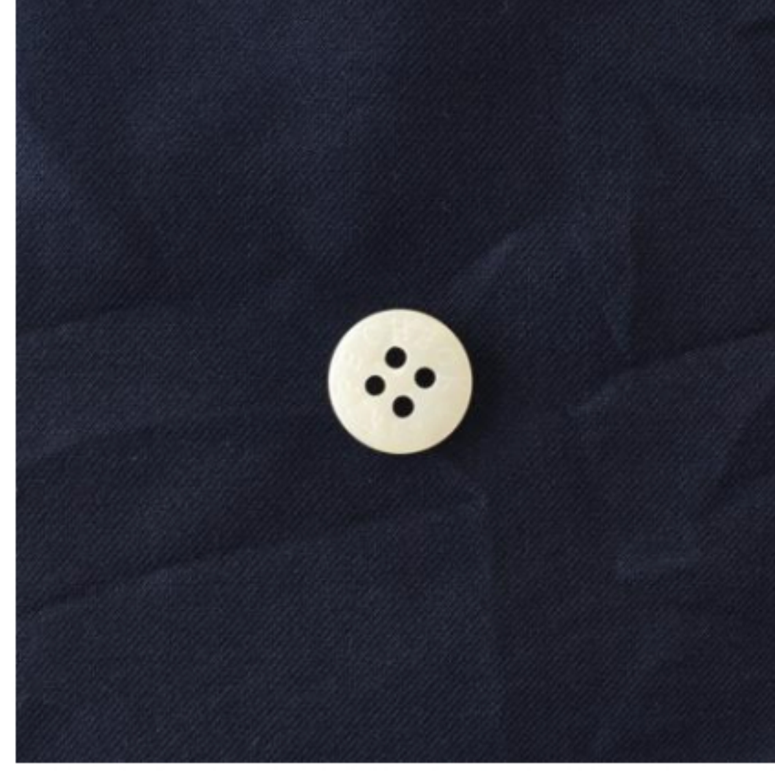
スタンダードネイビー