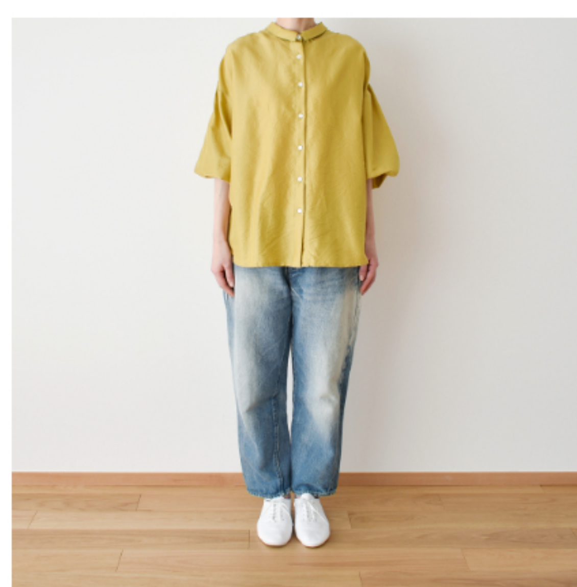
シックマスタード： 『CHECK&STRIPE Sewing Diary in Paris パリのソーイングダイアリー』(世界文化社) ふんわり袖のブラウス 用尺：S 2.7m、M 2.8m、L 2.8m