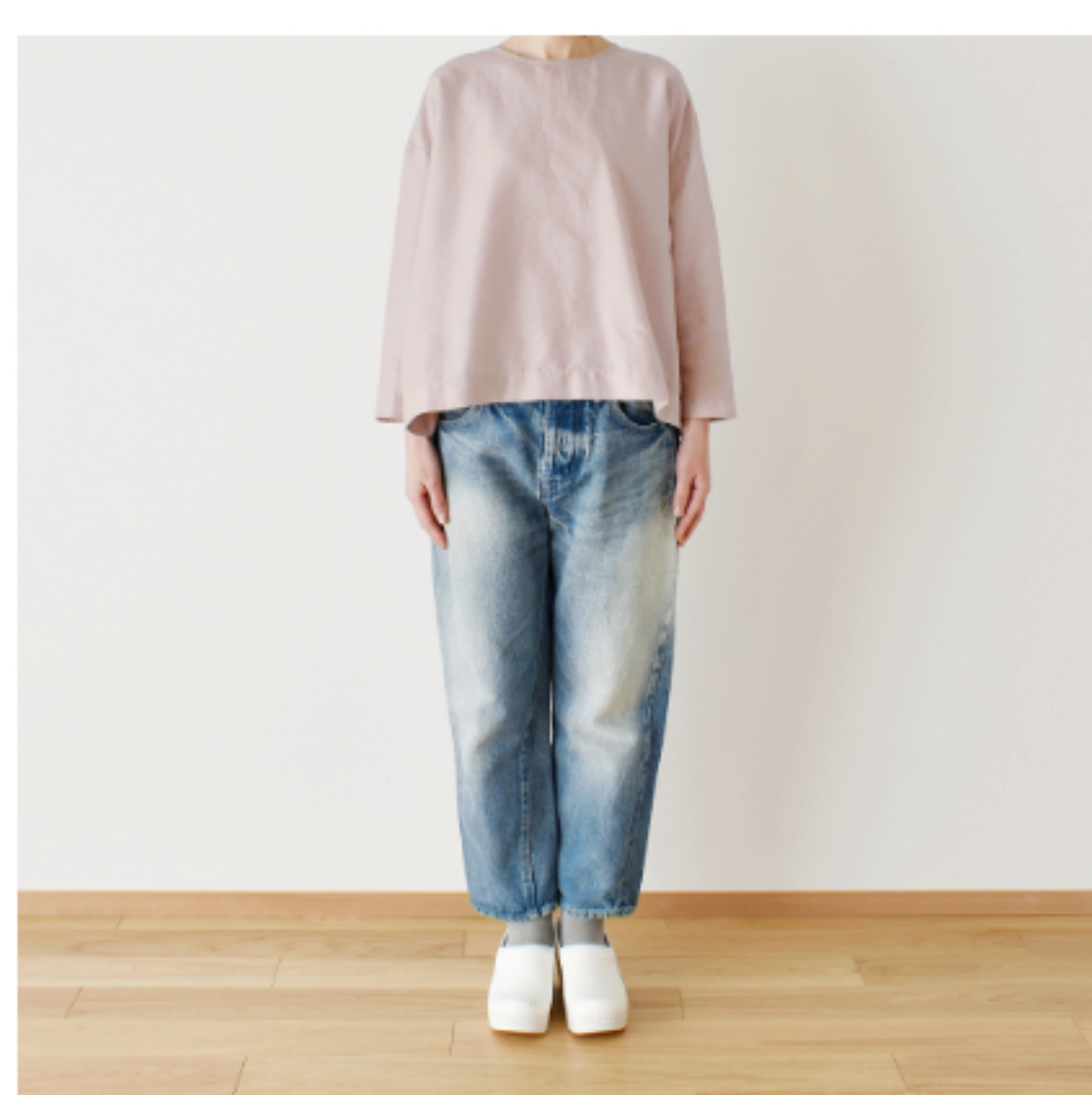
グレイッシュピンク： 『CHECK&STRIPE my favorite 私の好きな服』(主婦と生活社) 後ろボタンのプルオーバー