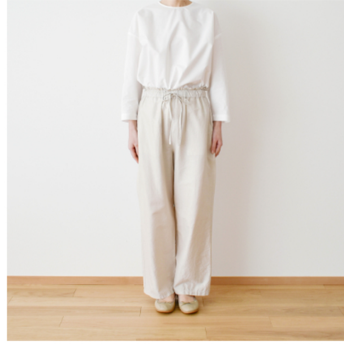
マッシュルーム： 『CHECK&STRIPEのおとな服ソーイング・レメディ』(文化出版局) フローラルパンツ