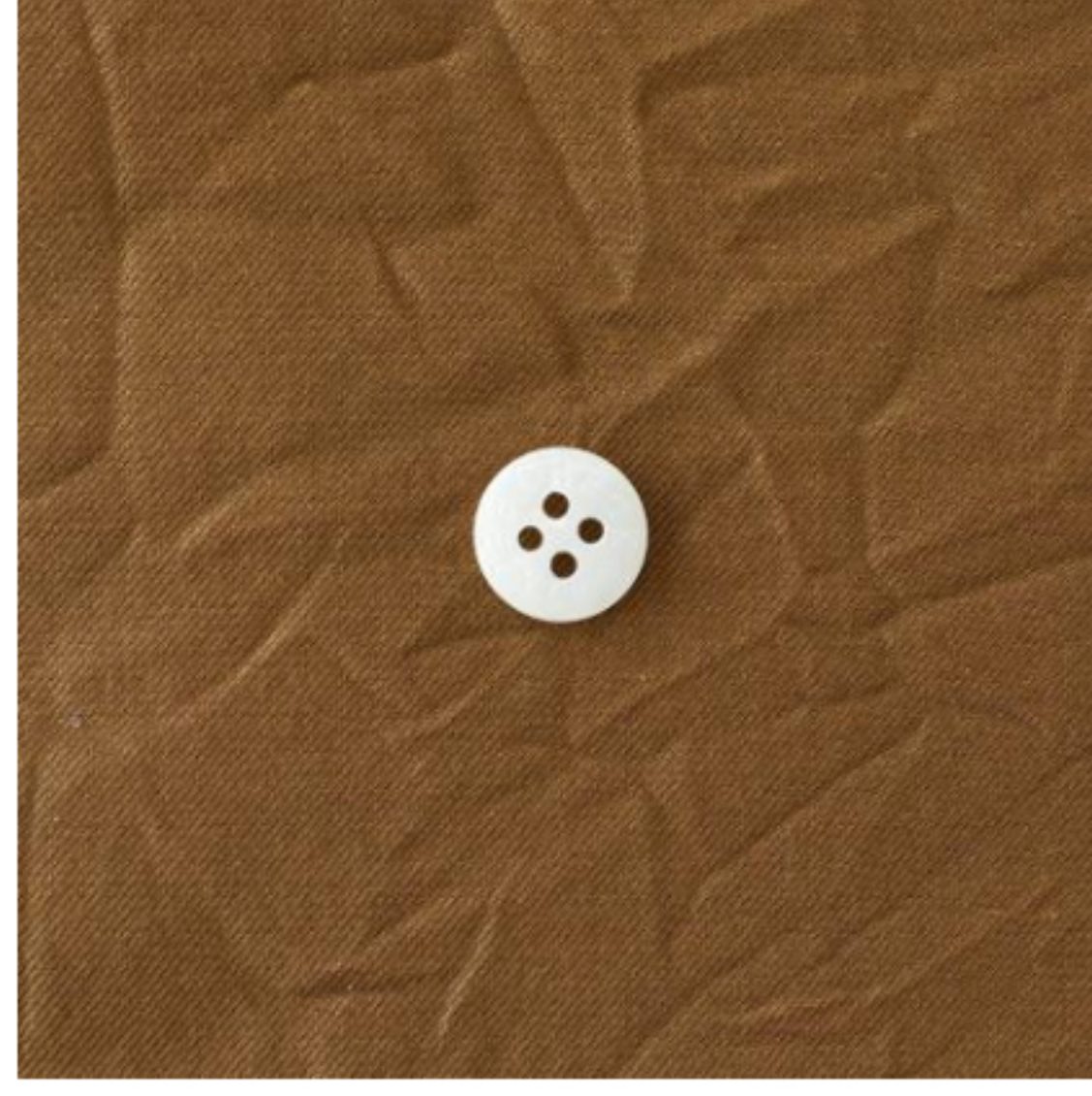
キャラメルブラウン