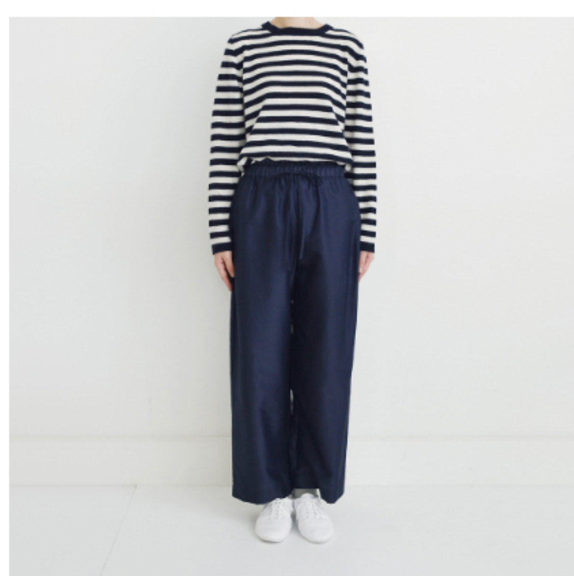
スタンダードネイビー： 『CHECK&STRIPEのおとな服ソーイング・レメディ』(文化出版局) フローラルパンツ