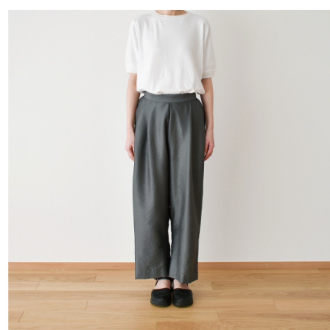
ダークグレー： 『CHECK&STRIPE Sewing Diary in Paris パリのソーイングダイアリー』(世界文化社) ワイドテーパーパンツ 用尺：S 2.7m、M 2.8m、L 2.9m