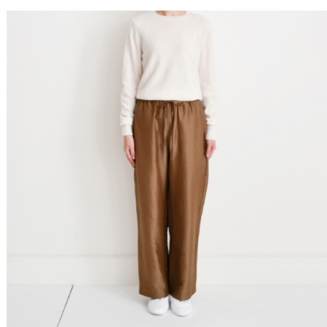
キャラメルブラウン： 『CHECK&STRIPEのおとな服ソーイング・レメディ』(文化出版局) フローラルパンツ