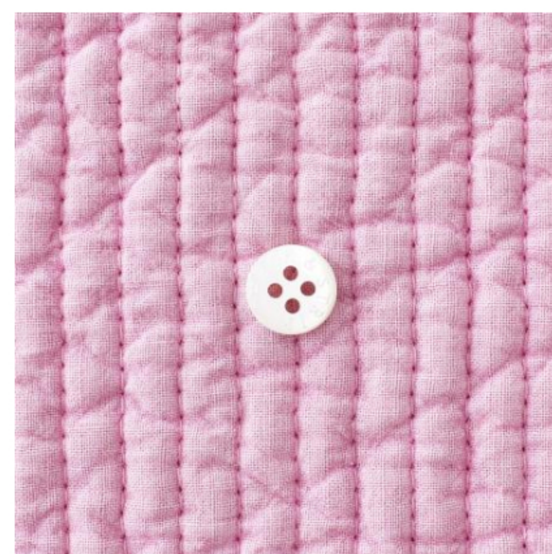
ピンクラベンダー