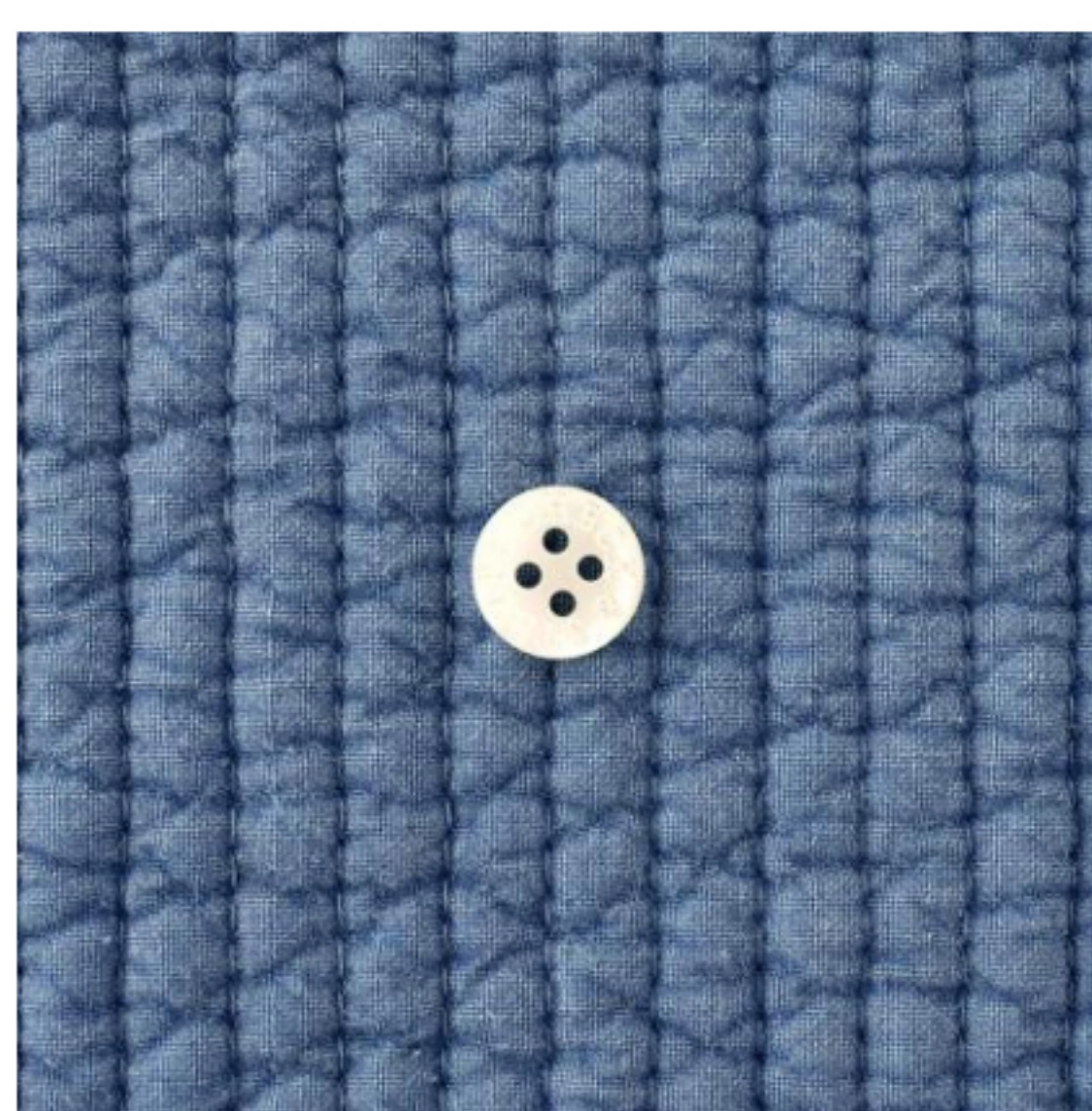
デニムブルー(新色)