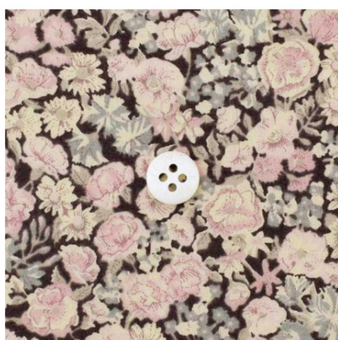
◎J11E(スモーキーピンク系)