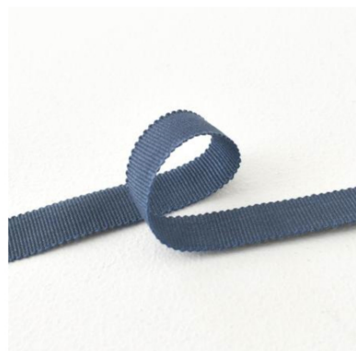
428(グレイッシュブルー)