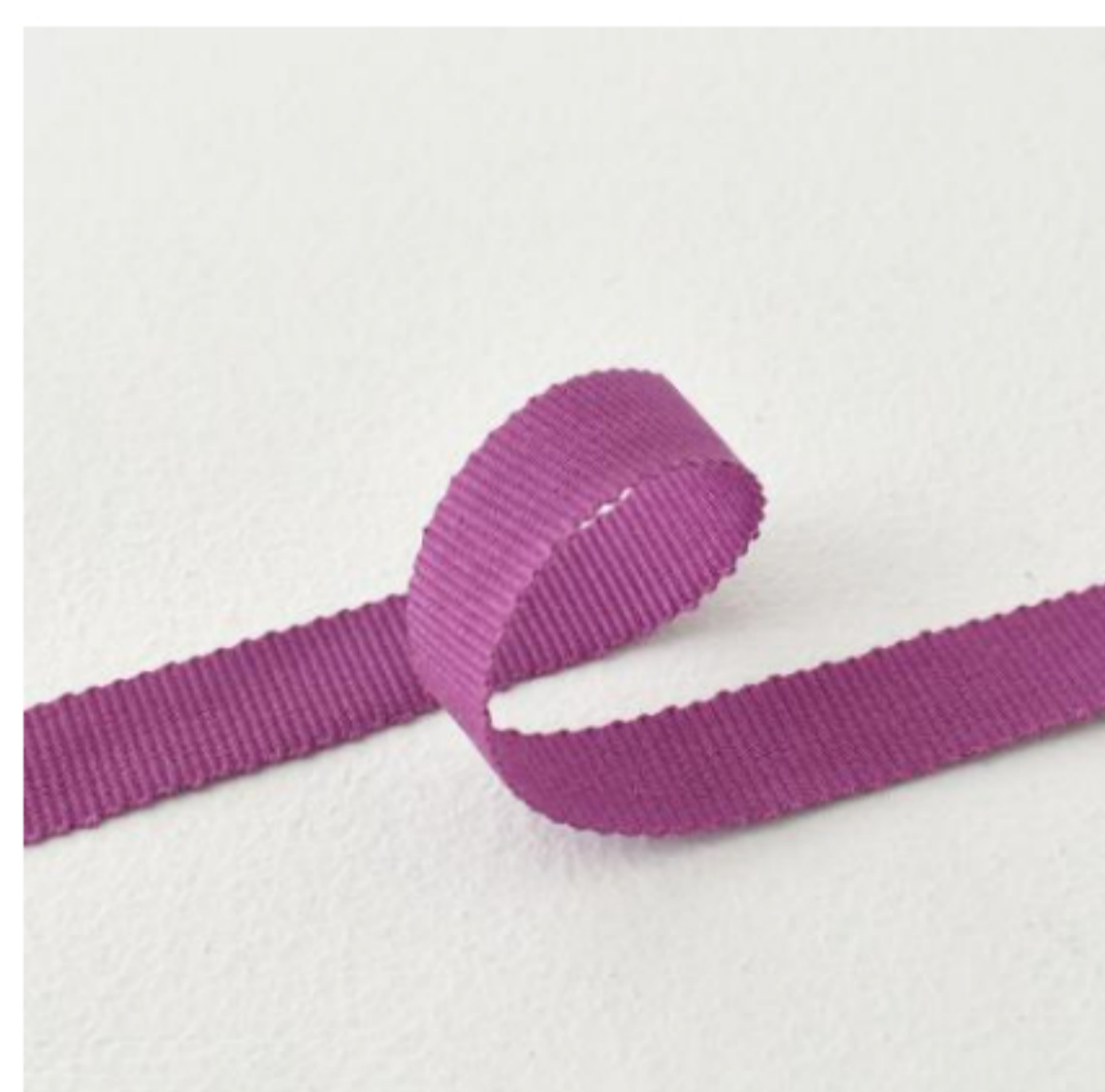
443(ピンクラズベリー)