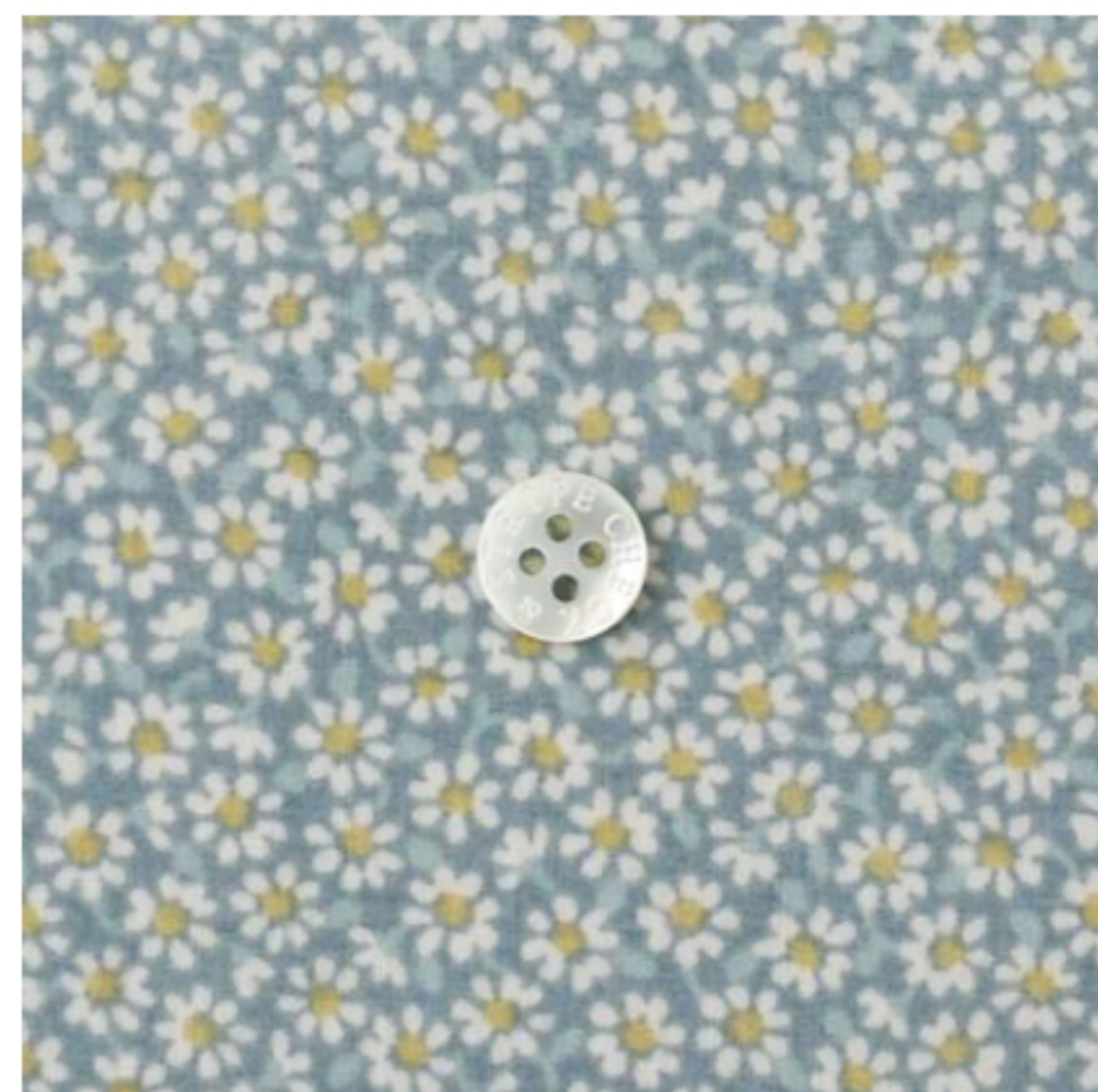
スモークブルーグレー地