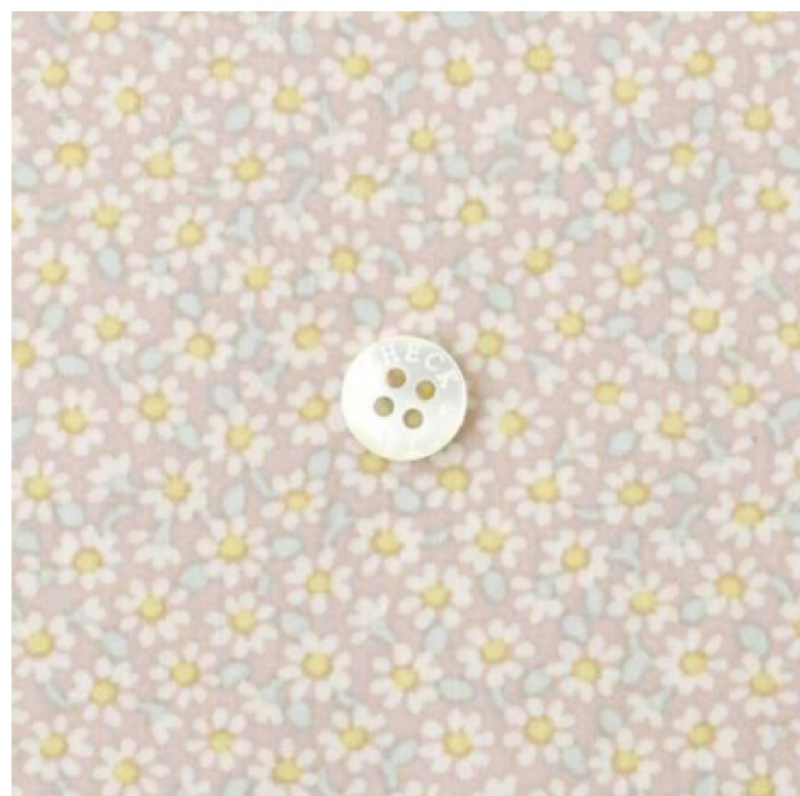
グレイッシュピンク地