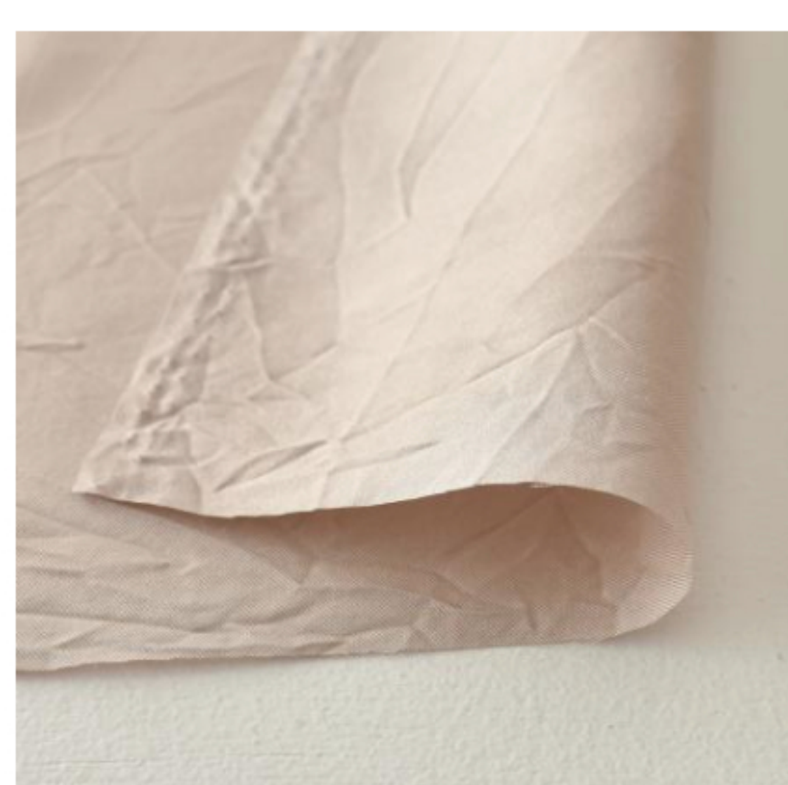
グレイッシュピンク