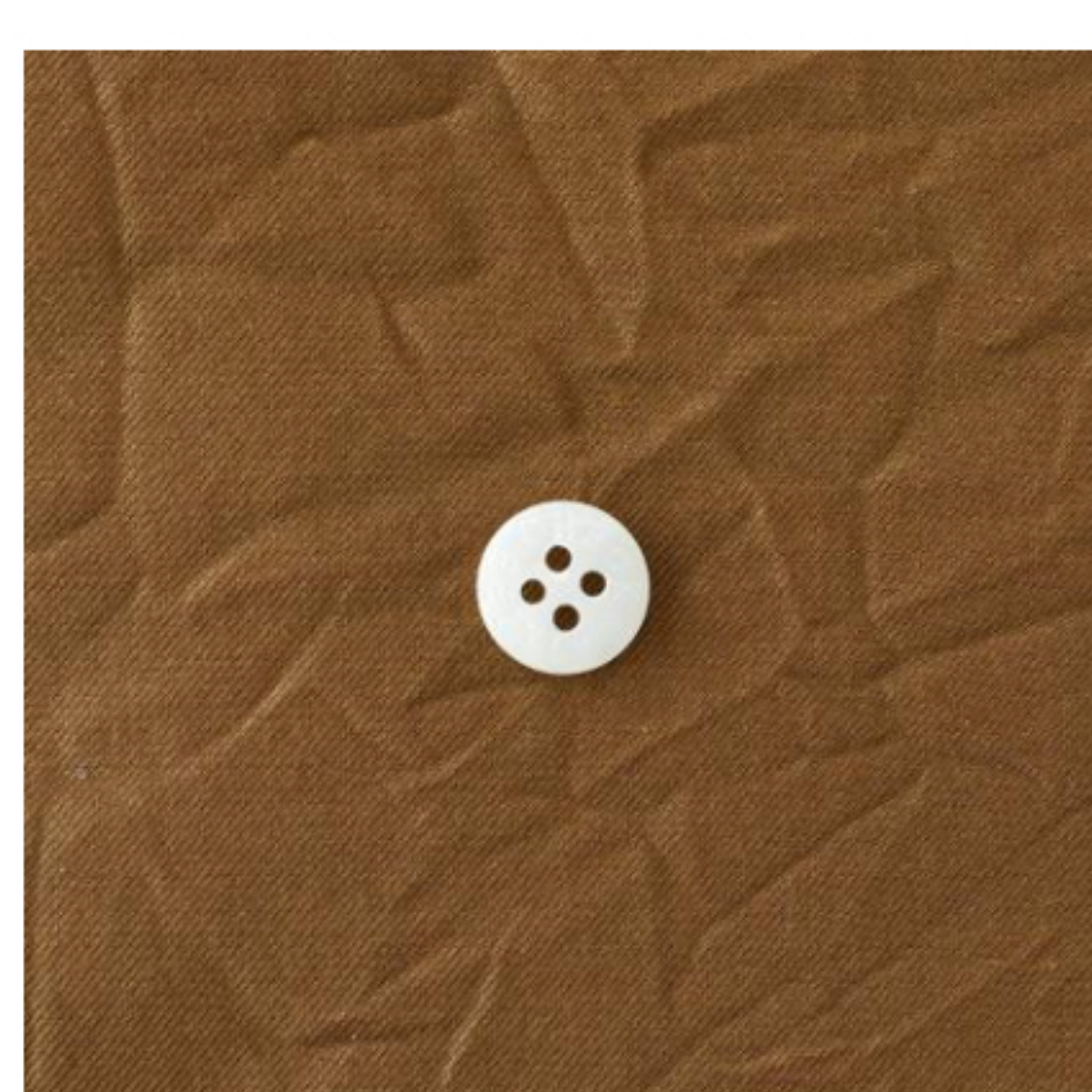
キャラメルブラウン