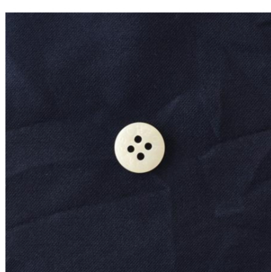
スタンダードネイビー