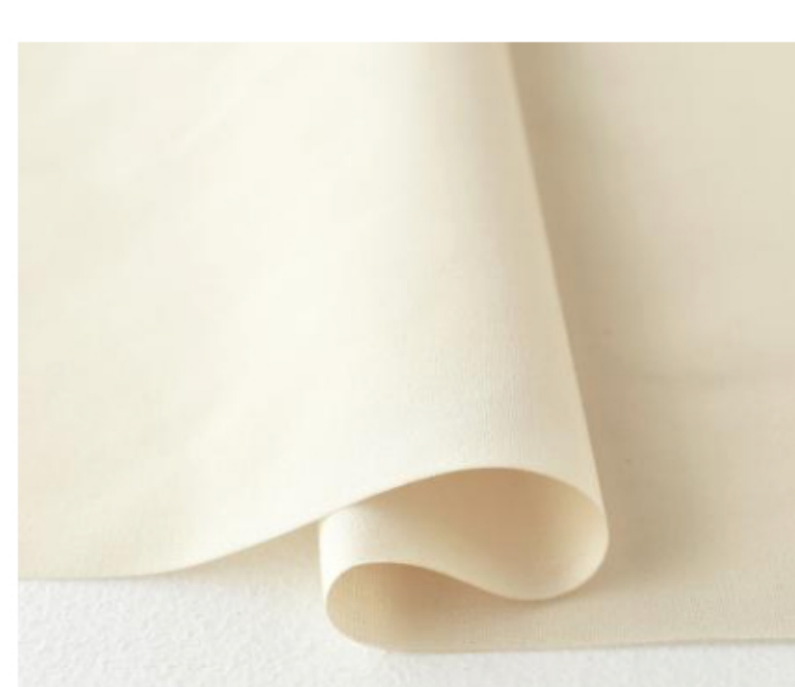
アイボリーベージュ