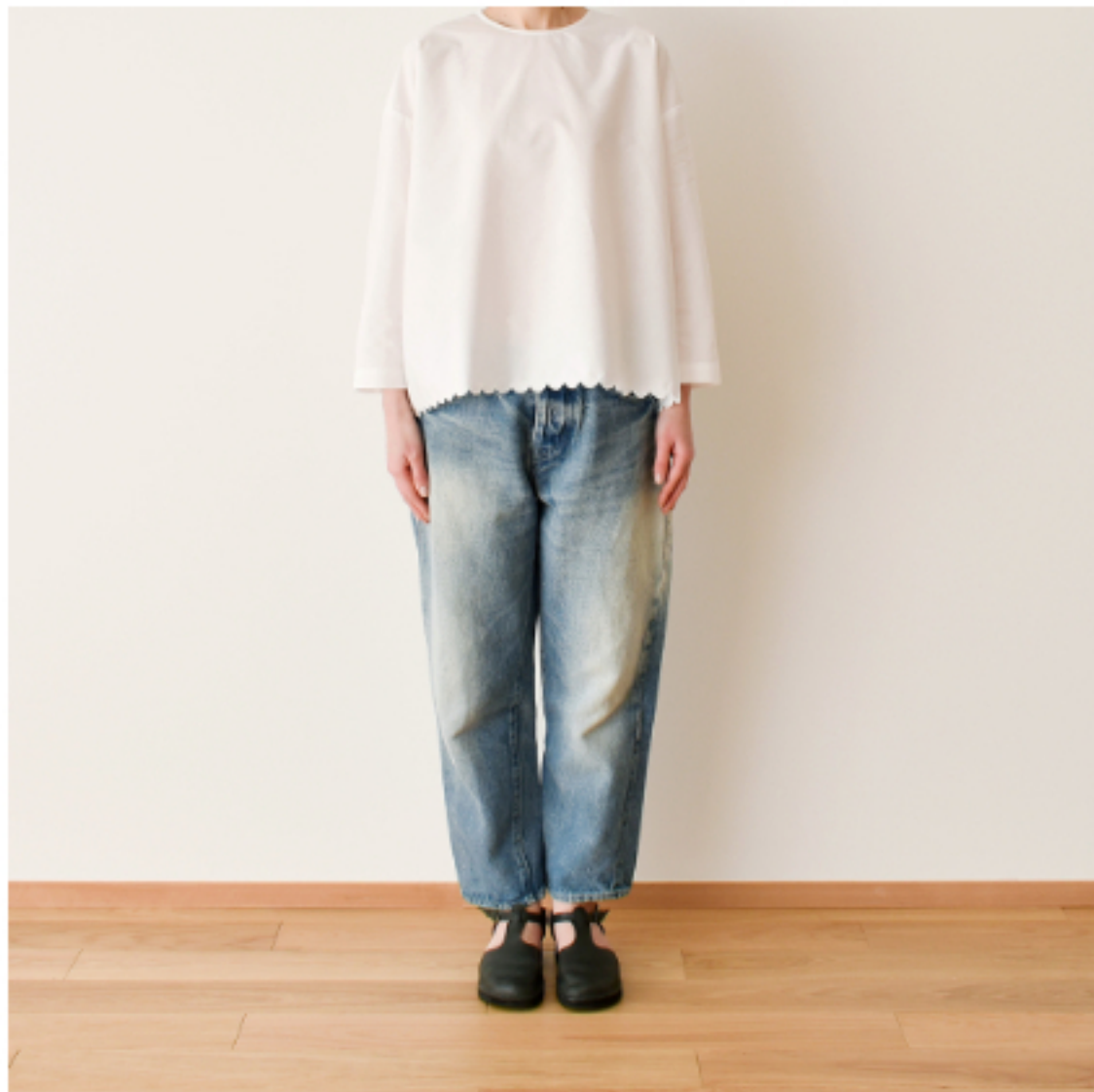
ホワイト：『CHECK&STRIPE my favorite 私の好きな服』(主婦と生活社) 後ろボタンのプルオーバー