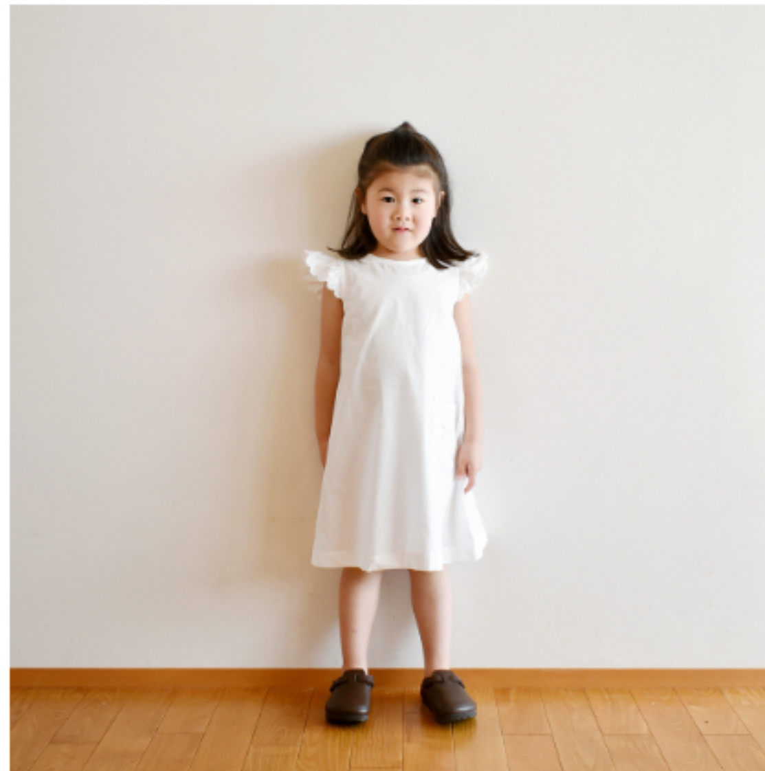
ホワイト：『CHECK&STRIPE STANDARD』(世界文化社) キッズダブルガーゼカットワークのワンピース