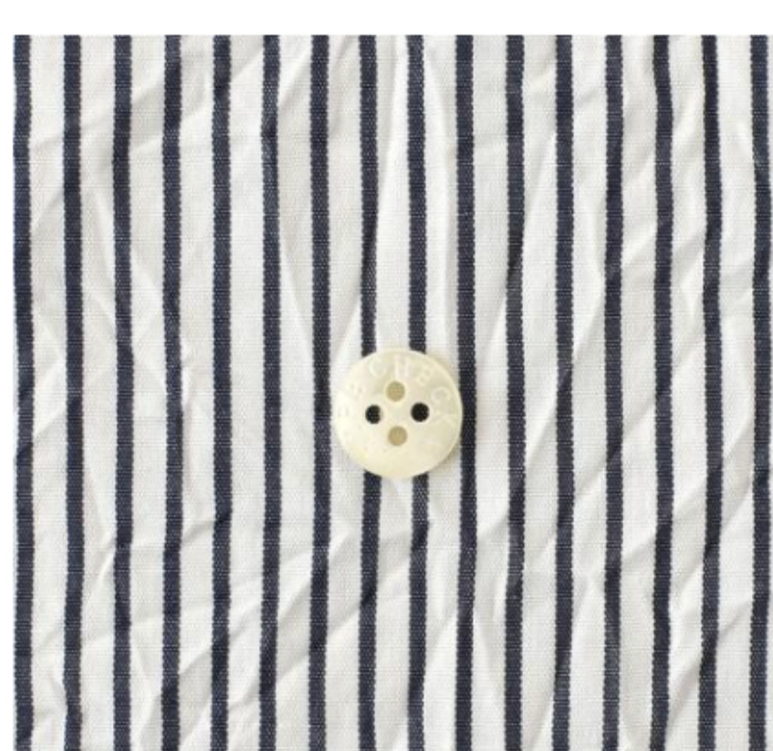
ホワイト×ネイビー 細