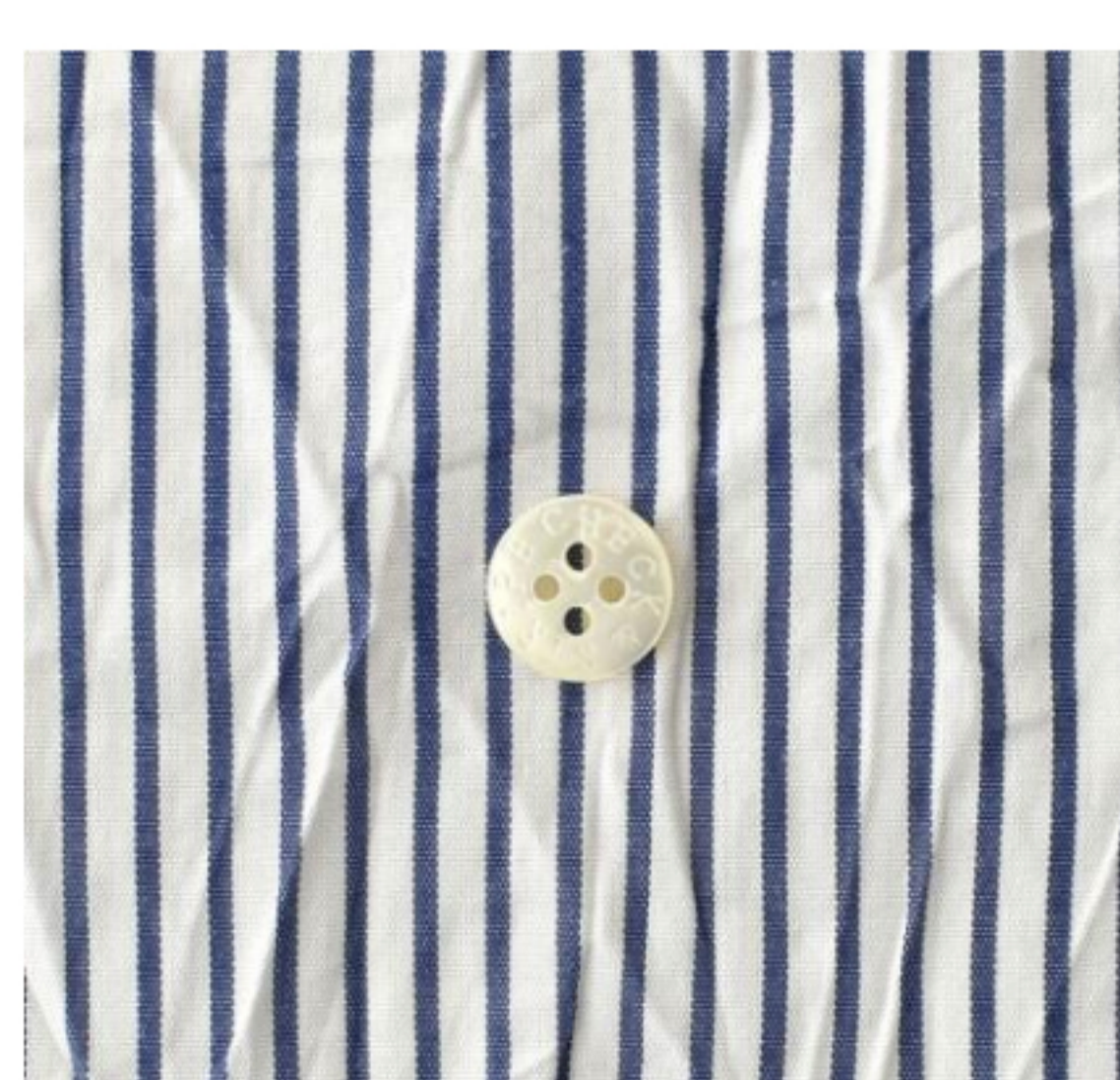
ホワイト×ブルー 細