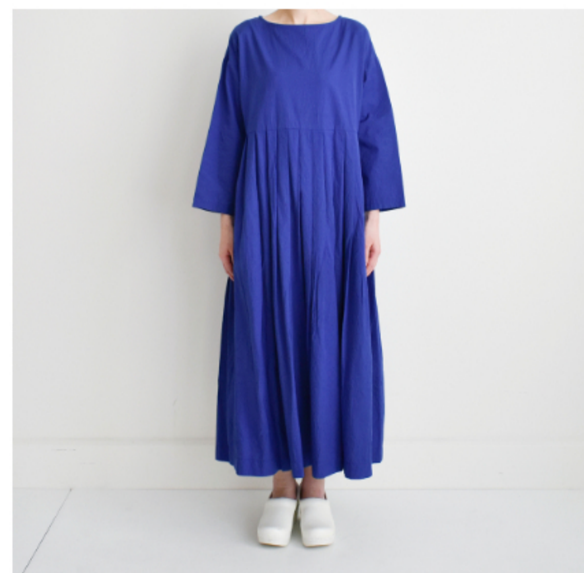
ブルー:『CHECK&STRIPE my favorite 私の好きな服』(主婦と生活社) タックワンピース