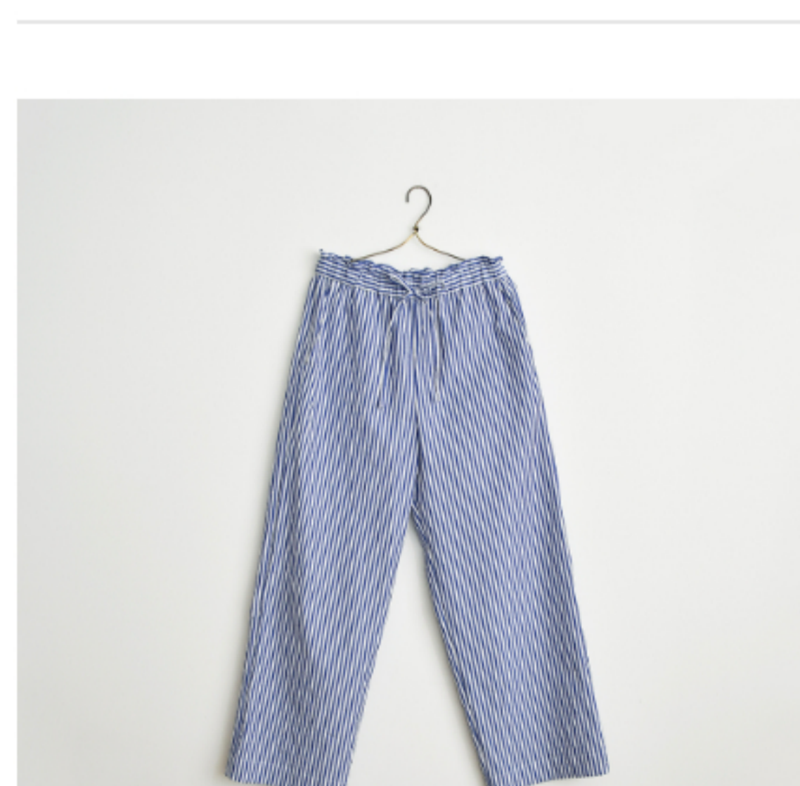
ブルー×ホワイト: 『CHECK&STRIPEのおとな服 ソーイング・レメディ』(文化 出版局) フローラルパンツ