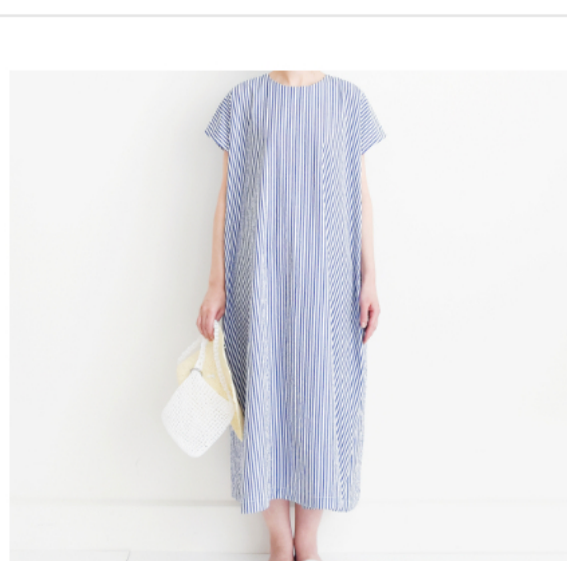
ブルー×ホワイト: 『CHECK&STRIPEのおとな服 ソーイング・レメディ』(文化 出版局) シンプルAラインワンピ ース ※袖を付けず、袖ぐりは 縫い代をロック+二つ折りにし て縫っています。用尺:S・ M2.8m、L 2.9m