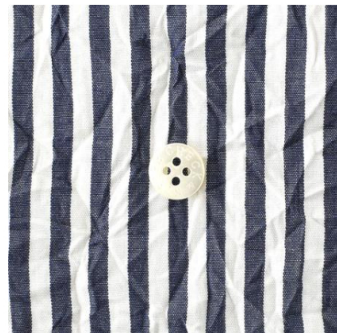
ネイビー×ホワイト