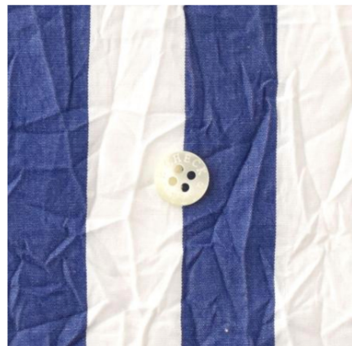
ブルー×ホワイト 太