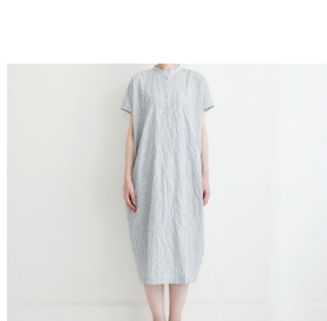
ホワイト×ブルー 細: 『CHECK&STRIPE my favorite 私の好きな服』(主婦と 生活社) スタンドカラーのヨーク ワンピース