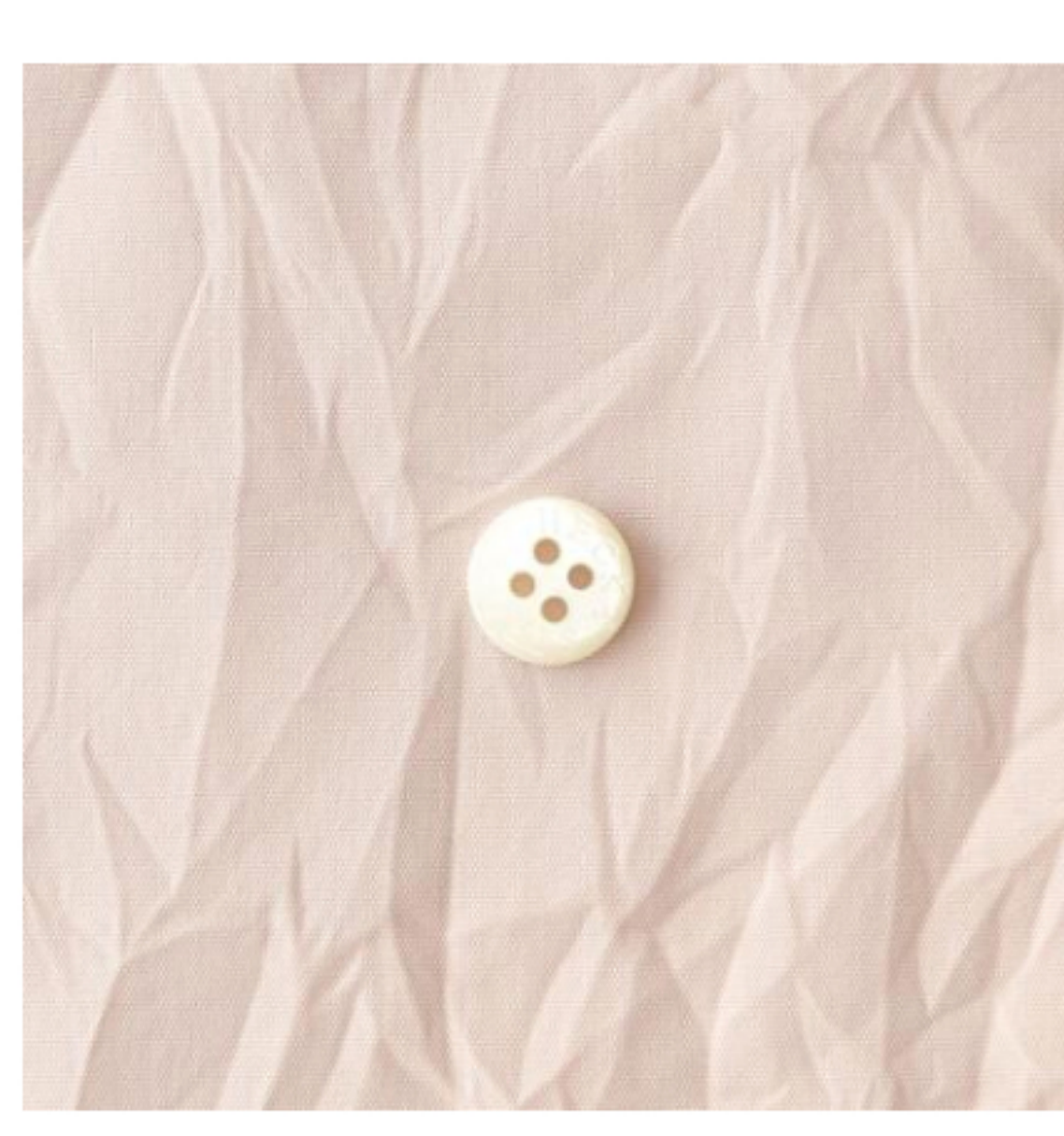
グレイッシュピンク(新色)