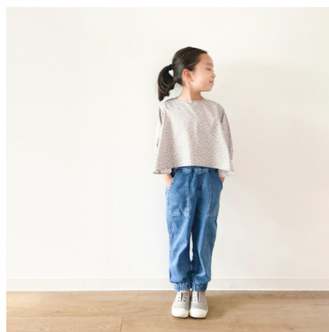
あずきミルク地にマッシュルームとピンク:『CHECK&STRIPEの子ども服 ソーイング・ナーサリー』(文化出版局) バルーンスリーブのブラウス