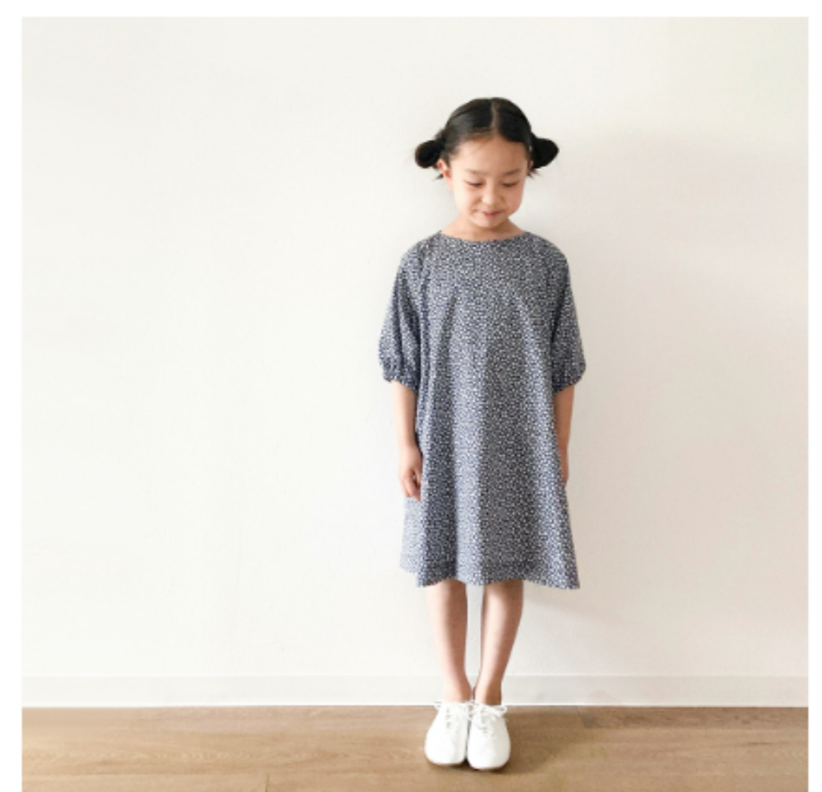
ネイビー地にマッシュルームとピンク:『CHECK&STRIPEの子ども服 ソーイング・ナーサリー』(文化出版局) バルーンスリーブのワンピース