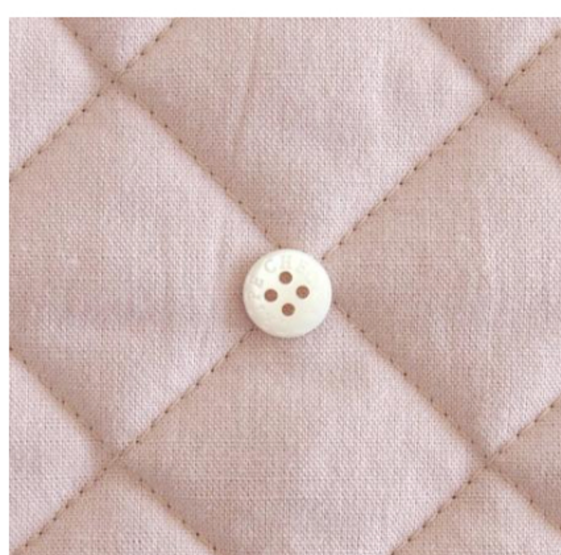
グレイッシュピンク