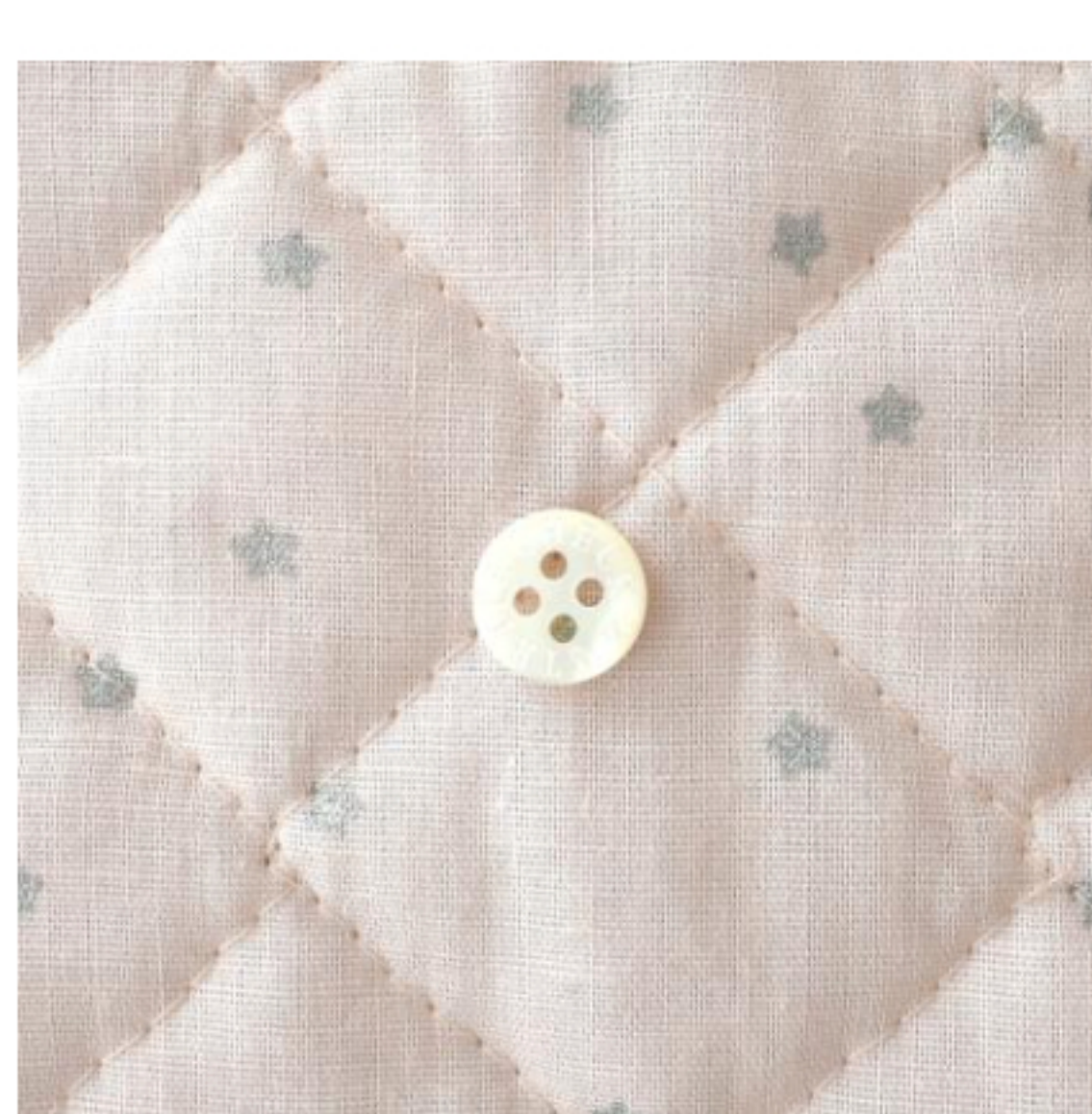
グレイッシュピンクにシルバー