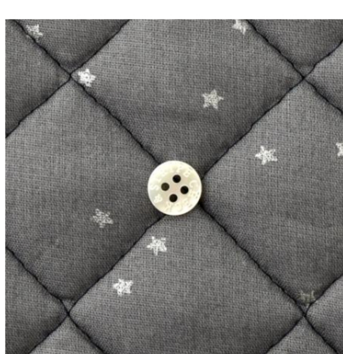
ラベンデュールにシルバー