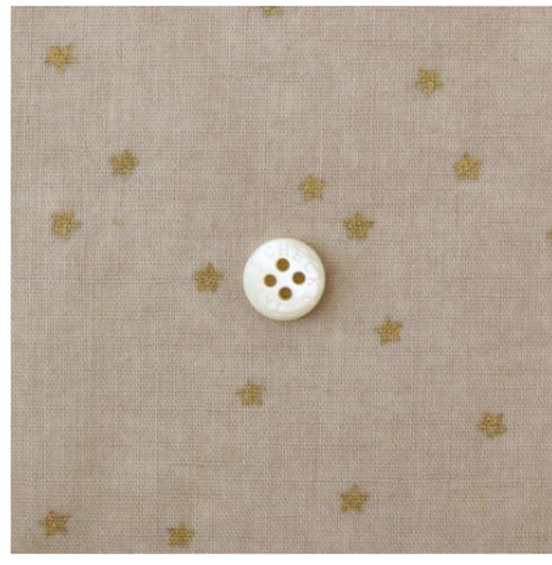
ソイラテにゴールド