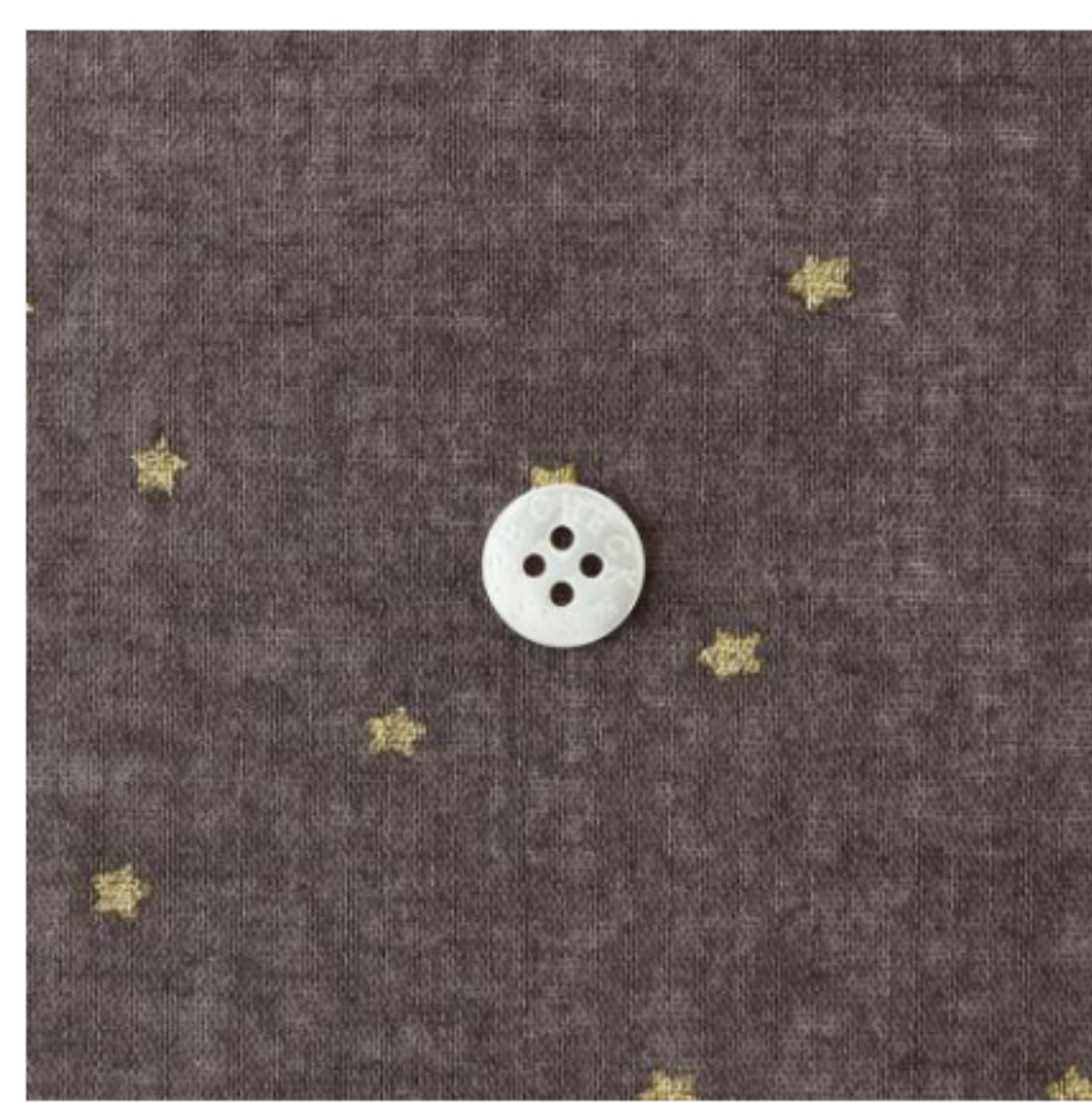
グレイッシュブラウンにゴールド