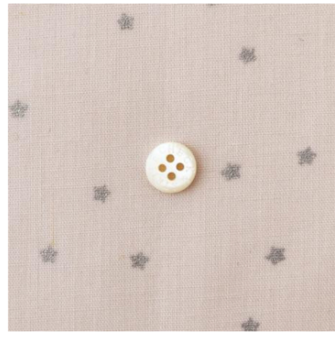
グレイッシュピンクにシルバー