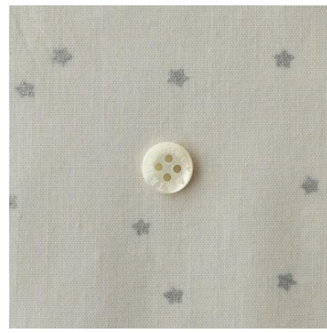
ミスティグレーにシルバー