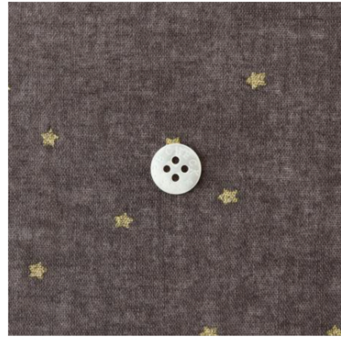
グレイッシュブラウンにゴールド