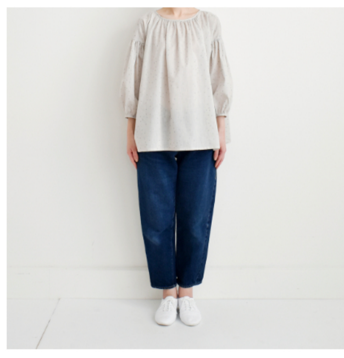
ミスティグレーにシルバー: 『CHECK&STRIPEのおとな服 ソーイング・レメディ』(文化 出版局) スタンダードギャザー ブラウス