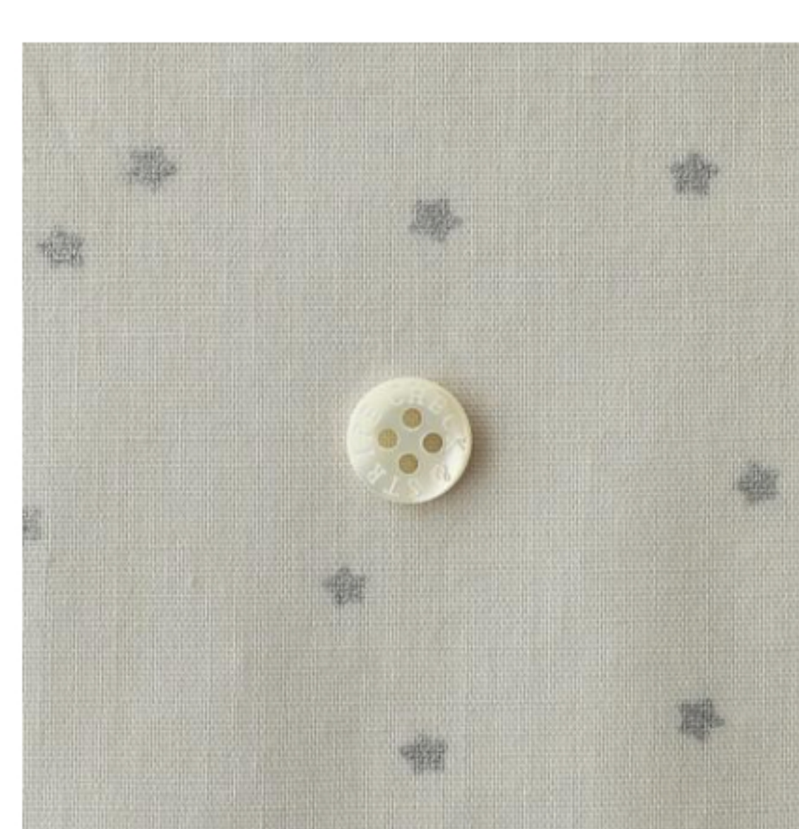
ミスティグレーにシルバー