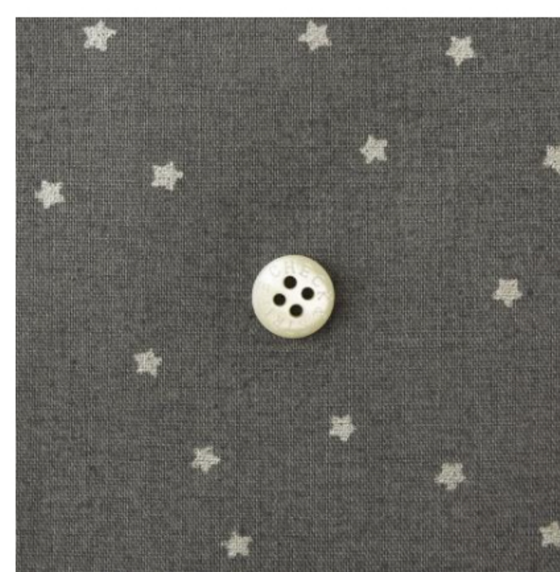
ラベンデュラにシルバー