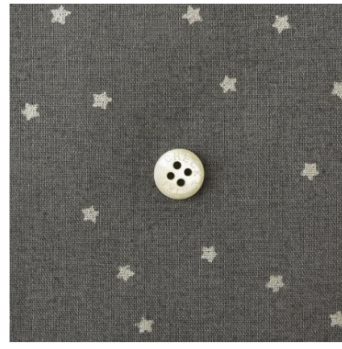
ラベンデュラにシルバー