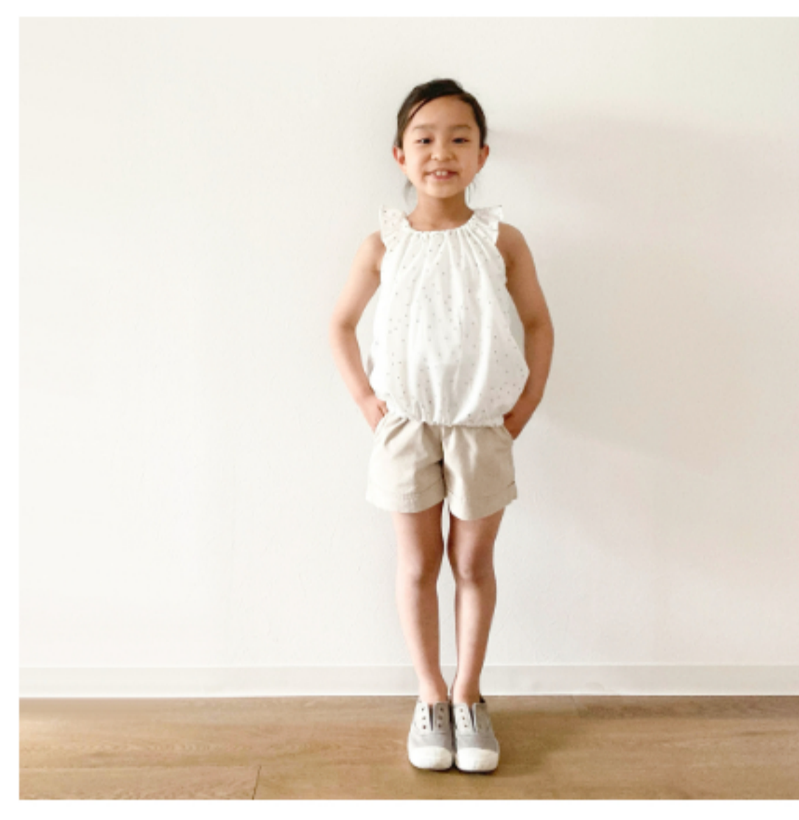
白にシルバー: 『CHECK&STRIPE SEW HAPPY』(世界文化社) 天使の ブラウス・子ども