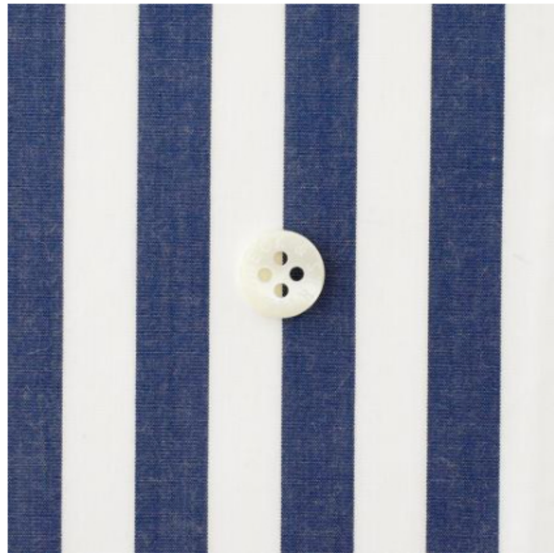
ホワイト×ネイビー