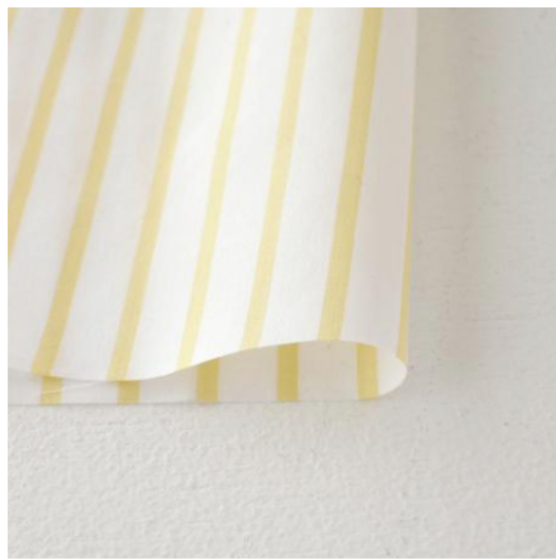
ホワイト×カスタード