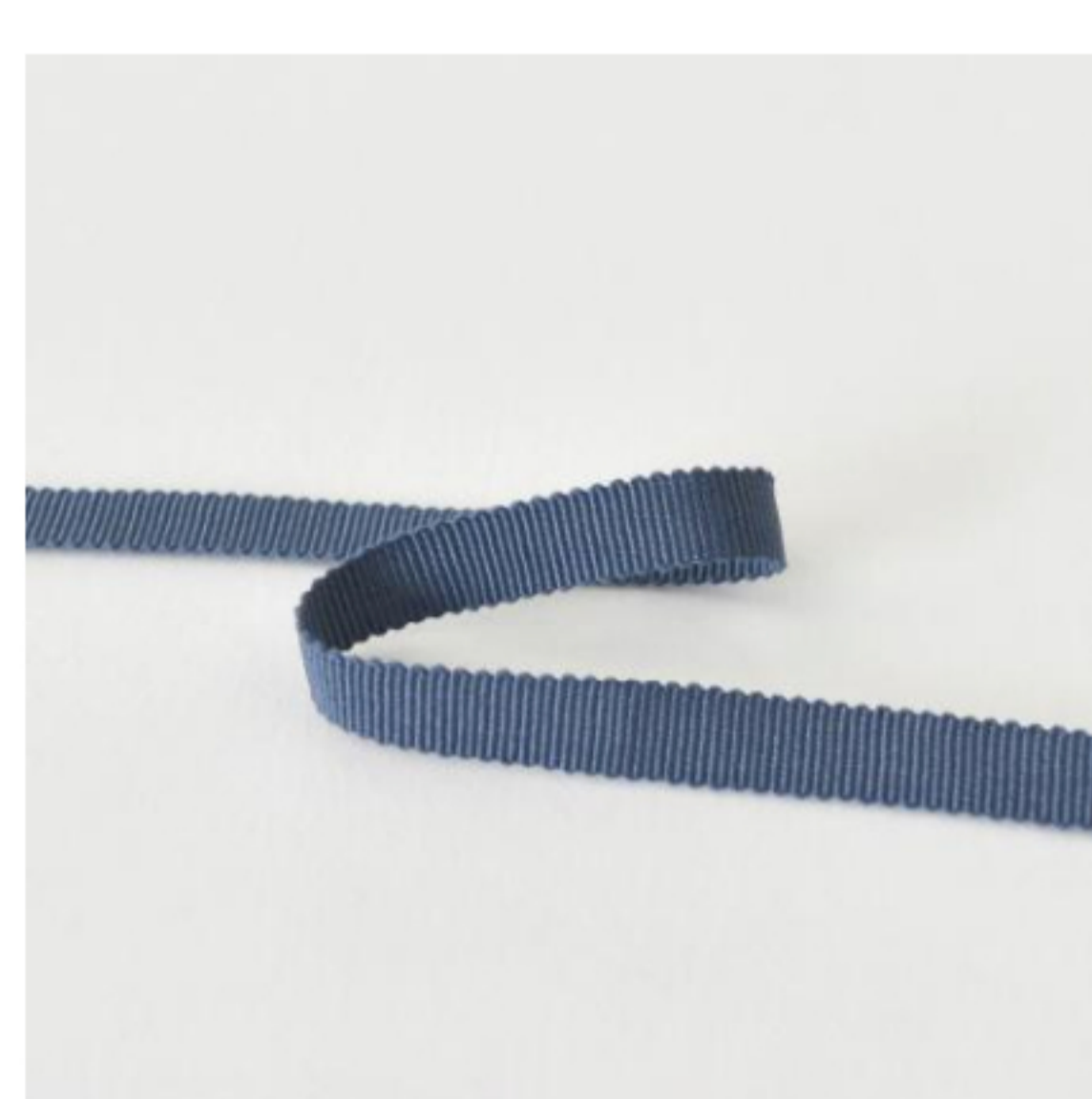
428(グレイッシュブルー)