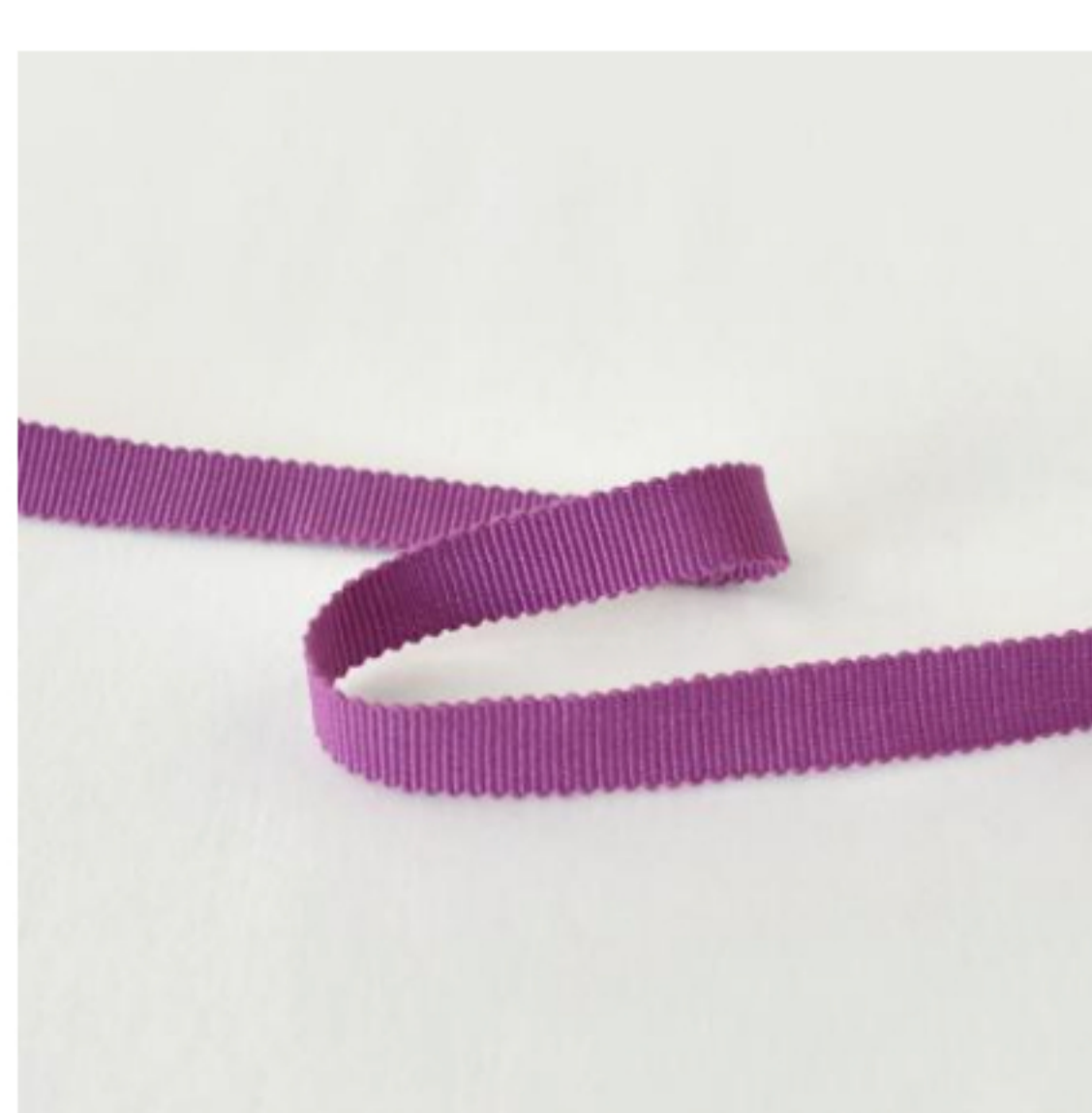
443(ピンクラズベリー)