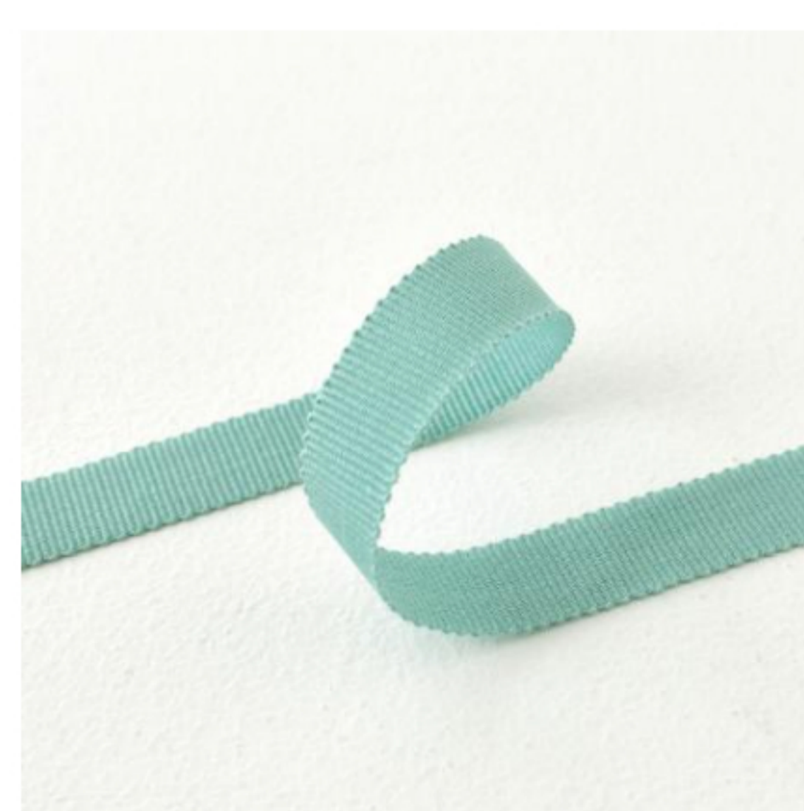
486(スモークグリーン)