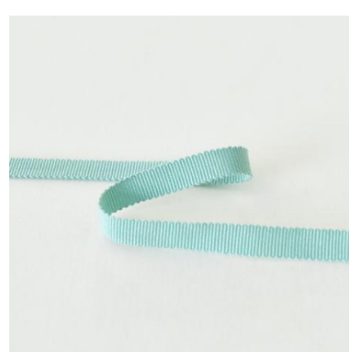
486(スモークグリーン)