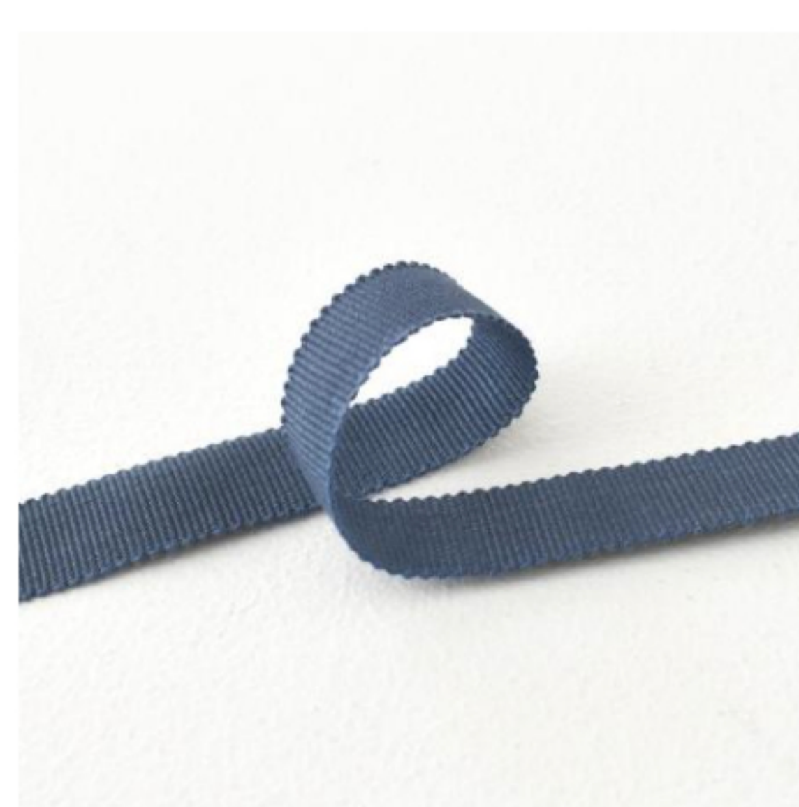
428(グレイッシュブルー)