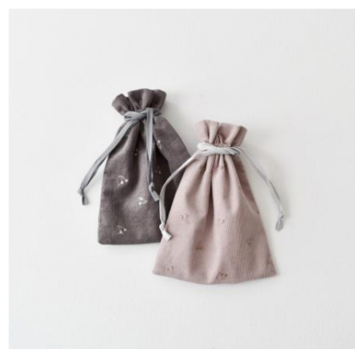
あずきクリームとミルクココア