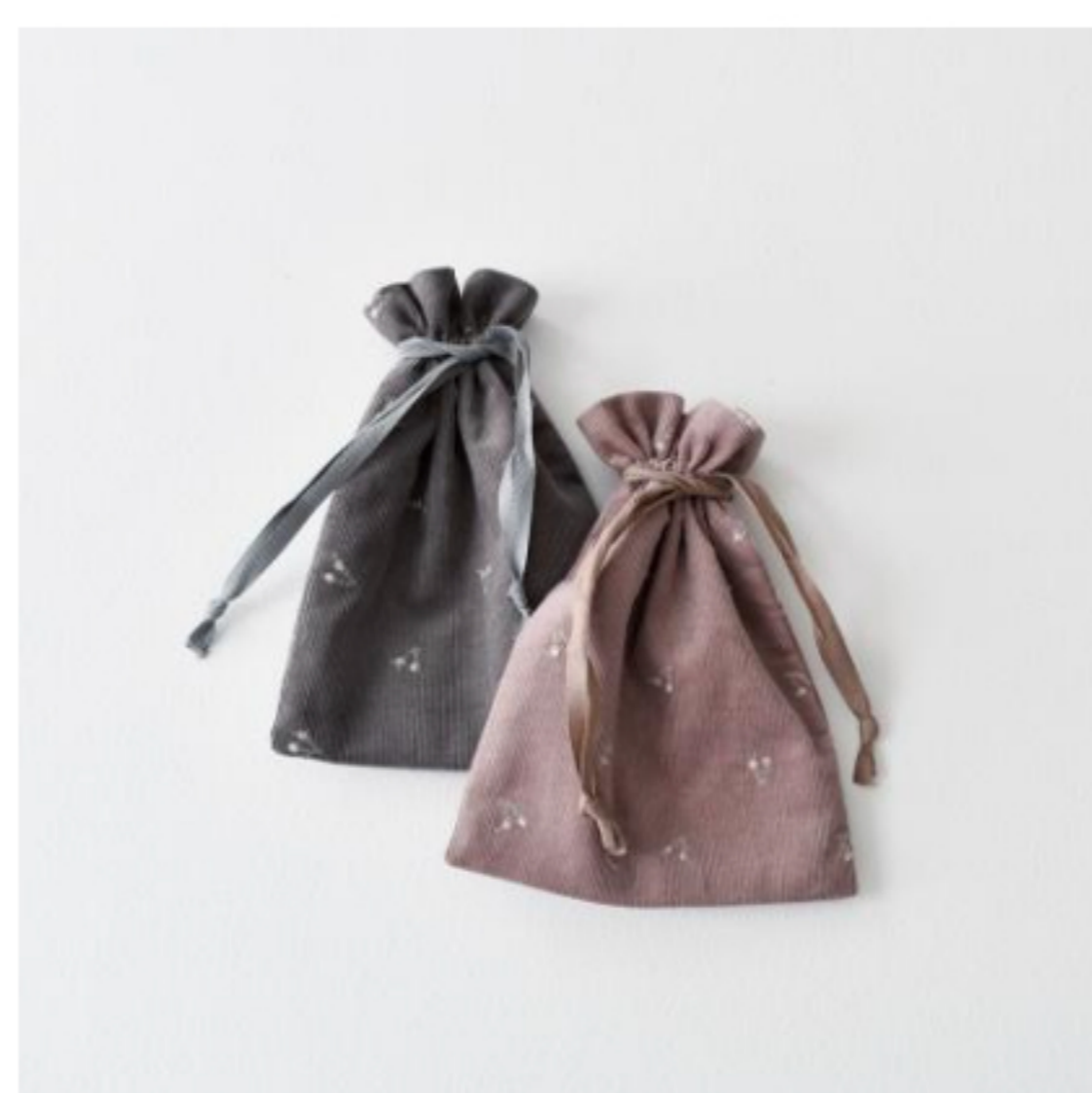
あずきミルクとミルクココア