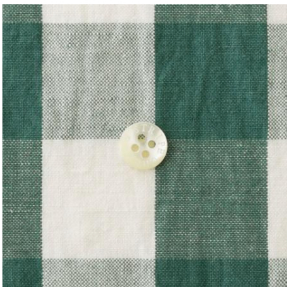
イングリッシュハーブグリーン