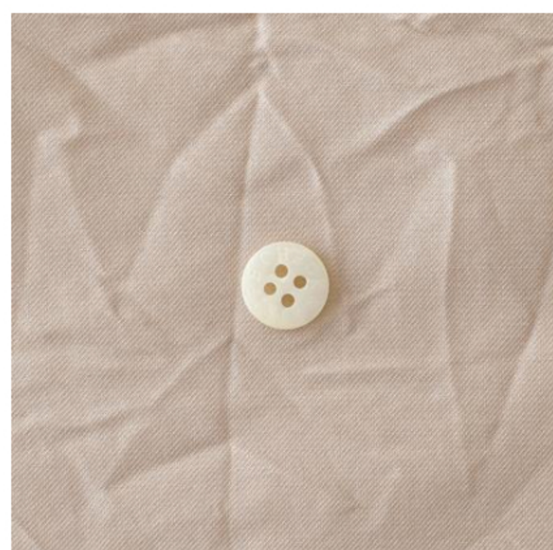
グレイッシュピンク