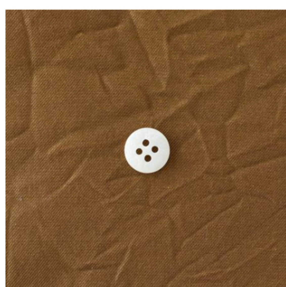
キャラメルブラウン