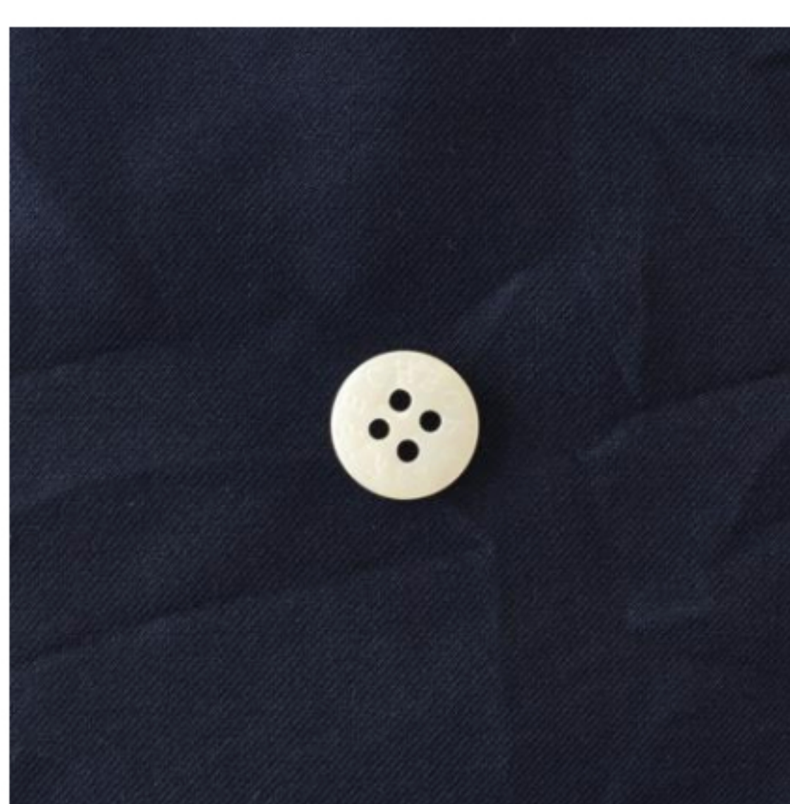
スタンダードネイビー