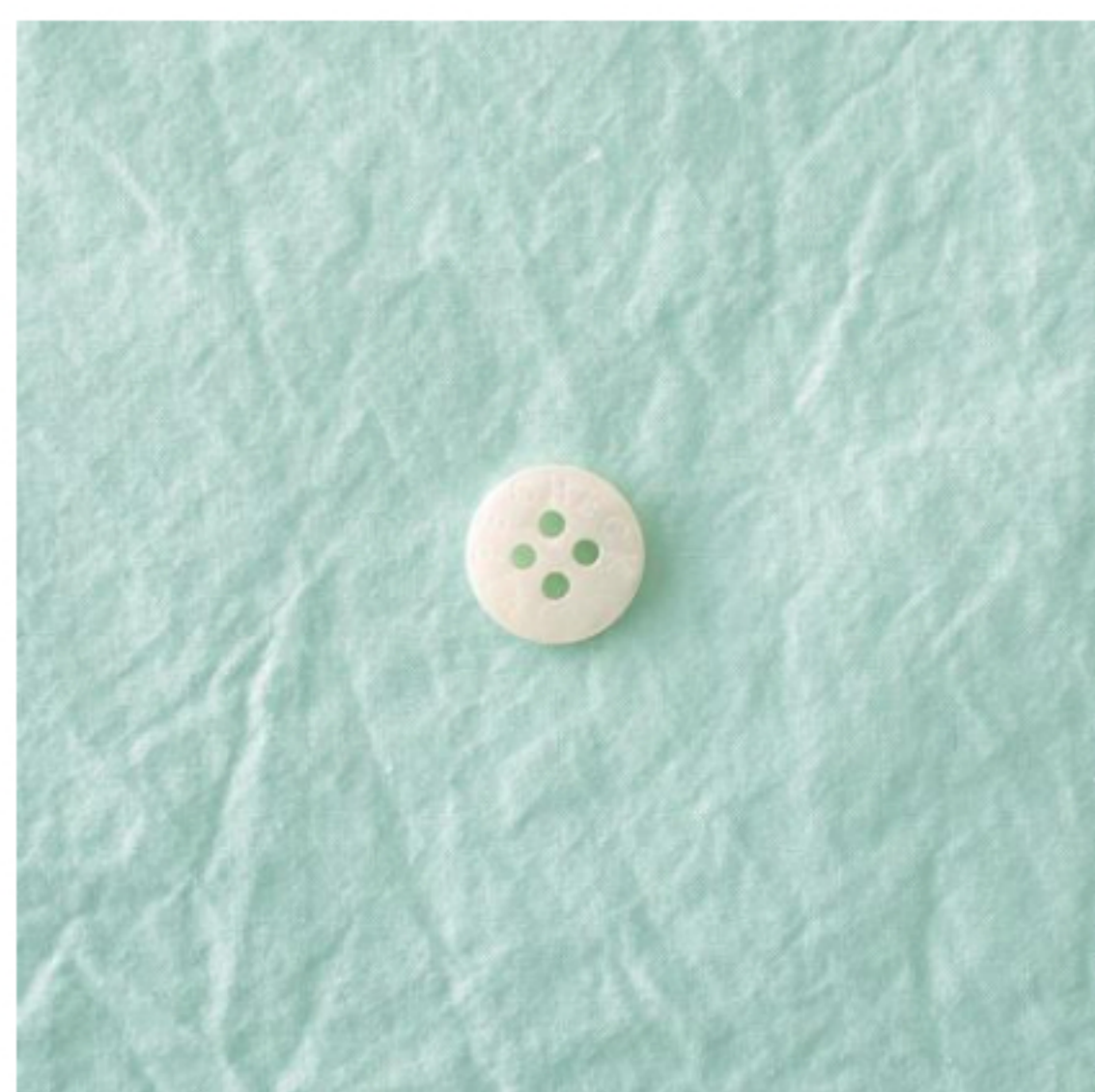
パステルグリーン(新色)