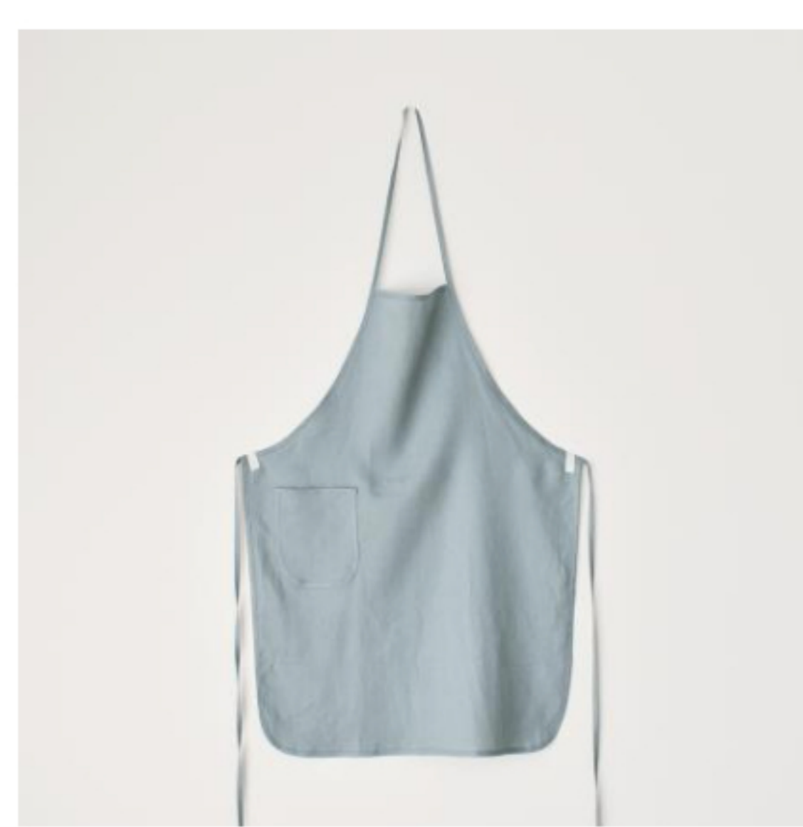
スモークブルーグレー