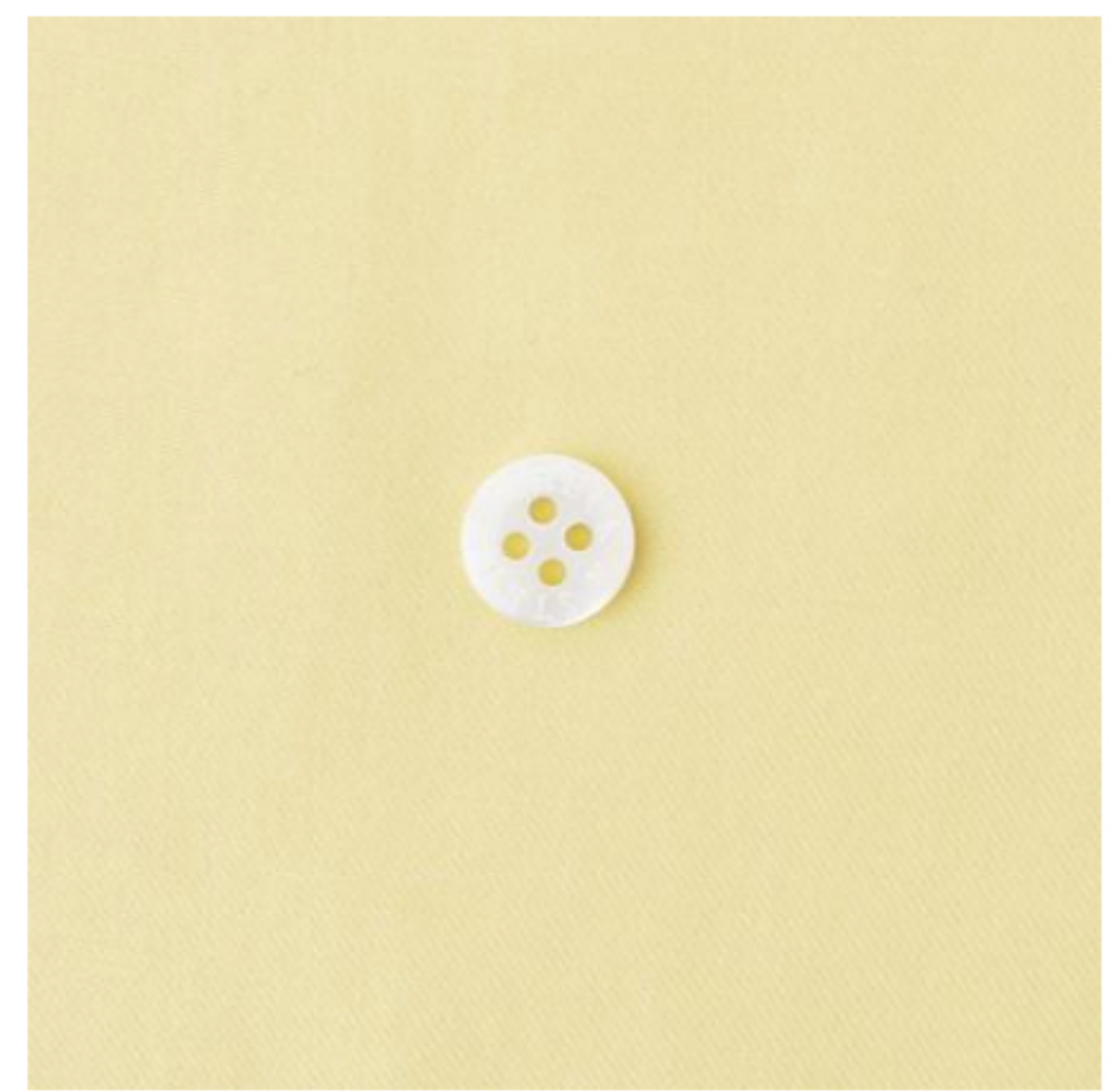
カナリーイエロー