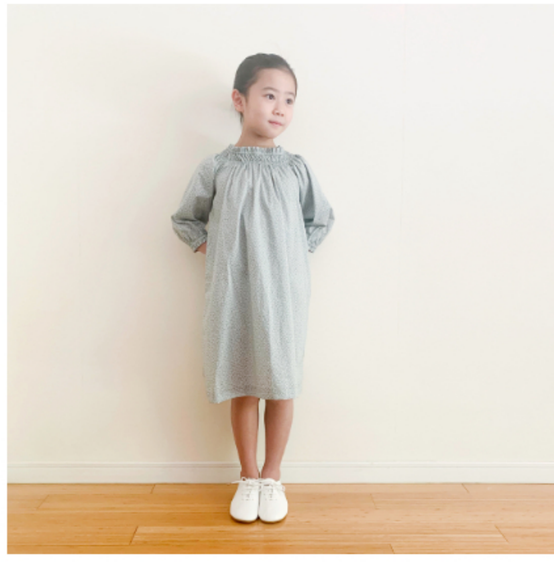
スモークブルーグレー地: 『CHECK&STRIPE SEW HAPPY』(世界文化社) ゴム シャーリングのワンピース 子ども