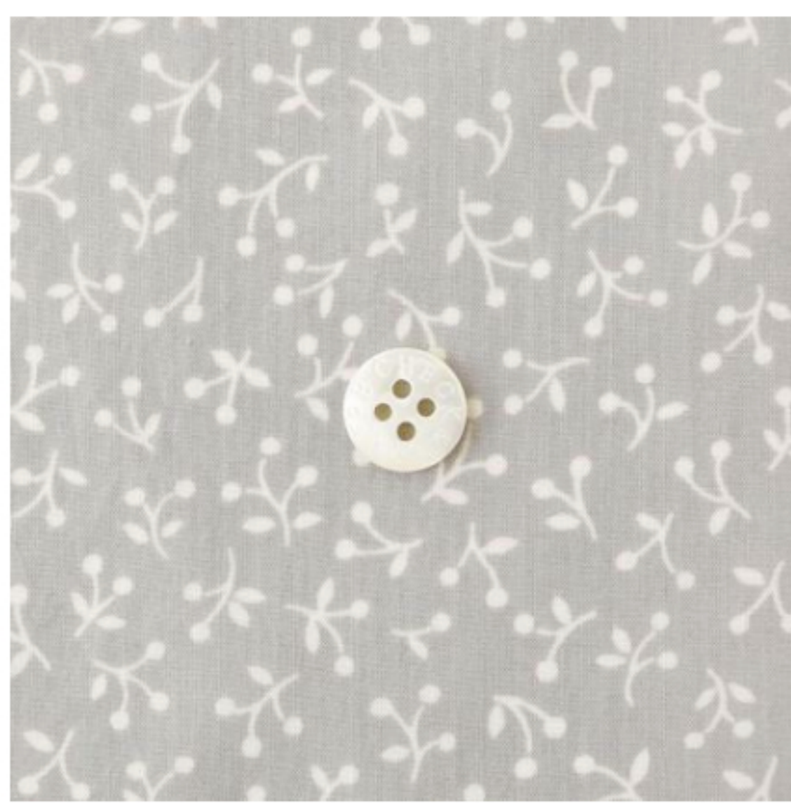
ストーン地にマッシュルーム