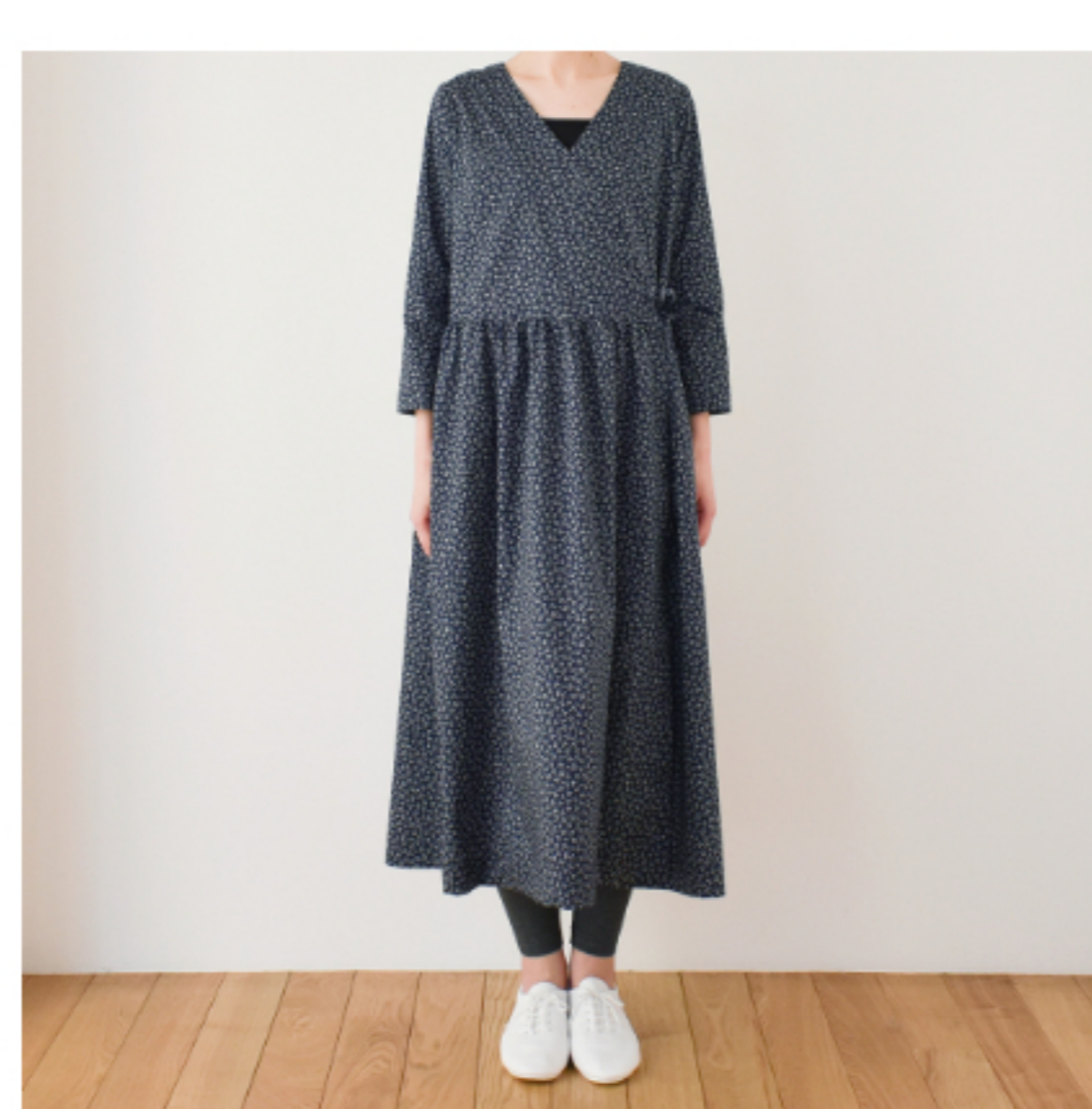
ネイビー地にマッシュルーム: 「パターン172」(カシュクール ワンピース)