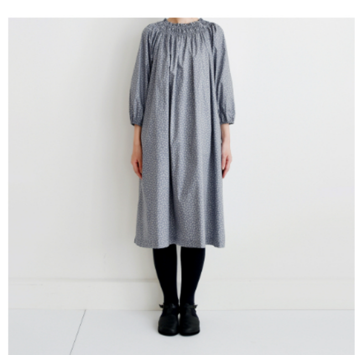
ラベンデュラ地にマッシュル ーム:『CHECK&STRIPE SEW HAPPY』(世界文化社) ゴムシ ャーリングのワンピース 大人