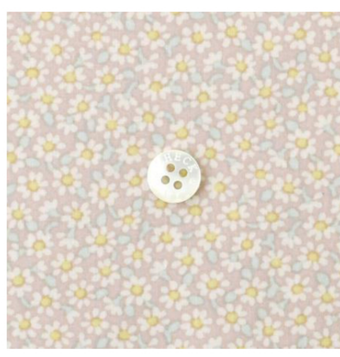
グレイッシュピンク地