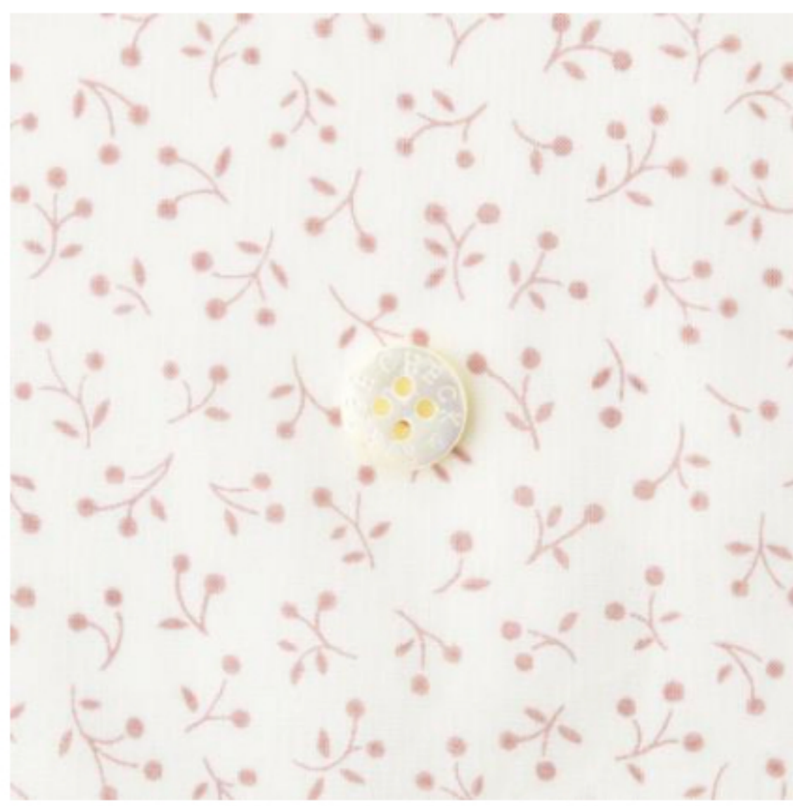
アンティークホワイト地にミスティ ピンク