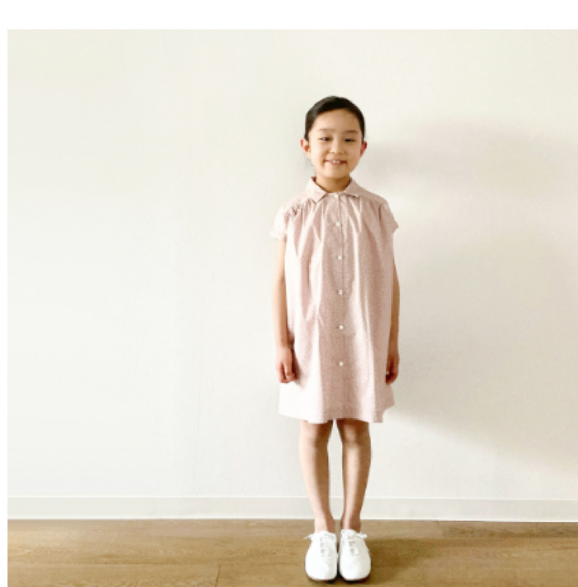
ミスティピンク地にマッシュル ーム:「パターン157」(衿つき ワンピース)