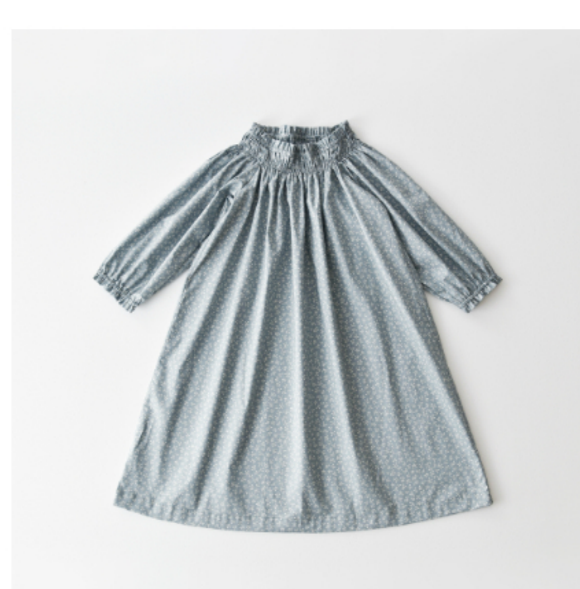
スモークブルーグレー地にマッシュ ルーム:『CHECK&STRIPE SEW HAPPY』(世界文化社)ゴ ムシャーリングのワンピース 子 ども