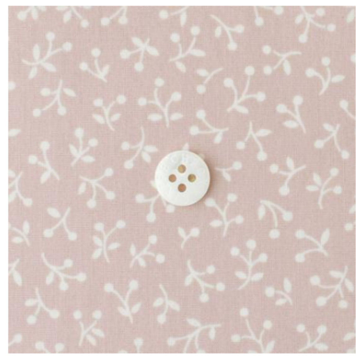
ミスティピンク地にマッシュルーム