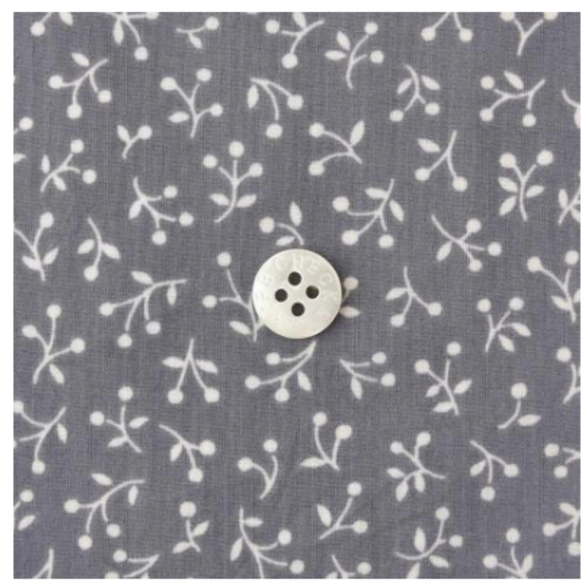
ラベンデュラ地にマッシュルーム