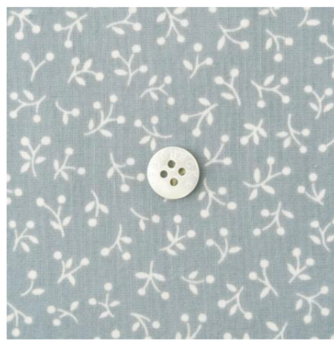
スモークブルーグレー地にマッシュ ルーム