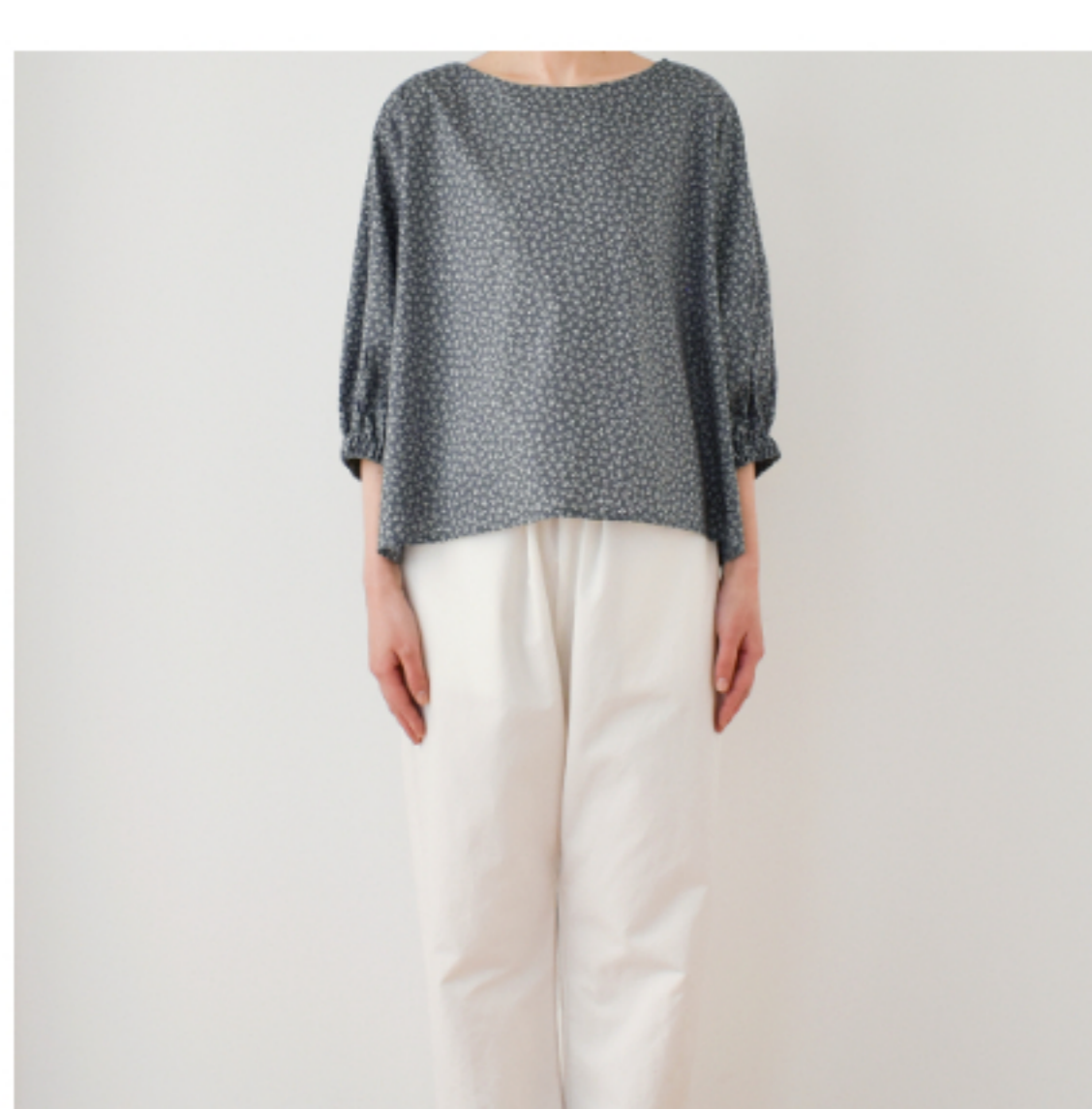
ダークグレー地にマッシュル ーム:『CHECK&STRIPEのおとな 服 ソーイング・レメディ』(文 化出版局) パルーンスリーブのブ ブラウス