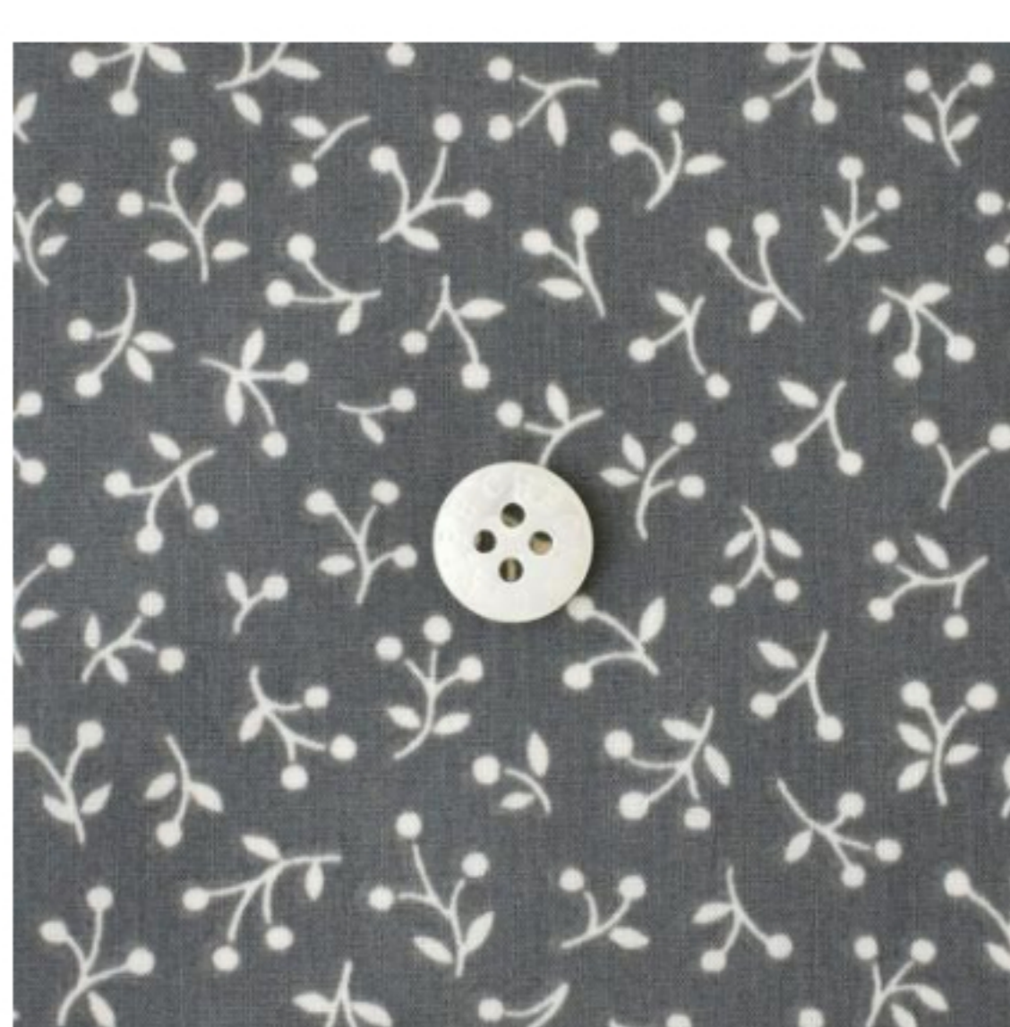
ダークグレー地にマッシュルーム