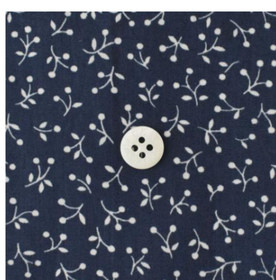
ネイビー地にマッシュルーム