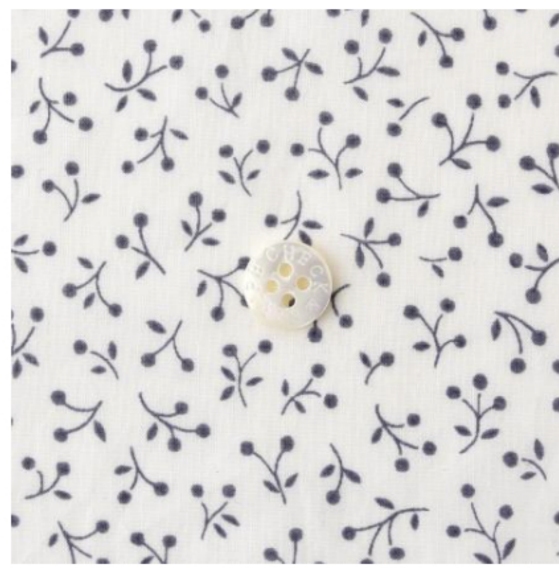
アンティークホワイト地にラベンデ ュラ