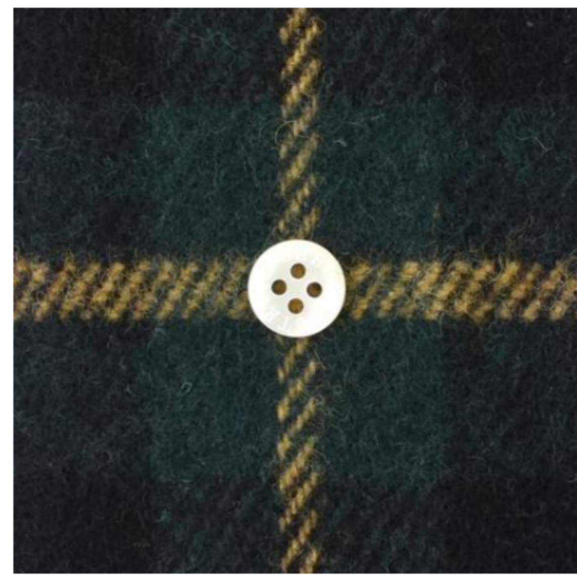
ブラックゴードン