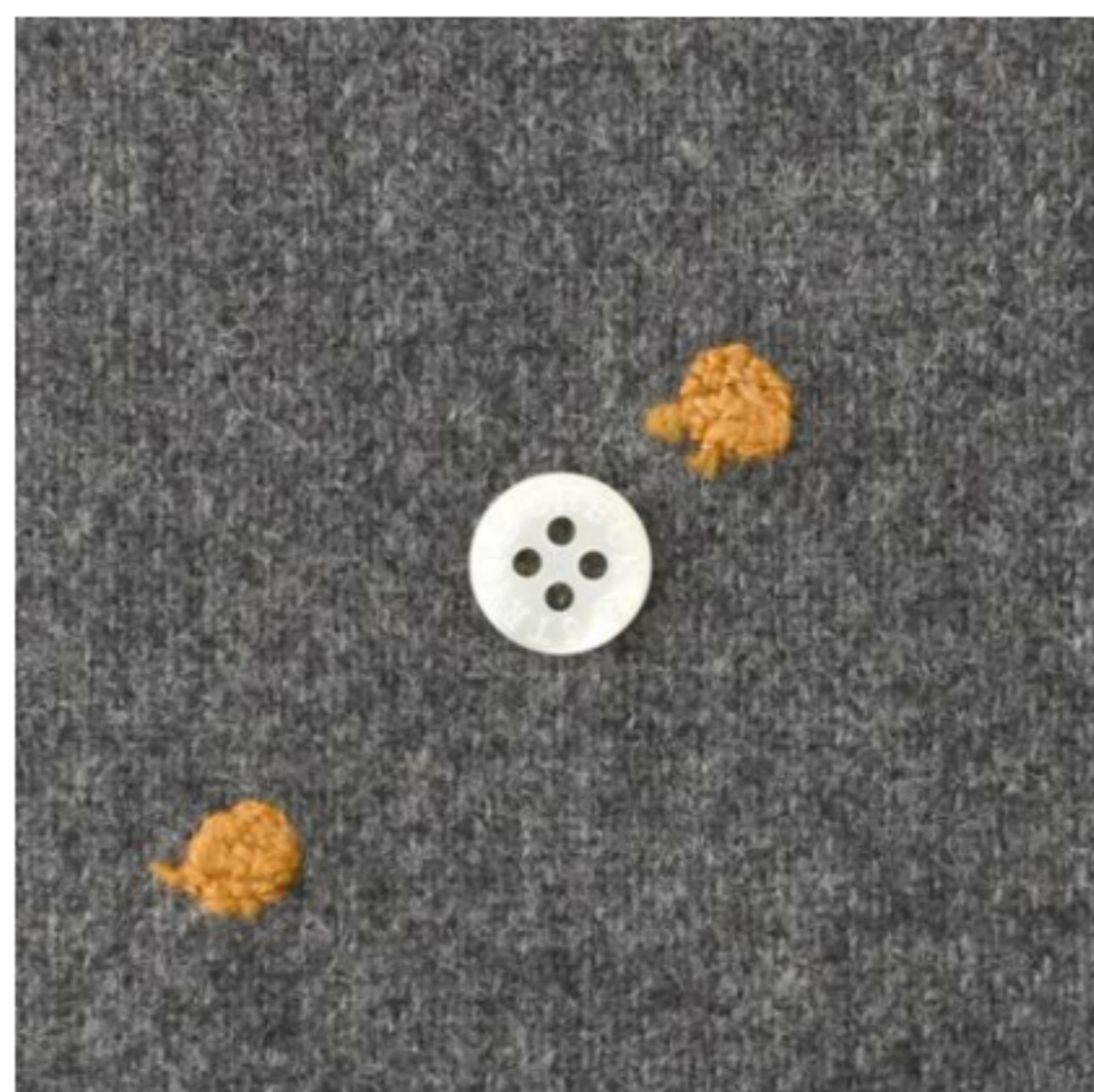
チャコールグレー地にオレンジ