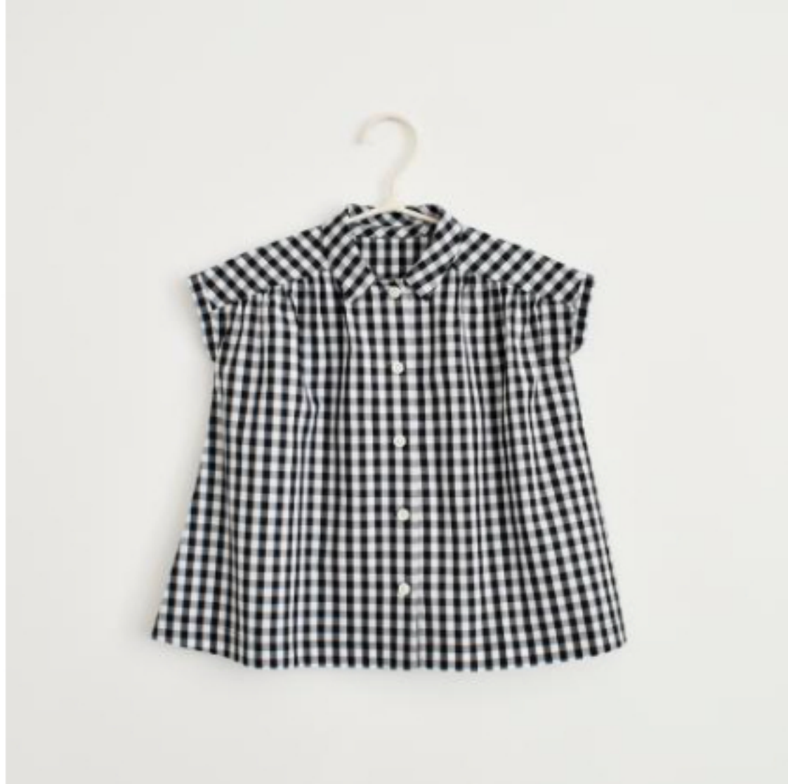
157(衿つきワンピース)