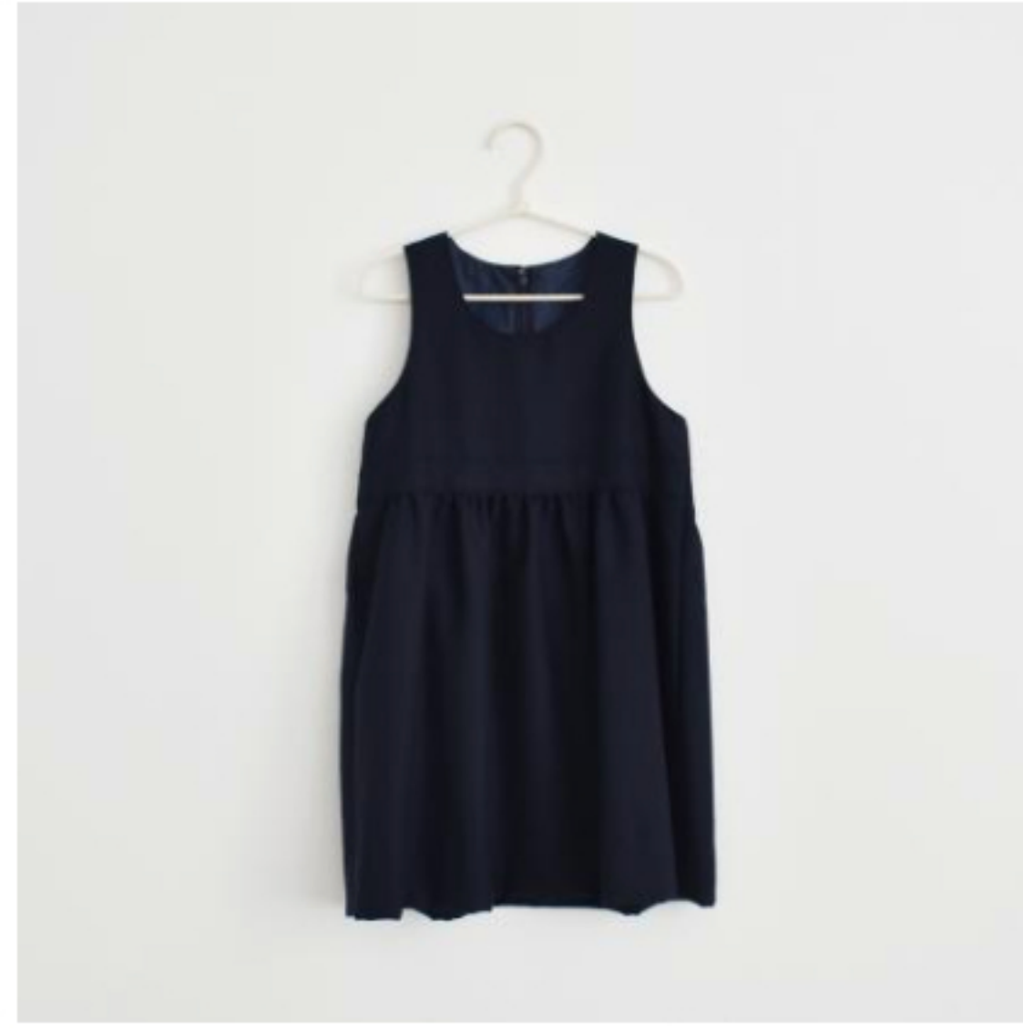
168(ジャンパースカート)