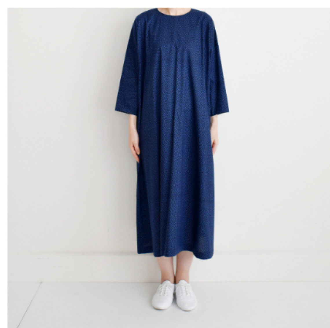
ブラック地にブルー:『CHECK&STRIPEのおとな服 ソーイング・レメディ』(文化出版局) シンプルAラインワンピース