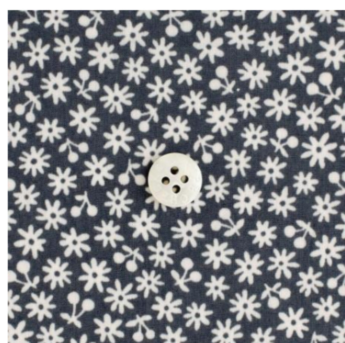
ダークグレー地にマッシュルーム