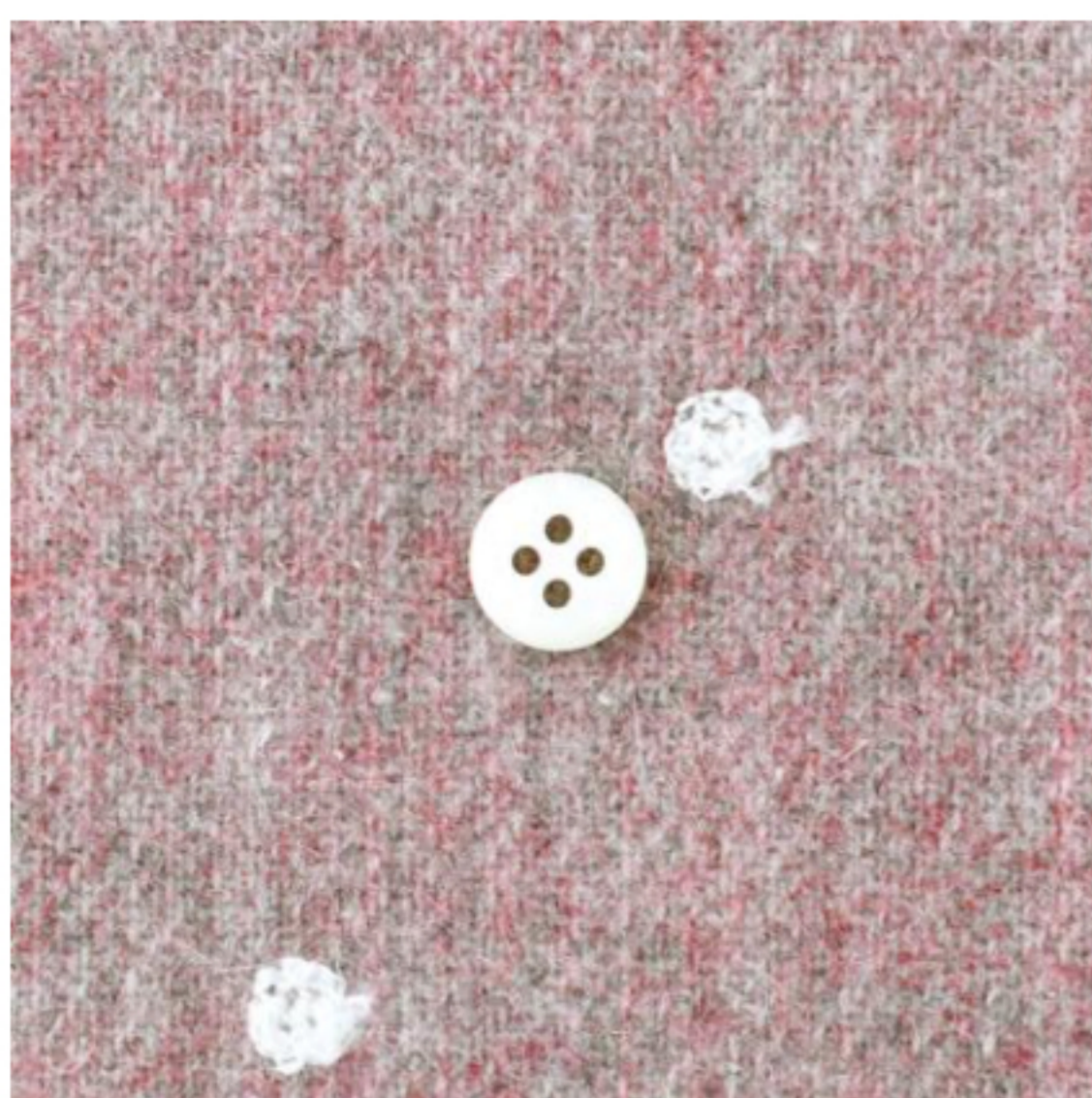
空ピンク地にオフホワイト