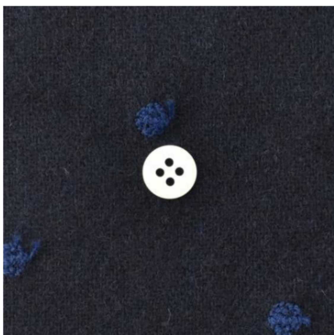
ネイビー地にネイビー