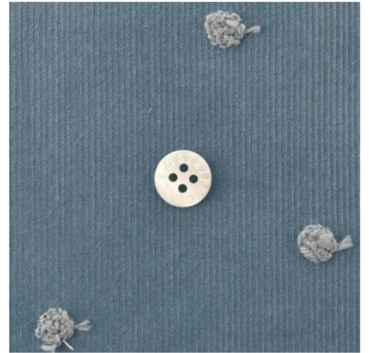
ブルーグレー地にグレー