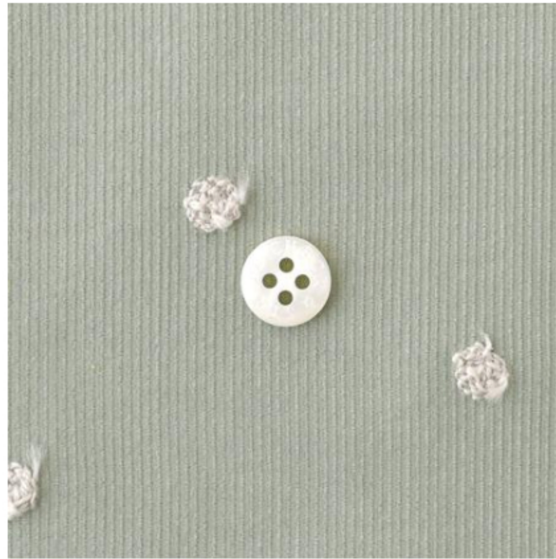
ミンティー地にアイボリー