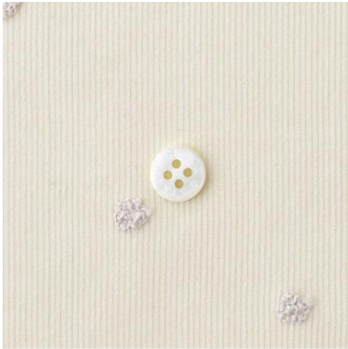
ヴァニニュー地にアイボリー