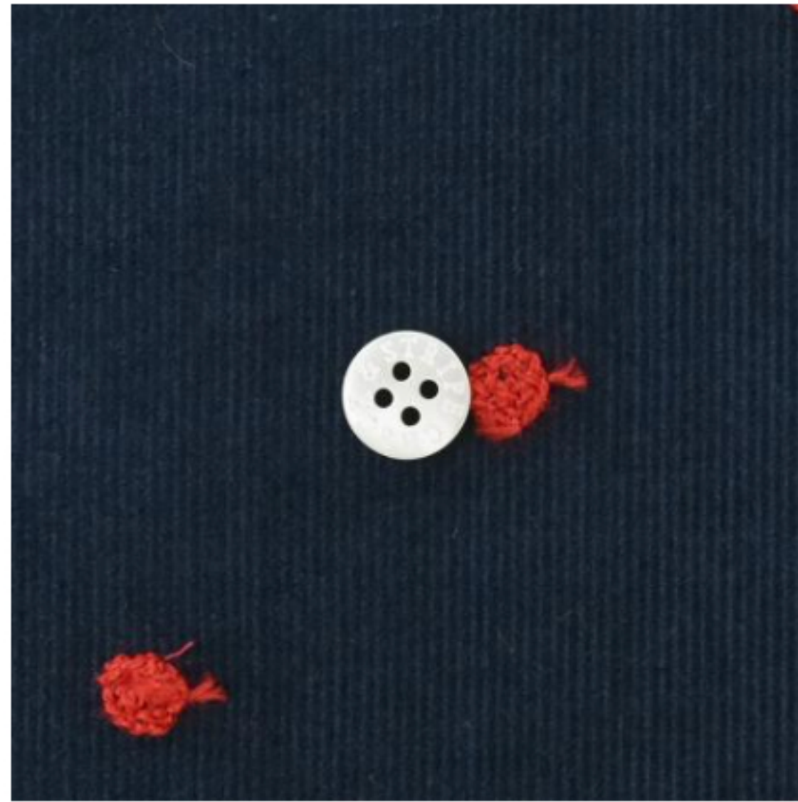
インディゴNV地にスカーレット