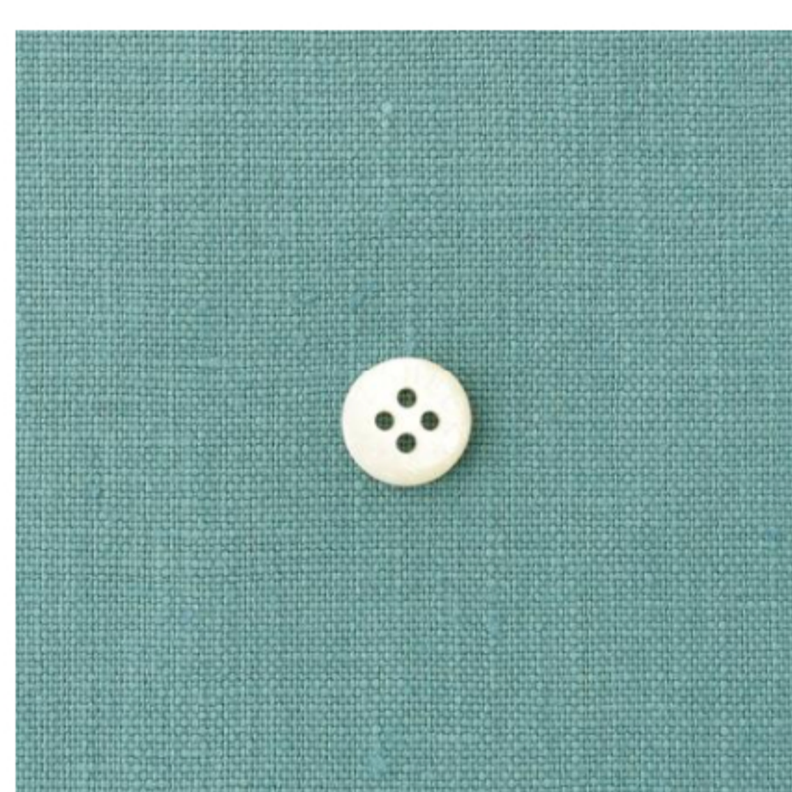
クリームターコイズ