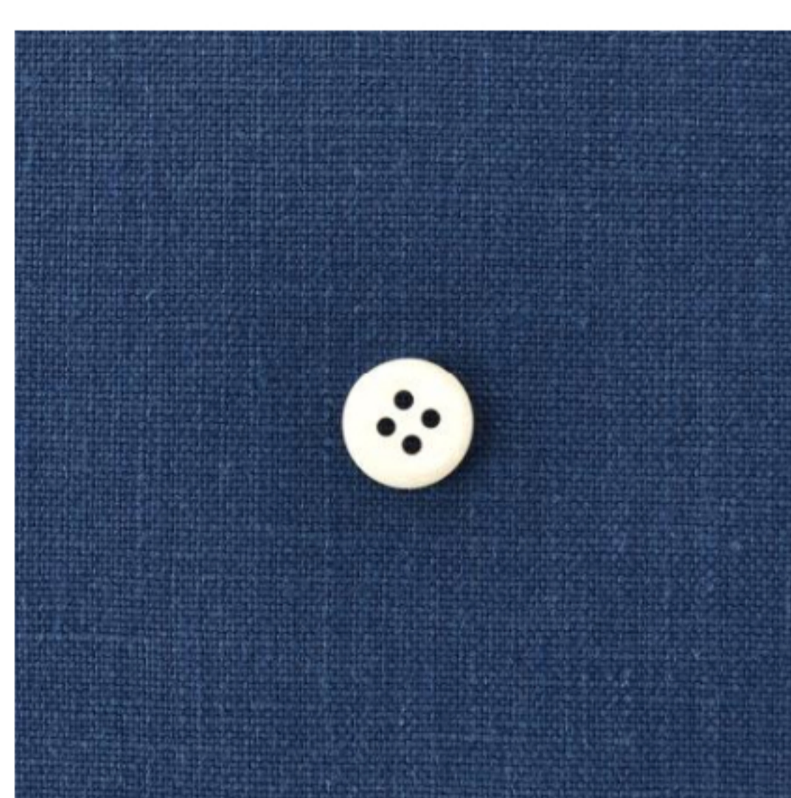
インディゴブルー