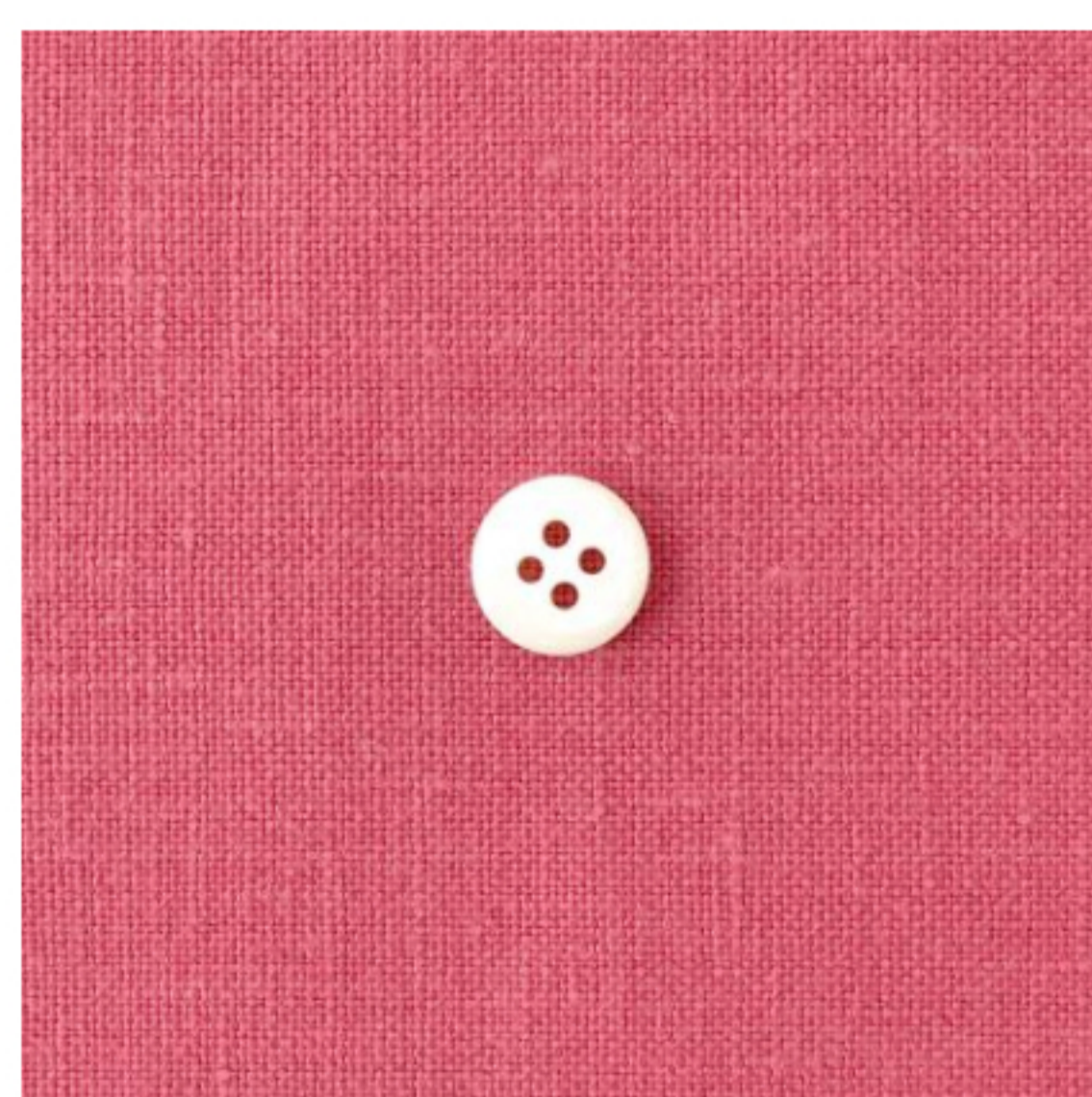
オールドローズピンク