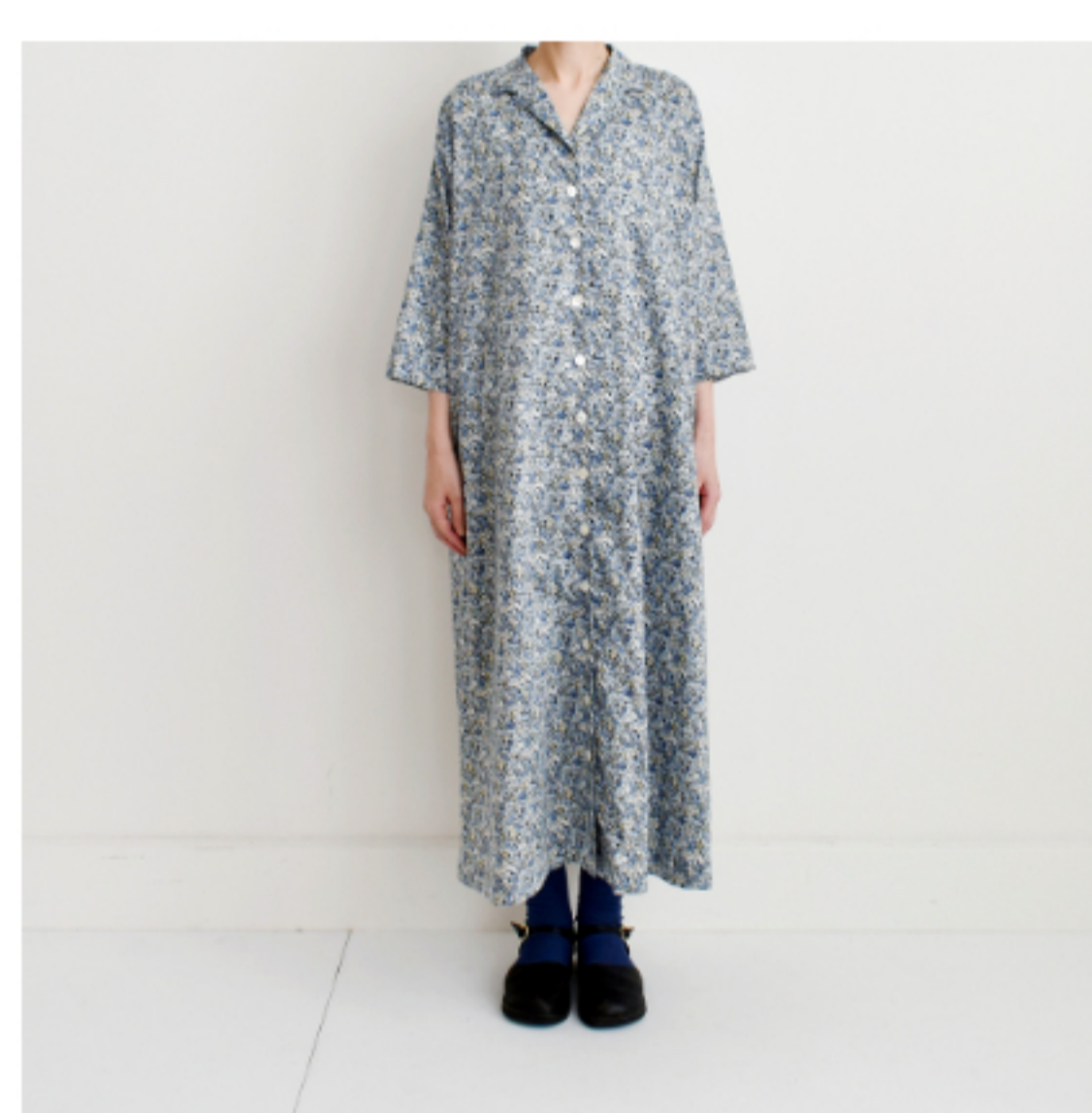
SE: 『CHECK&STRIPE my favorite 私の好きな服』(主婦と生活社) 開衿ワンピース ※袖を10cm伸ばして作製しています。