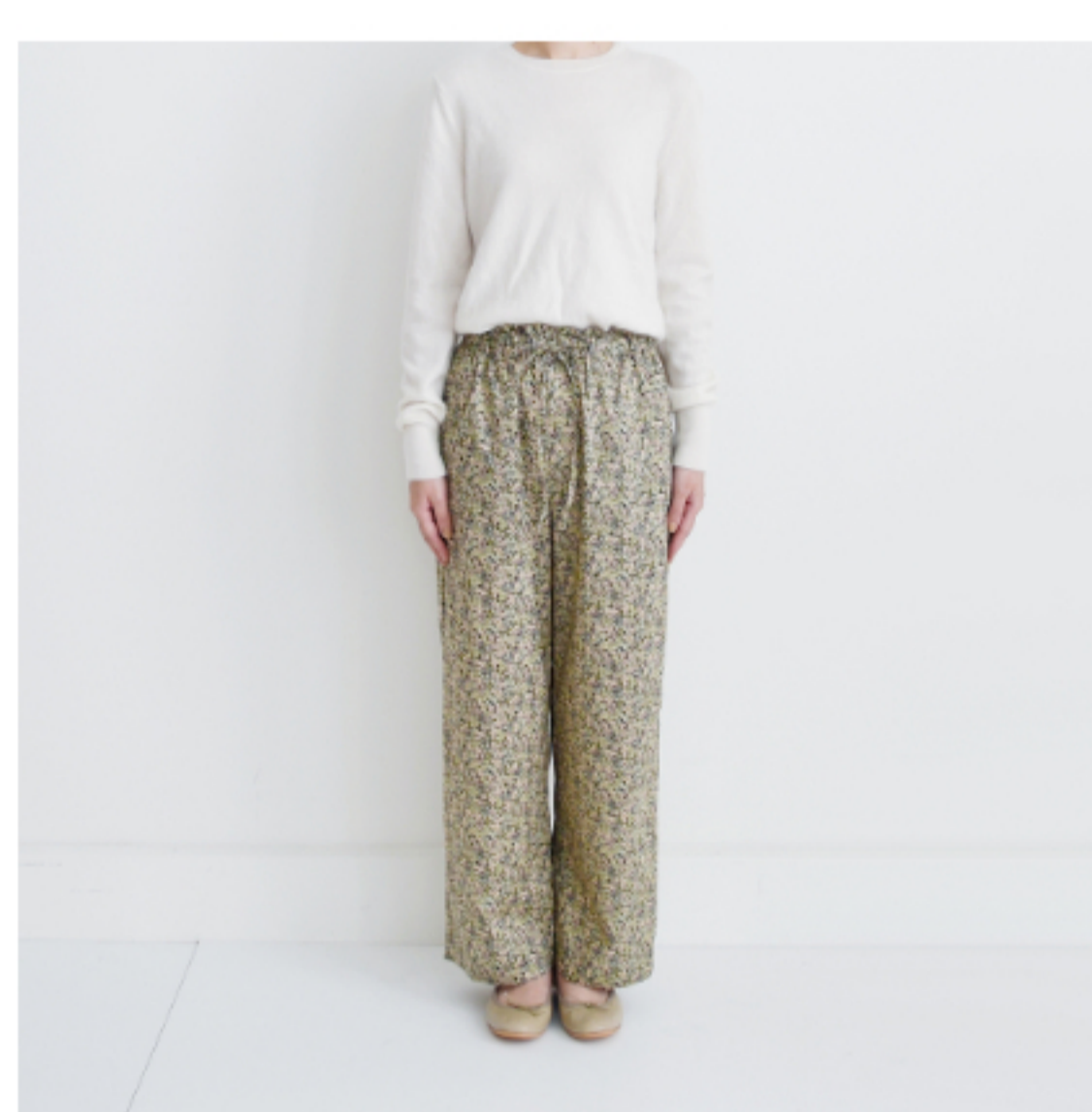
◎J111F: 『CHECK&STRIPEのおとな服 ソーイング・レメディ―』(文化出版局) フローラルパンツ