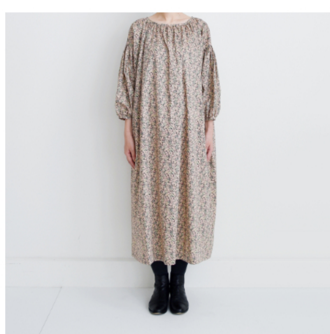
◎J111E: 『CHECK&STRIPEのおとな服 ソーイング・レメディ―』(文化出版局) スタンダードギャザーワンピース