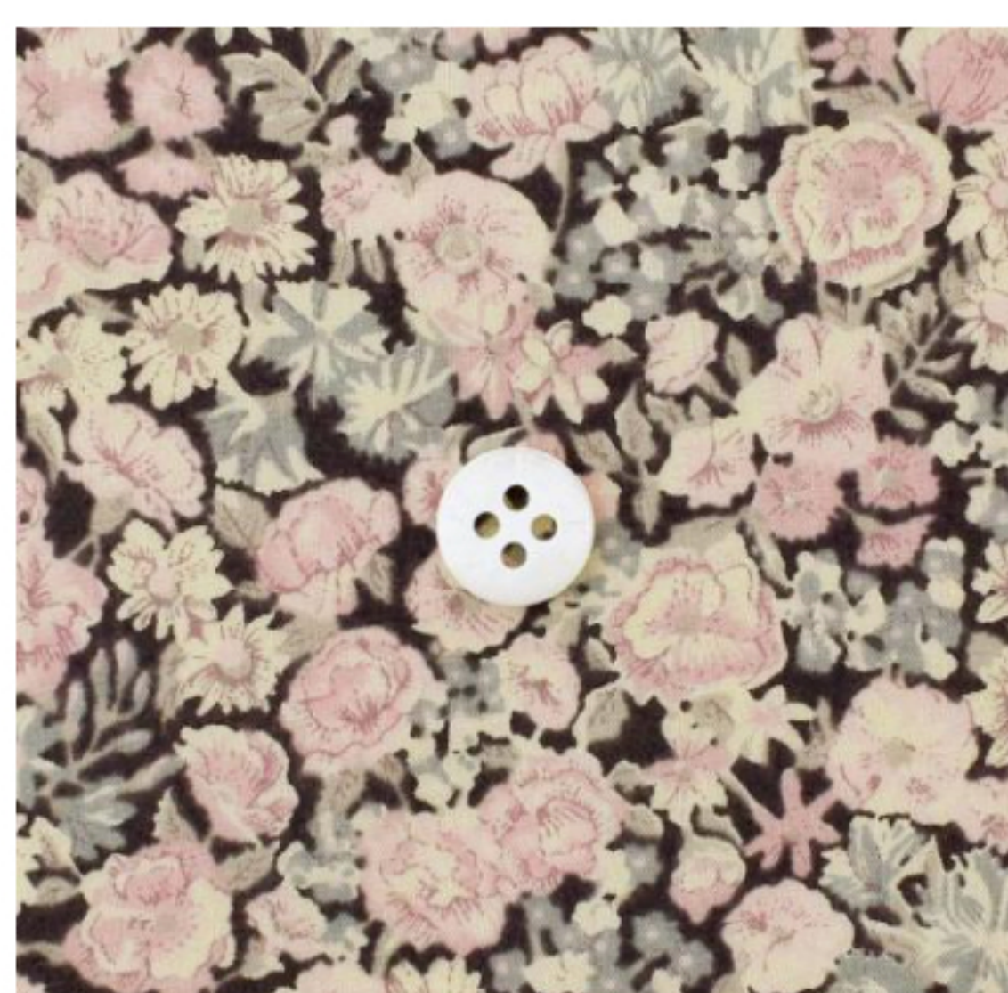
◎J111E(スモーキーピンク系)