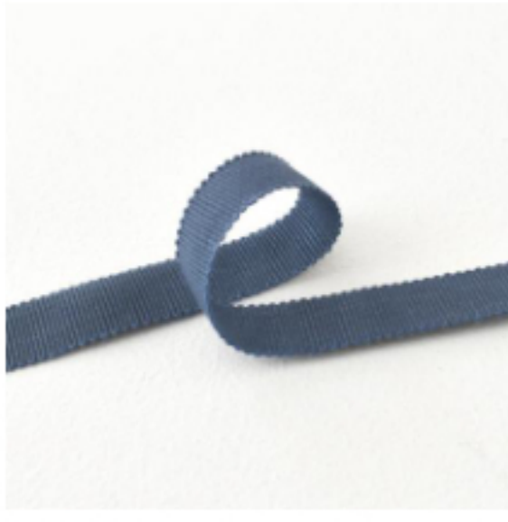
428(グレイッシュブルー)