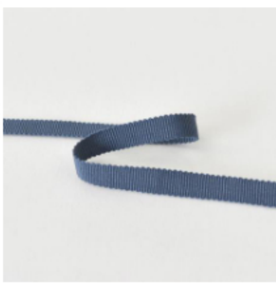
428(グレイッシュブルー)