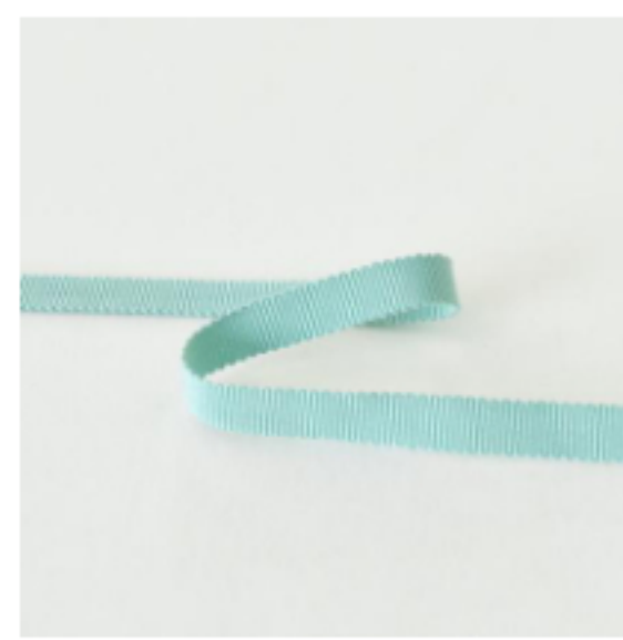
486(スモークグリーン)