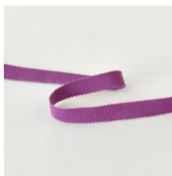
443(ピンクラズベリー)