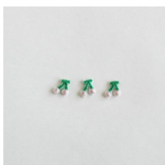
さくらんぼ グレイッシュピンク