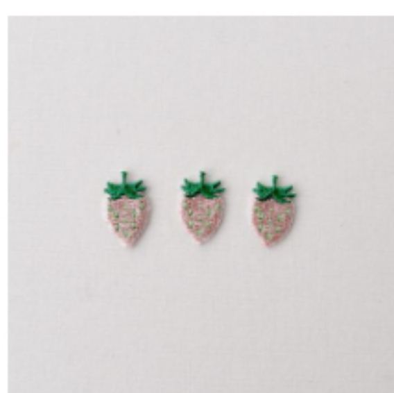
いちご グレイッシュピンク