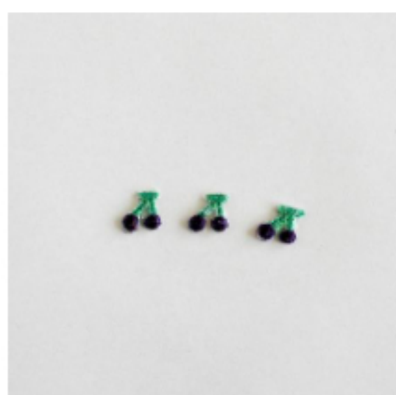
さくらんぼ グレープ