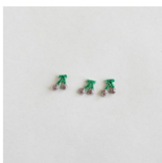
さくらんぼ あずきミルク