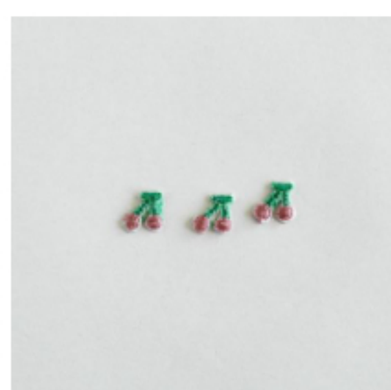
さくらんぼ スモーキーピンク