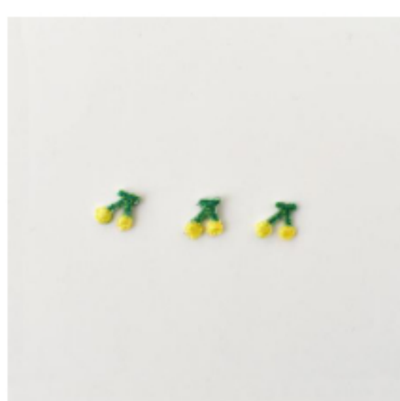
さくらんぼ きいろ