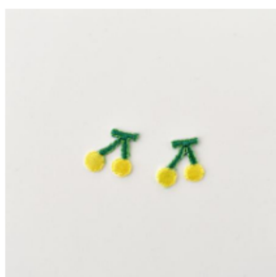
大きなさくらんぼ きいろ