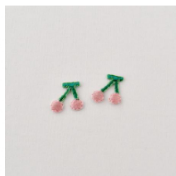
大きなさくらんぼ ストロベリークリーム