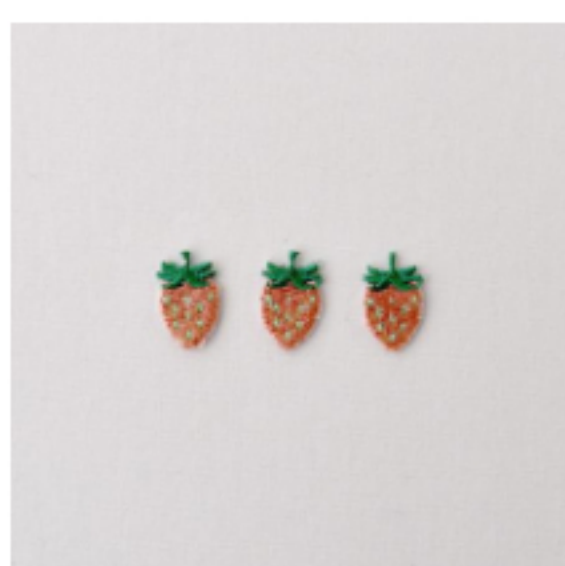
いちご ストロベリークリーム