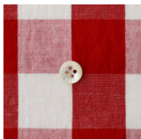
ホワイト × 赤(小)