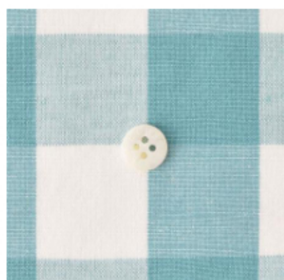
ホワイト × ペールグリーン(小)