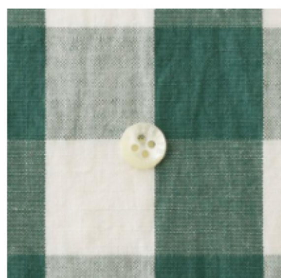
ホワイト × イングリッシュグリーン(小)