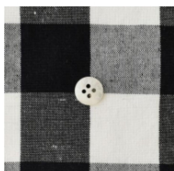
ホワイト × ブラック(小)