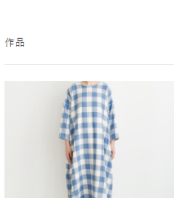
スモークブルー: 『CHECK&STRIPEのおとな服 ソーイング・レメディー』(文化 出版局) シンプルAラインワン ピース