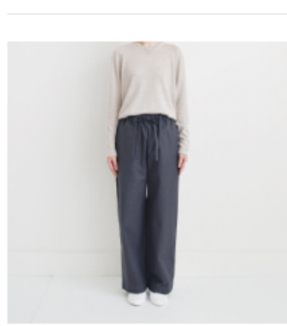
ネイビー×グレー: 『CHECK&STRIPEのおとな服 ソーイング・レメディー』(文化 出版局) フローラルパンツ