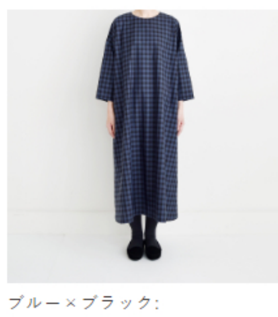
ブルー×ブラック: 『CHECK&STRIPEのおとな服 ソーイング・レメディー』(文化 出版局) シンプルAラインワンピ ース